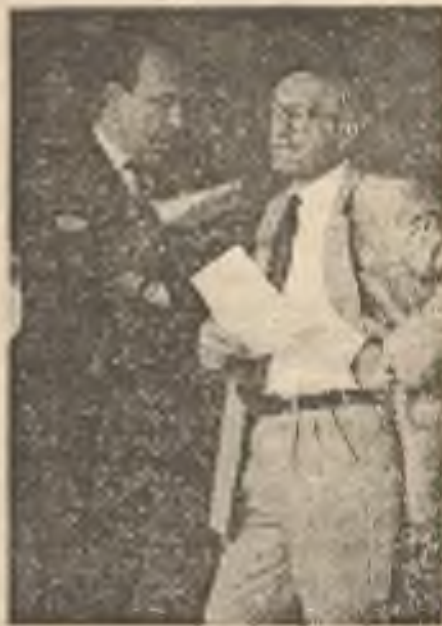
Marián Čalja a Václav Klaus — o čem se asi baví? O reformě, privatizaci, o zvyšování zadluženosti či obraně proti inflaci?