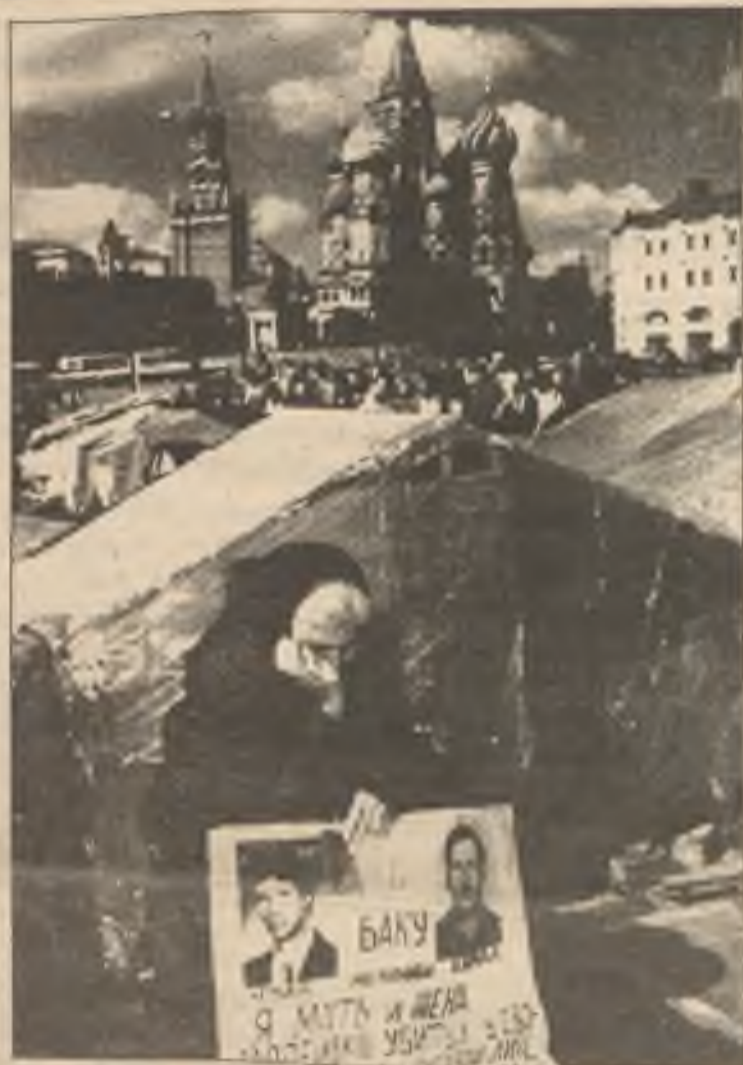
V Moskvě protestují za bezdomovce. Žena s plakátem, na němž jsou obrázky jejích dvou synů, zabitých v Azerbajdžánu, sedí poblíž tábora nouzových stanů v Moskvě, kde Sověti protestují proti trapné situaci lidí bez domova a bez zaměstnání.