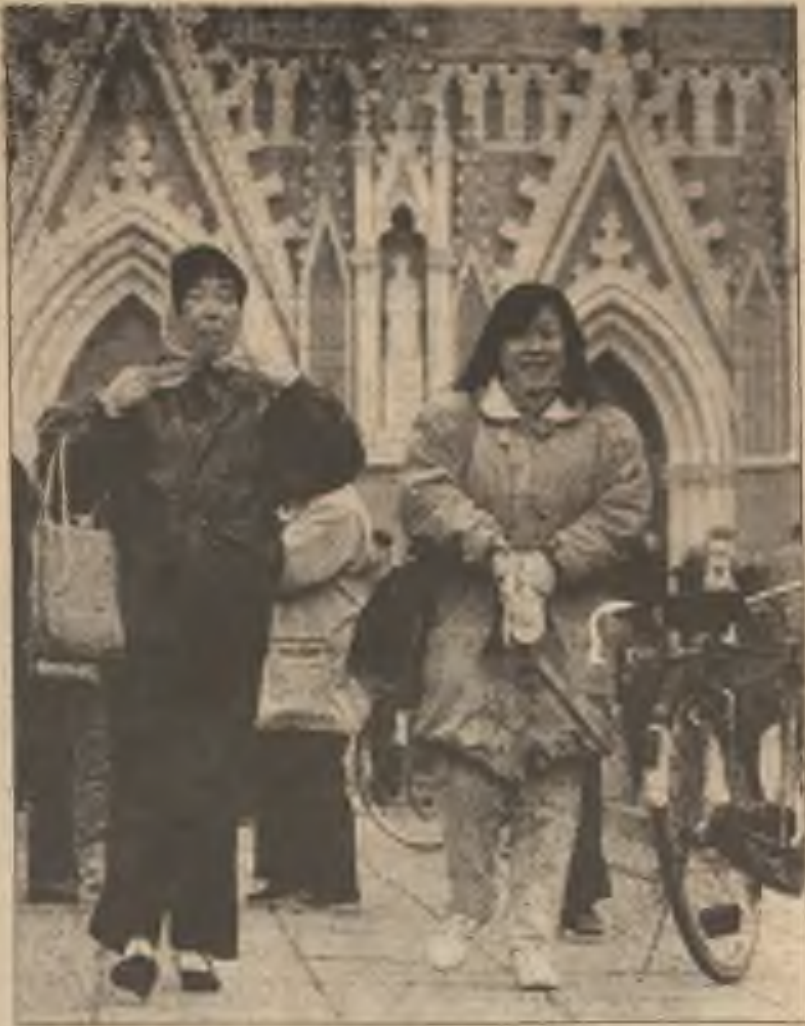
Ženy vycházející z jednoho z Bejlingských 14-ti kostelů po nedělní mši. V minulém roce bylo v čínském hlavním městě postaveno osm nových kostelů.