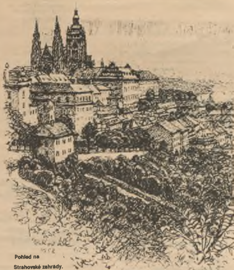
Pohled na Strahovské zahrady.

Spolky se stanovami podobnými někdejší "Ústřední Matici Školské" nejsou již dlouhou dobu nijak žádoucí. Výuka a výchova mládeže od dětství je vedena trochu jinými zájmy, samozřejmě odlišně založenými lidmi, tedy kantory, a k cíli, který se určitě neshoduje s předsevzetími našich dědů a pradědů. Ne, opravdu není přáno takovému druhu pedagogického centra, jehož metody byly označeny za omšelé a nevhodné. Bylo řečeno, že máme vlastní cestu jak vychovávat naše děti ve škole i mimo ni. Vnucuje se dotaz, zda by se nevyplatilo zvážít následky moderní výchovy s hlediska rodinných,