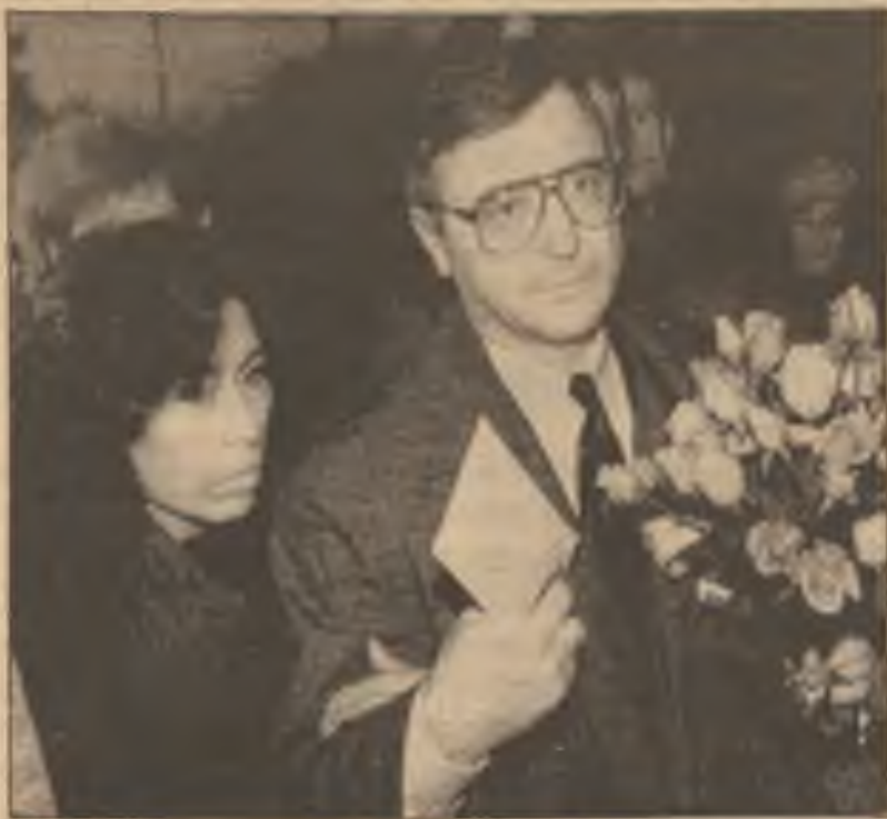
Porazený kandidát na presidenta Stanislaw Timinski a jeho žena Graciela, jsou připraveni na odchod z Varšavy do Kanady.