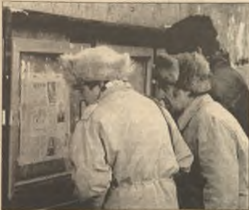
Moskovčané čtou zprávy o posledním vývoji.