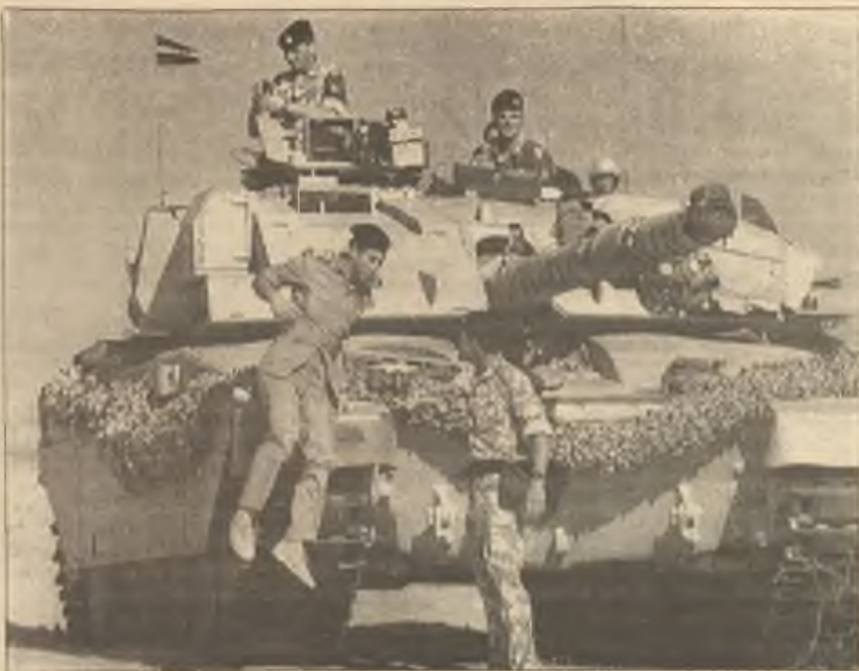
Princ Charles skáče z tanku po 10-ti milové cestě v Saudské Arábii. Princ pak navštívil členy Britské slavné "Dessert Rats" a americké námořníky.