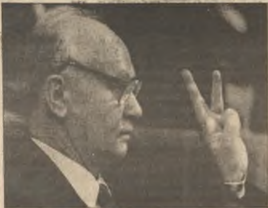
Vladimír Kryuchkov, vůdce KGB policie řekl soudcům: "Budme připraveni na krveprolití když chceme mluvit o vydávání nařízení".