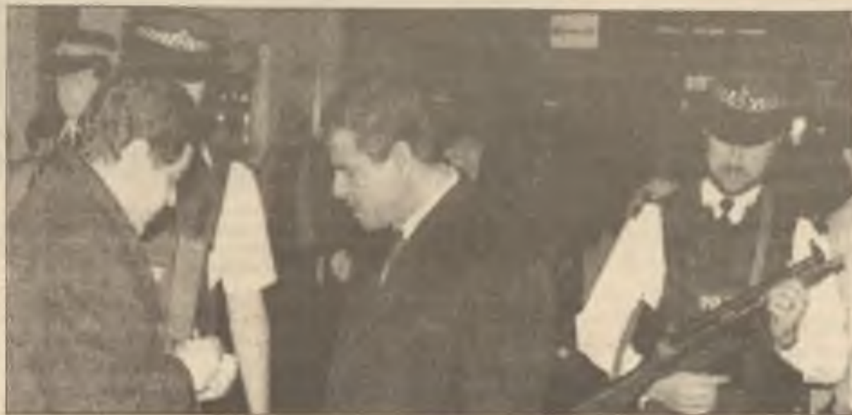
Pod dohledem britské policie dva vypovězení iračtí diplomaté se připravují na odlet z londýnského letiště Heathrow. Celkem bylo dáno 8 irackým vyslancům 24 hodin k přípravě na odlet z Británie.

Havel, ve svém novoročním projevu namaloval chmurný obraz československého hospodářství, ale požádal zemi, aby neztratila naději. Praha se dala na náročnou cestu programu vedoucího k založení tržního hospodářství, ale očekává se, že odstranění kontroly cen na velkou řadu zboží bude mít v roce 1991 za následek inflaci ve výši asi 30%.