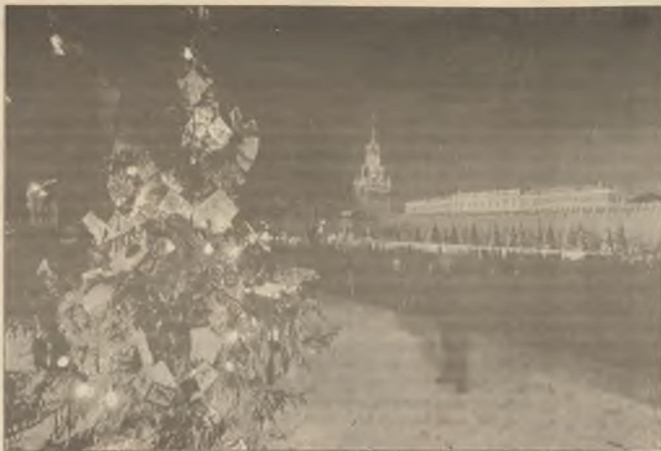
Moskva rozsvítila první vánoční stromeček. Zástup asi 1000 lidí se sešel na moskevském Rudém náměstí, aby viděl rozsvícení prvního vánočního stromečku, který byl ozdoben pozdravními kartami z USA. Východní ortodoxní církve světi vánoce 7. ledna. Toto náboženství začalo prosperovat od doby, kdy prezident M. Gorbačov zavedl nové reformy.

Albánský prezident Alia přislíbil, že první demokratické volby jeho národa, které se mají konat příští měsíc, budou "naprosto svobodné". Nedávné nepokoje v této balkánské zemi se staly příčinou rozsáhlé emigrace a ministerský předseda sousedního Řecka má přijet do Tirany na návštěvu ve snaze přimět albánské Řeky, aby zůstali kde jsou.