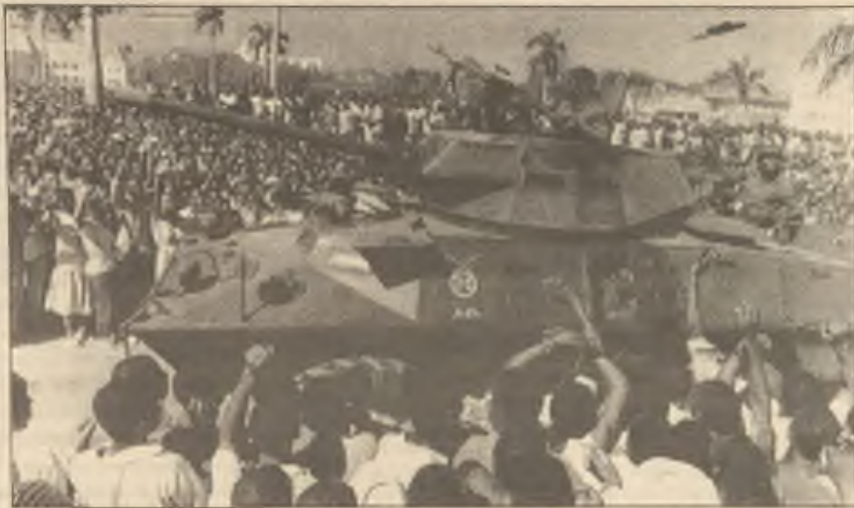
Občané Haiti zdraví tank, který projíždí kolem hlavního stanu armády v Pirt-Au-Prince. Armáda zatkla vůdce puče Rogera Lafontani po jeho pokusu o zmocnění se vlády z ruky presidenta Ertha Pascal-Trouillota. Armáda zabránila pokusu o puč.

Reuters hlásí z Moskvy, že Boris N. Jelcin, hlava obrovské ruské republiky, pokazil snahu sovětského presidenta Michaila Gorbačova o sjednocení země. Řekl, že jeho území podrží 48 bilionů ze sovětského ústředního rozpočtu. Toto prohlášení od vůdce nejmenší sovětské republiky vyloženo podmínou Gorbačovo ujištění, že v brzké době se dohodne s neklidnými republikami Sovětského svazu.