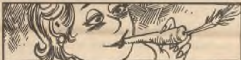
People once mistakenly believed eating carrots would aid asthma.

POTŘEBUJETE koupit, prodat, pronajmout, hledáte či nabízíte zaměstnání? Hledáte seznámení? Volejte přímo naše. odd. MALÝ OZNAMOVATEL Classified 749-1891 nebo 749-1898