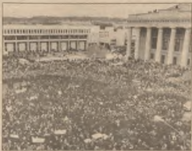
U parlamentní budovy ve Vilně se v pátek shromáždilo asi 4.000 Litevců v odpověď na volání, aby se "moc národa" postavila na obranu proti sovětskému vojsku.