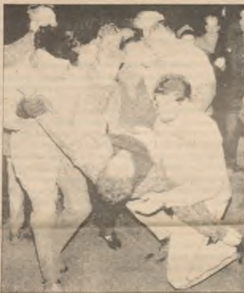
Zraněný civilista je odnášen za sovětského útoku v neděli na televizní věž ve Vilně na Litvě, jehož výsledkem bylo 13 mrtvých.