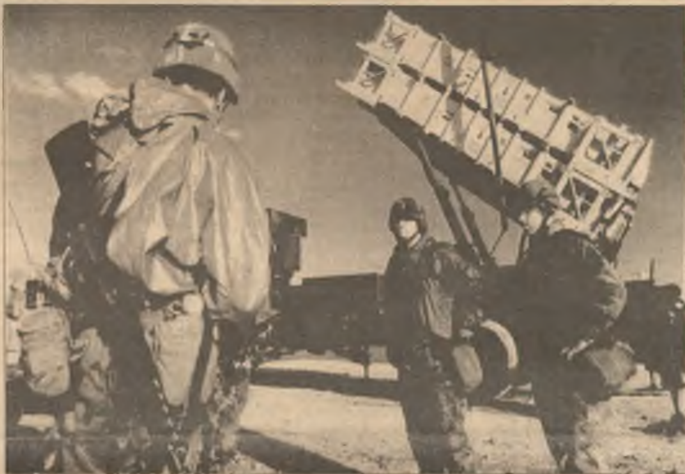
Američtí vojáci stojí před baterií protiraketových Patriotů v Izraeli.

Napětí tvoří základ spolupráce kongresu a spojenců ve válce v Perském zálivu. Zákonomárci obviňují administraci z pokusů o zakrytí gigantických výloh konfliktu. Předsedové rozpočtového výboru v senátě a v Domě zástupců hrozí žalobou, aby si vynutili plné odhalení. Předseda z Domu zástupců měl být informován již v pátek. Podpoře politiky Sovětů v zálivu se dostalo uznání, ale může mít také svůj rub. Spolupráce může zesílit Bushův instinkt, aby se vyhnul ostré srážce z příčin dnešní situace v baltických státech, ale tím může ještě více podráždit zákonodárce. Nová starost kongresu: Jak udržet dohromady arabské spojence, jestliže Izrael se rozhodne k odvetě proti Iraku za jeho odstřelování izraelských měst.