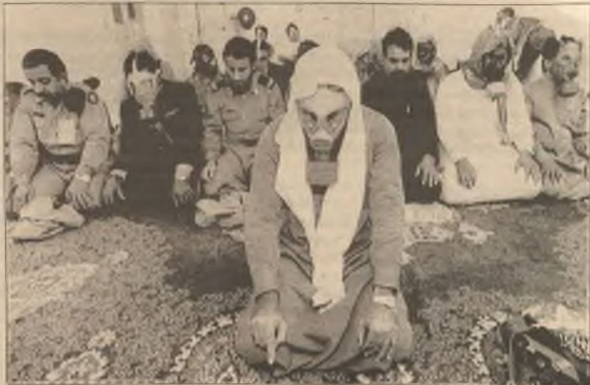
Někteří vojáci, hoteloví zaměstnanci a hosté jsou připraveni na nejhorší, modlí se na spodní podlaže hotelu, která se používá jako úkryt před bombami, ve východní Saudské Arabii.

Protože se vyjádření jednotlivých zasvěcených lidí poněkud liší a nedá se říci, že by někdo z nich pronesl ver-