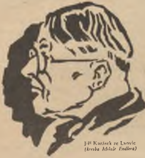
Jiří Karásek ze Lvovic (kresba Miloš Endlera)