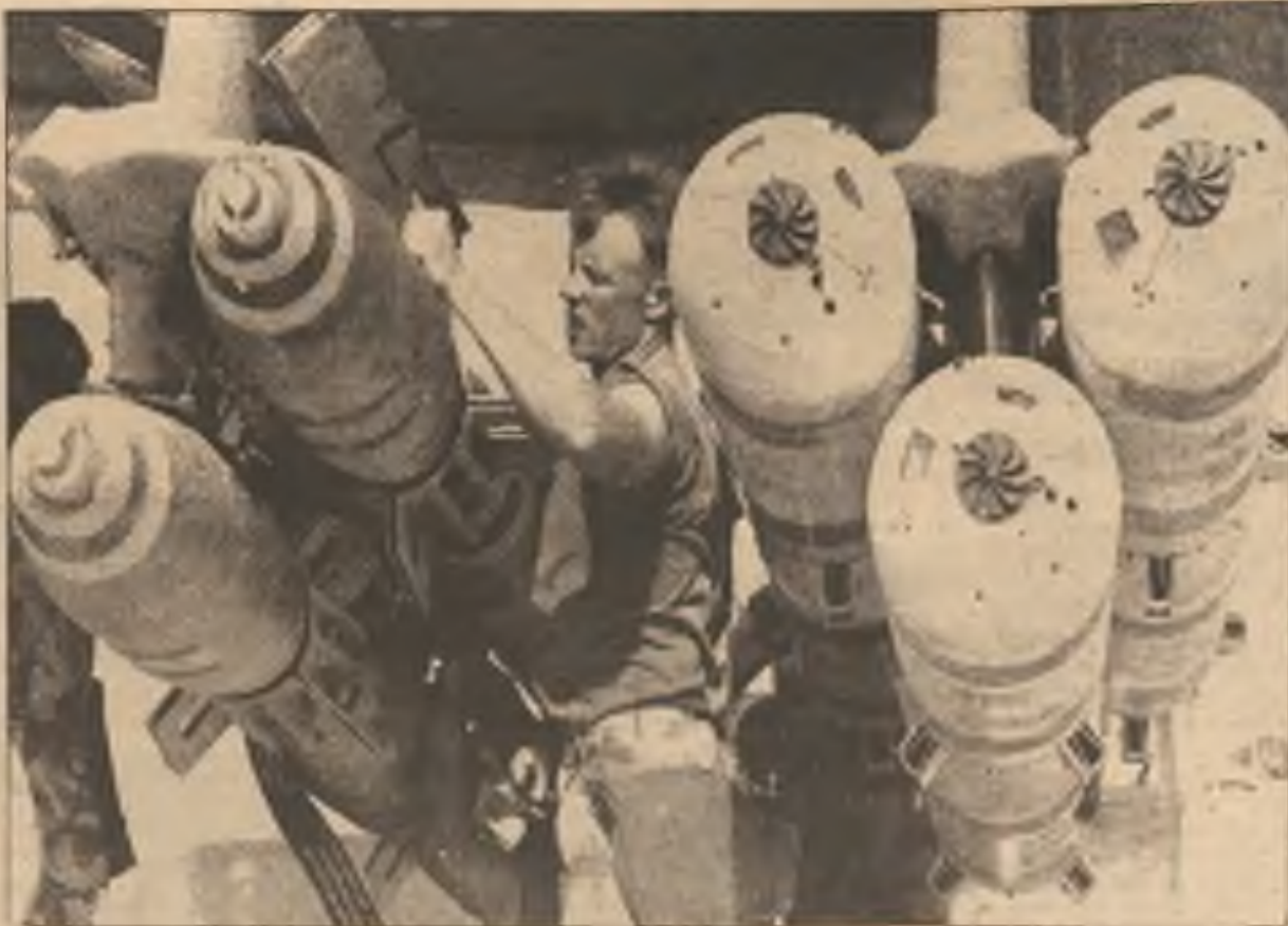
Americký voják připevňuje 500-liberní bomby pod křídla letounu A6 Intruder na letecké základně v Zálivu. Americká letadla pokračovala v hledání a ničení irackých raket.

Německý nový parlament jmenoval dřívějšího kancléře Západního Německa Helmuta Kohla, aby pokračoval ve vedení spojeného národa. Německý první svobodně zvolený parlament po šedesáti letech rozhodl se v poměru 378-257 pro Kohla, který dovedl Německo k plnému sloučení za dobu kratší než jeden rok po odstranění berlínské zdi hanby.