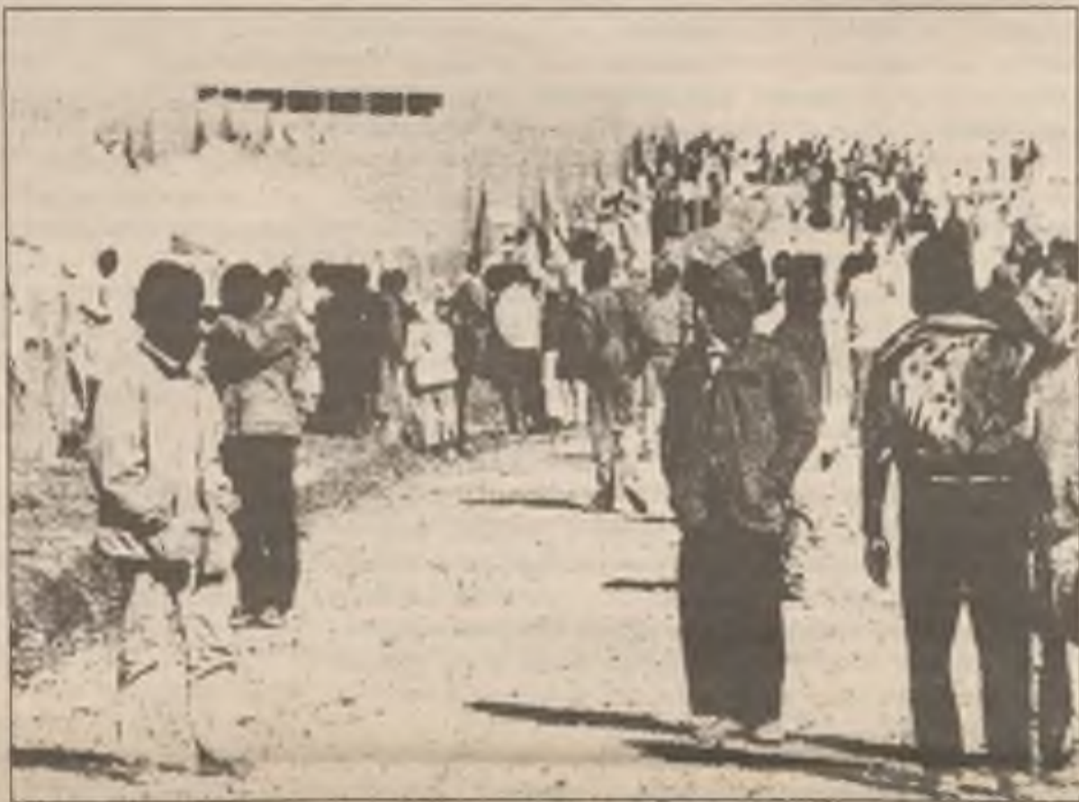
Stovky uprchlíků z válkou poničeného Iraku se pohybují v jordánském táboře Azraku, asi 50 mil na jih od Amanu. V pondělí Irak znovu otevřel hranici s Jordánem a dovolil odejít uprchlíkům v počtu 1.000.