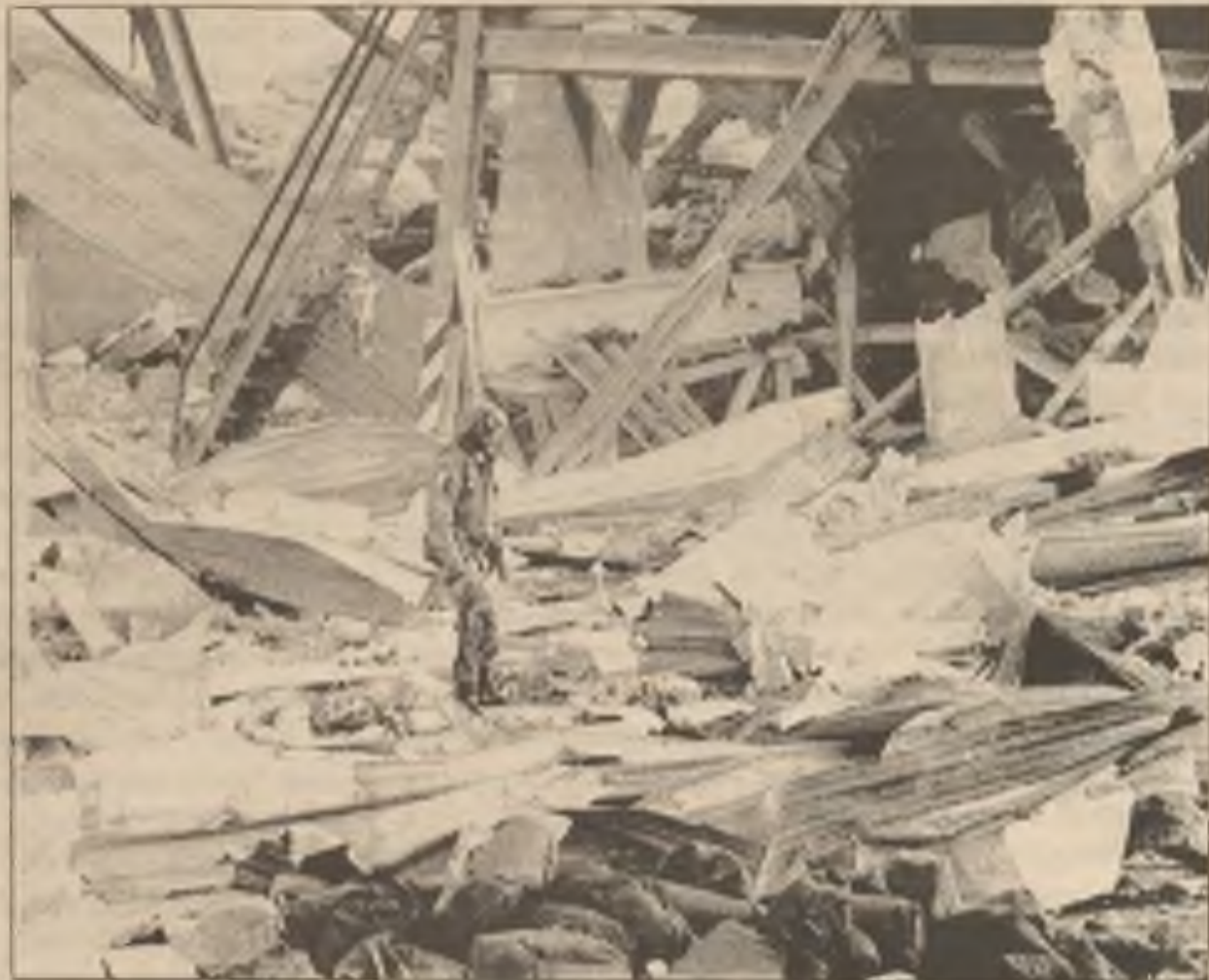
Voják prochází rumištěm amerických baráků blízko Dhahranu v Saudské Arábii, které byly zničeny minulé pondělí irackou střelou Scud. 28 Američanů bylo zabito a asi 100 raněno.

klesl o 23.27 bodů na 2864.60. Akcií které klesly, bylo víc než těch, které stouply, v poměru 3:1, na burse v New Yorku (New York Stock Exchange), kde byl obchod mírný - 164.2 milionů dolarů. Akcie klesly přesto, že se zvedl optimismus nad postupem v Zálivu. Analyisté říkali, že je čas, aby se ceny opravily.