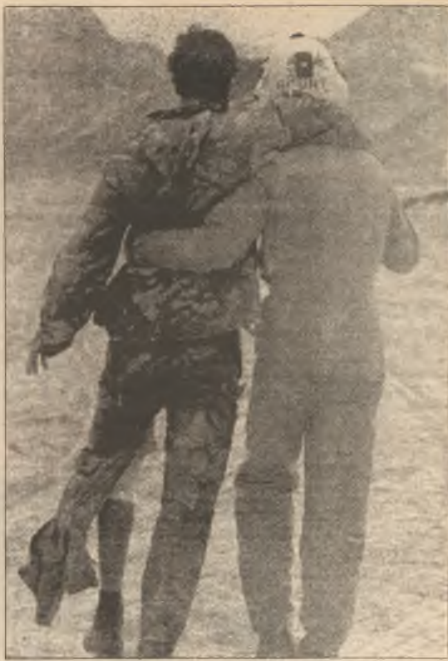
Americký letec pomáhá raněnému irackému zajatci do polní nemocnice v Saudské Arábii, po boji ve válečném pásmu minulou neděli.

But we have justice and history on our side.