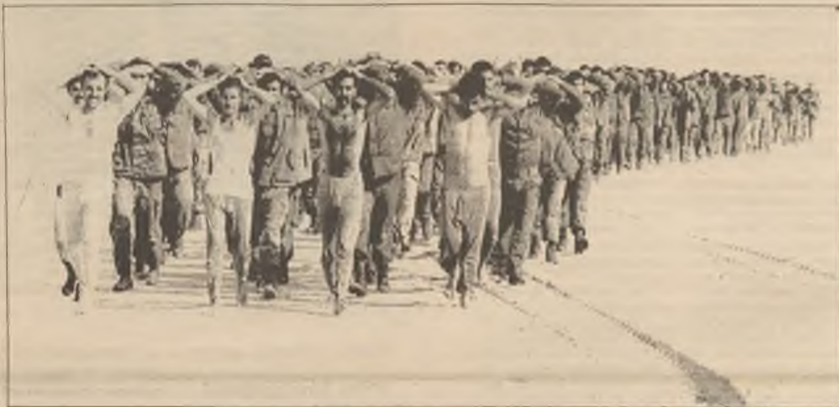
Irackí váleční vězňové, zajatí americkými námořníky, pochodují směrem k procesnímu středisku v Kuwaitu minulou neděli, první den pozemní války.