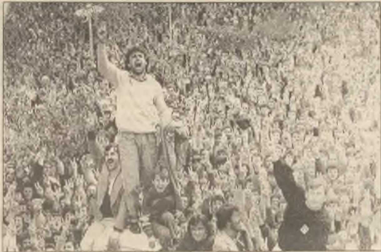
Albánci se v pondělí shromáždili před ústředím své demokratické strany v hlavním městě Albánie, Tiraně. Jejich oponenti - komunisté vyhráli v neděli svobodné volby.