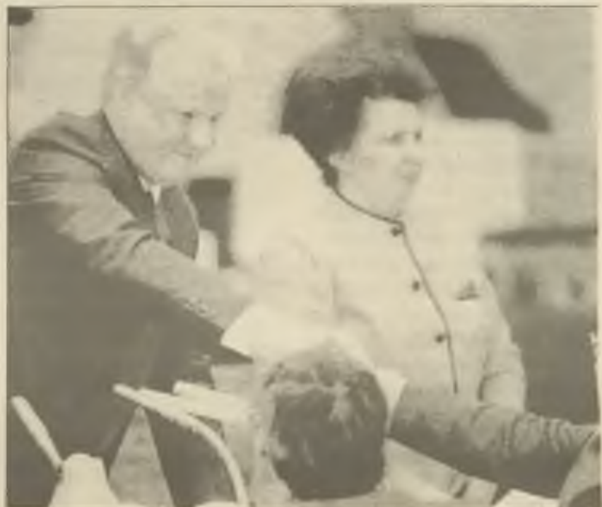
Ruský vůdce Boris Jelcin přijímá gratulace během posledního dne zvláštního zasedání plného ruského parlamentu, zatímco jeho náměstek Galina Goriachoeva přihlíží.