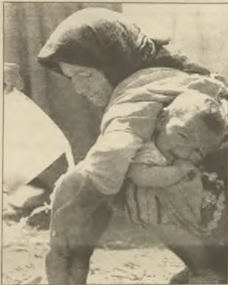
Kurdská matka ošetřuje své dítě v uprchlickém táboře, hned za tureckou hranicí. Znečištěná voda a špina způsobují onemocnění.