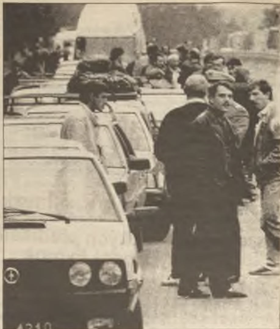
Poláci čekají u přechodu do Frankfurtu nad Odrou v Německu po tom co Polsko uvolnilo visová omezení. Někteří polští návštěvníci byli štváni neonacisty.

Bezpečnostní Rada Spojených národů přijala resoluci na trvalé příměří v Perském zálivu. V jádru resoluce formálně končí válku a zbavuje Irak schopnosti vést válku. Ihned po vyhlášení podmínek, iracký vyslanec nazval resoluci potupnou, ale nenaznačil zda Bagdad ji přijme či odmítne. Podmínky, které byly schváleny