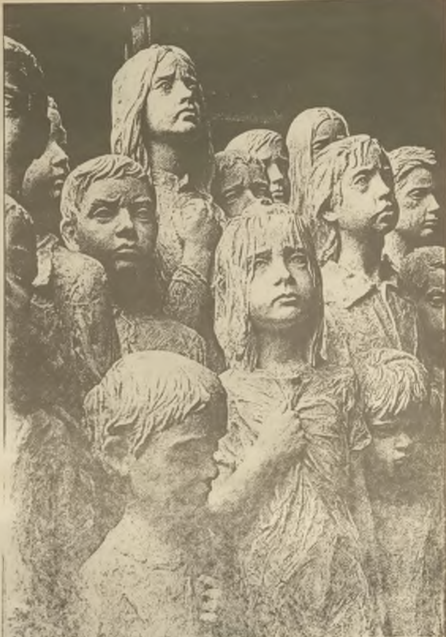
Malá část sousoší lidických dětí zavražděných nacisty v r.1942

Druhým důležitým bodem květnové schůze byla, jako