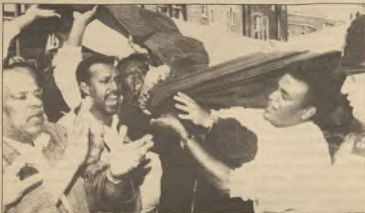
Habešané tančili na ulicích Londýna s vlajkou své země (Ethiopie) blízko hotelu, kde se ujednával mír. Etiopiští rebelové zaútočili na hlavní město v úterý před svítáním a již ve středu měli kontrolu města, téměř bez boje. Addis Ababa zůstala téměř nepoškozená.