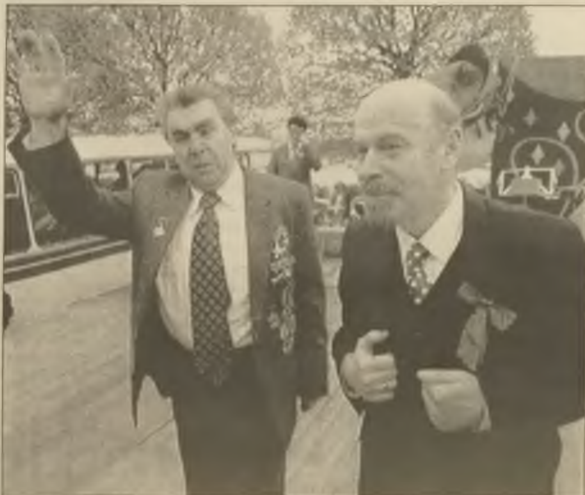
Leningrad oslavuje své založení jako St. Petersburg před 288 lety. Při tom dva mužové zobrazují dřívější sovětské vůdce: Leonida Brežněva (vlevo) a Vladimíra Iljiče Lenina.

Příležitost k šikanování vězňů dozorcem prakticky odpadla.