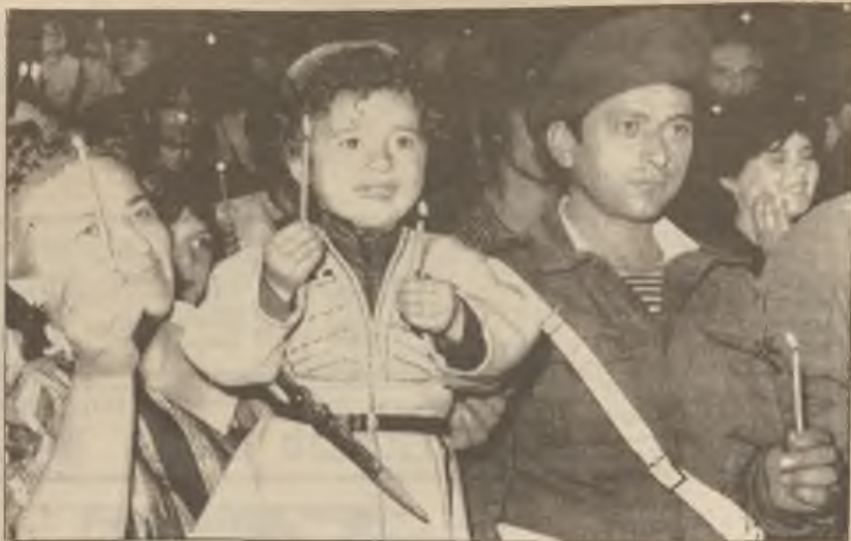
Mladé děvče, oblečené v tradičním gruzínském kroji drží svíčku na oslavu zvolení prvního nekomunistického presidenta Gruzie při ceremonii v Tbilisi, hlavním městě republiky.

"Ron Dellums z Kalifornie tak často zastával některá právě z těch hnutí a vlád, o kterých Spojené státy sbírají informace, že je