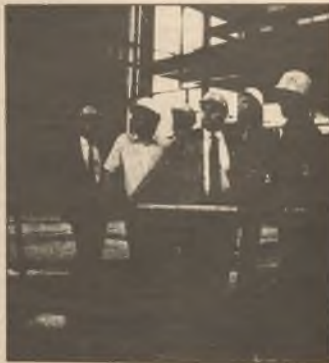
Vladimír Dlouhý a Marian Čalfa na JE Temelín