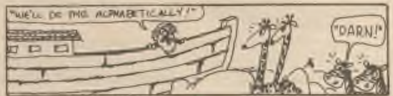
People have used petroleum for thousands of years. The Bible mentions that Noah used a solid form of petroleum, called pitch, in building the ark.

sebe. Problém je v tom — urobiť všetky uzávery a odpovede v požadovanom čase, alebo pred jeho uplynutím. Ak máte pocit, že to chcete skúsiť — zkúste.