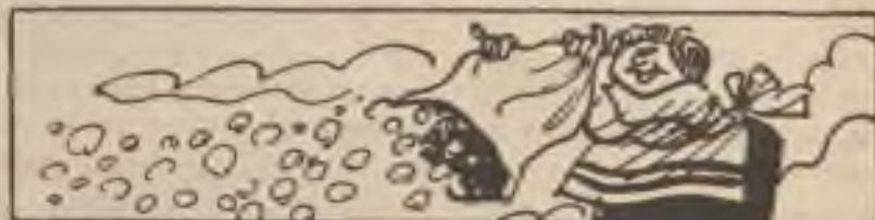
In ancient times, some Europeans believed snow was caused by an old woman shaking feather pillows in the sky.

Vláda by měla pomáhat "businessu," ne škodit mu. Není žádného důvodu, proč by se administrace a Kongres nemohli spojit a provádět politiku daňových incentív a opatření peněz pro výzkum a vývoj, aby se americký průmysl a obchod udržel na nohou.