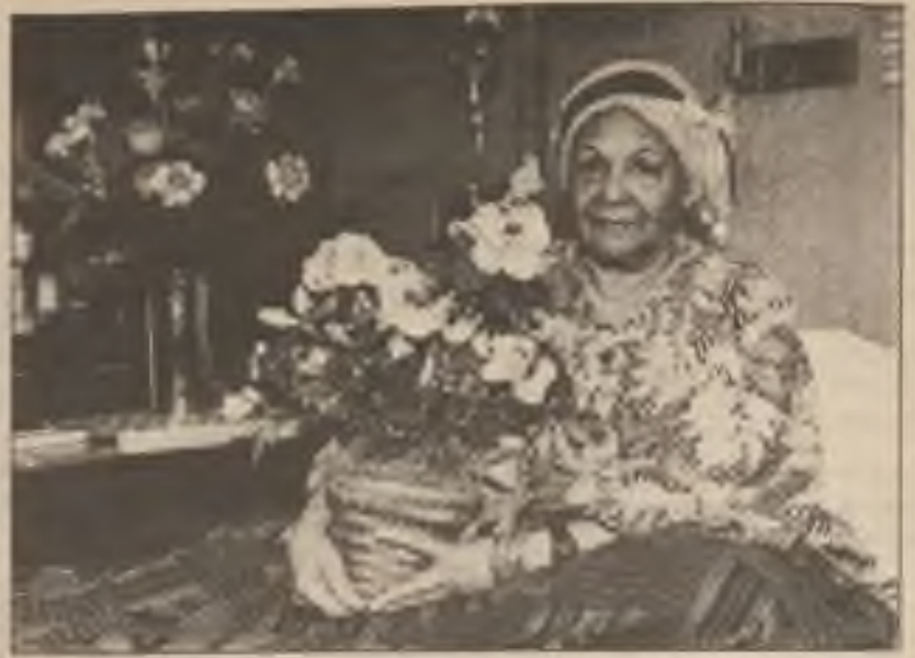
Katherine Dunham, která se postí od 1. února doufá, že její oběť upoutá pozornost na problémy v ochuzeném East St. Louis a mezi haitskými uprchlíky, vrácenými zpět Spojenými státy.

Pan Jakeš, který byl generálním sekretářem strany v posledních dvou letech komunistické vlády, se zdál souhlasit ve svém střeďechním svědectví s obrannými argumenty. Stojí s rukama sepjatýma před sebou, 69-letý Jakeš řekl soudcům, že Centrální výbor měl velké starosti s problémem,