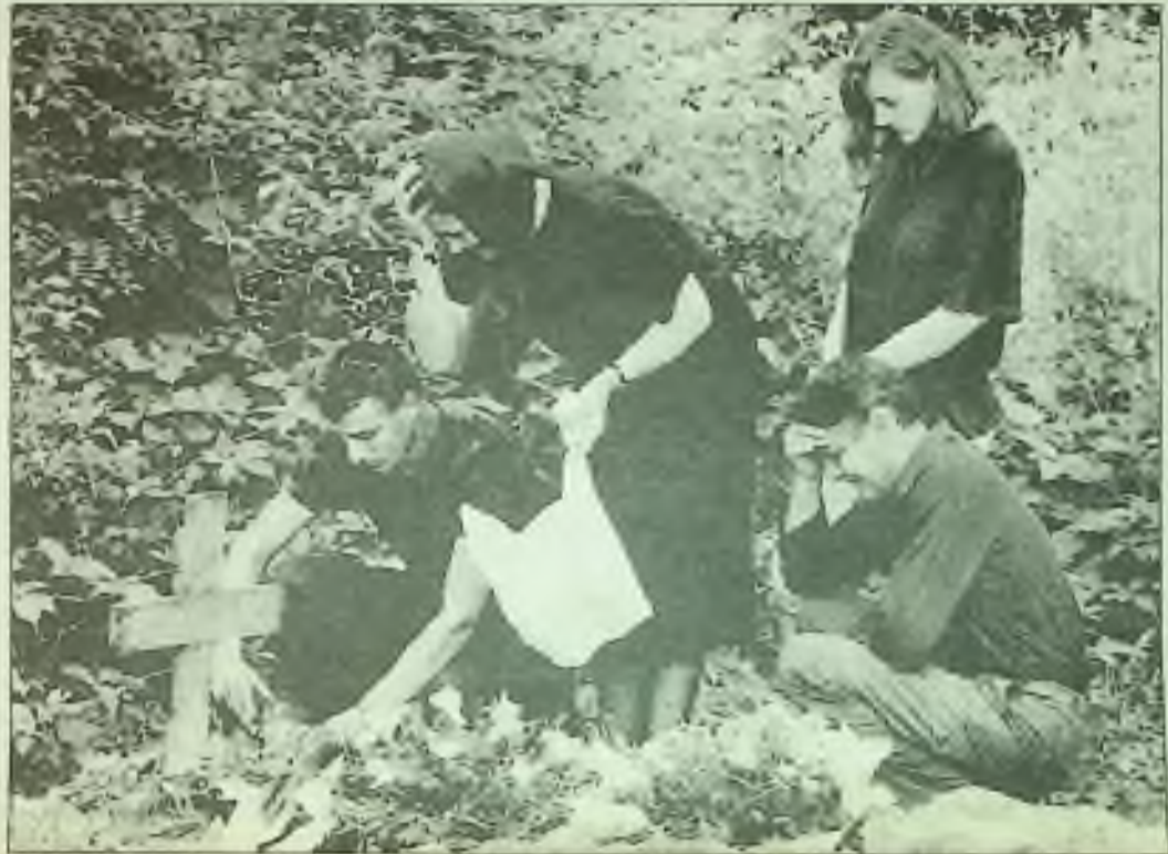
Rodina vojáka, zabitého v občanské válce v Bosně, truchlí u jeho hrobu blízko městečka Derventa naposled, než uprchne před blížícím se srbským vojskem.