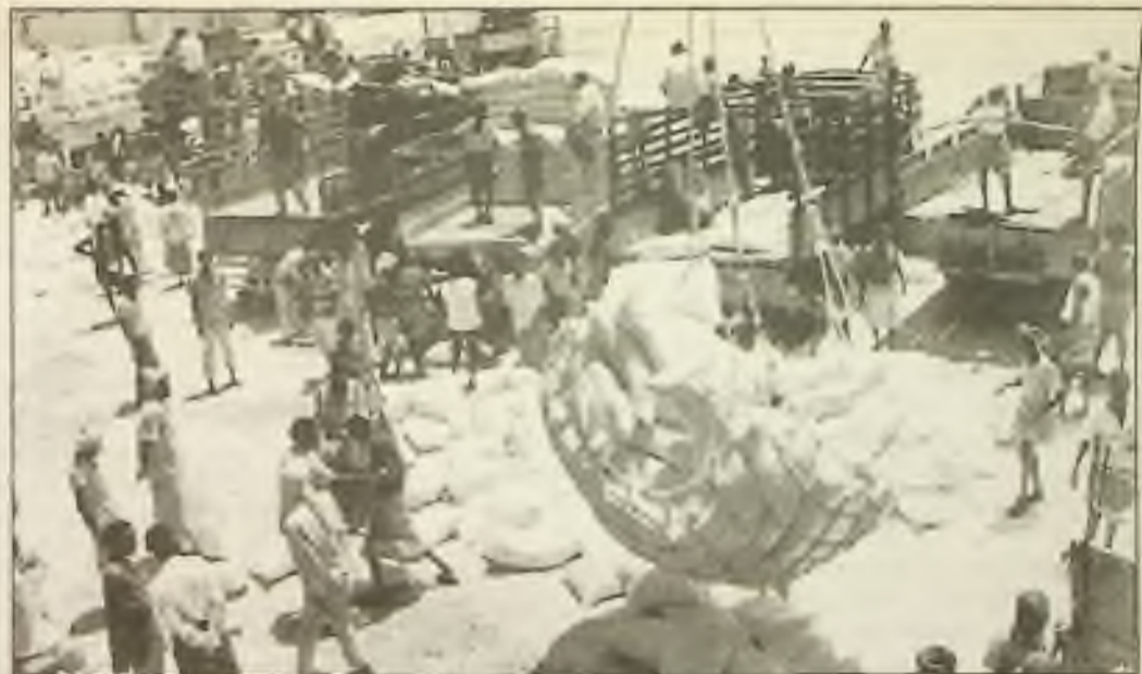
Zásilka potravin pro hladovějící lid Somálska se skládá v přístavu v Mogadishu. Odhaduje se, že až 1.5 milionu lidí by mohlo zemřít hladem.

letům vnitřního exilu za sbírání dokumentů o sovětské psychiatrii.