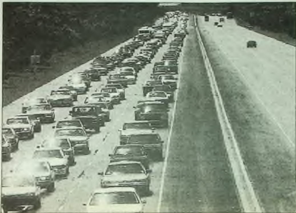
Auta naplnila proudy floridské Turnpike, směřující na sever, blízko Boca Raton v neděli, když residenty utíkali před hurikánem Andrew. Nejničivější hurikán postihl Floridu v r. 1935, kdy zahynulo 408 lidí.