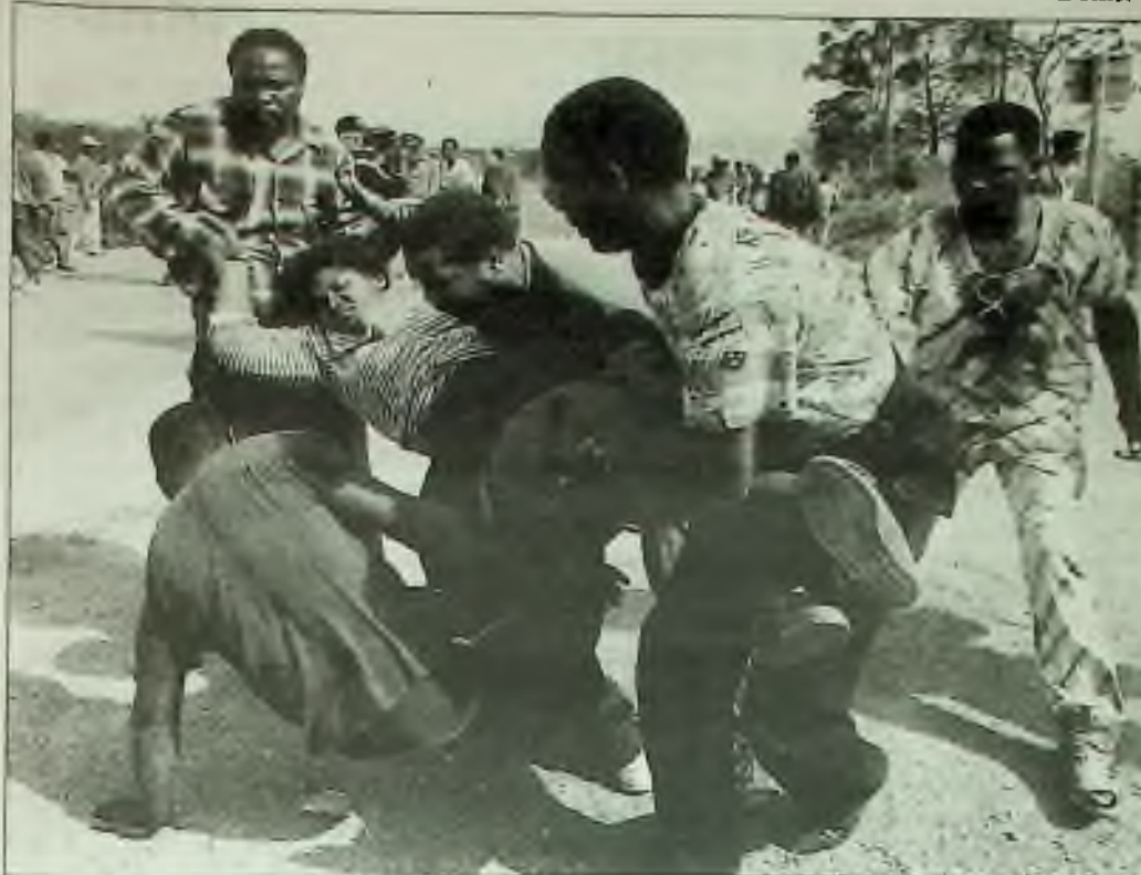
Pochodující odnášejí do bezpečí spoluúčastněnou ženu (v pondělí) v Bisho, v Jižní Africe. Africký národní kongres se vyjádřil, že nebude pokračovat v debatách s vládou Jižní Afriky, dokud nebude odstraněn vůdce, který střelení nařídil.