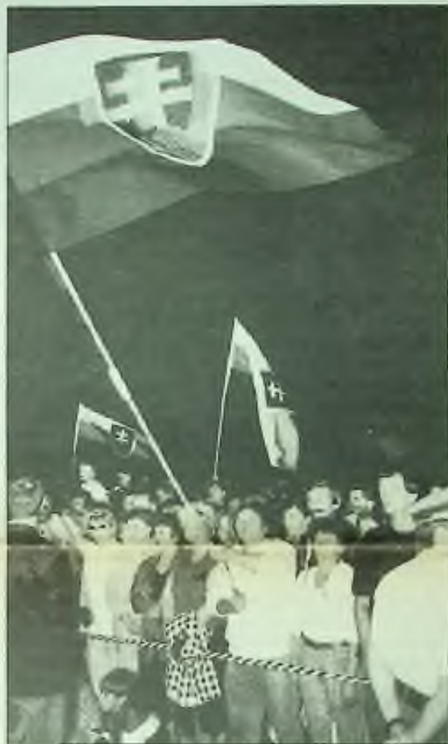
SLOVÁCI OSLAVUJÍ ÚSTAVU

Ten velmi citlivý registr názorů na hospodářský výhled — chování akciového trhu — směřoval rozhodně nahoru během léta. Od poloviny r. pokračování na str. 5