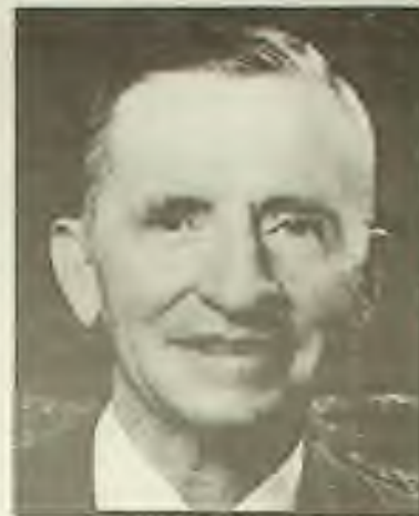
H. ROSS PEROT