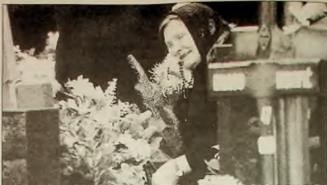
Chorvatská žena v Záhřebu pláče nad hrobem svého syna, zabitého v bojích mezi Chorvaty a Srby. Ti, kteří mrtvé přežili, oslavili v neděli Den všech svatých návštěvou hřbitova.

Společnost národů oznámila v neděli večer zastavení bojů mezi vládními vojsky a vzbouřenci v Angole, kde boje hrozily obnovením občanské války. V bojích zemřelo asi 200 osob v sobotu a v neděli v hlavním městě a jinde, jak oznámily nepotvrzené zprávy. Zdálo se, že příměří, které nabylo platnosti ve 12:01 v pondělí, bylo v ranních hodinách udržováno v Luandě, která byla jevištěm prudkých srážek po dva dny. Boje následovaly volby v září, v nichž UNITA byla vládnoucí stranou; hrozily zničit mírovou úmluvu z r. 1991 mezi stranami UNITA — Národní stranou pro úplnou nezávislost Angoly a vládnoucí stranou MPLA. Popular Movement for Liberation of Angola (Populární hnutí pro osvobození Angoly). Touto úmluvou byla zastavena občanská válka, která trvala 16 let.