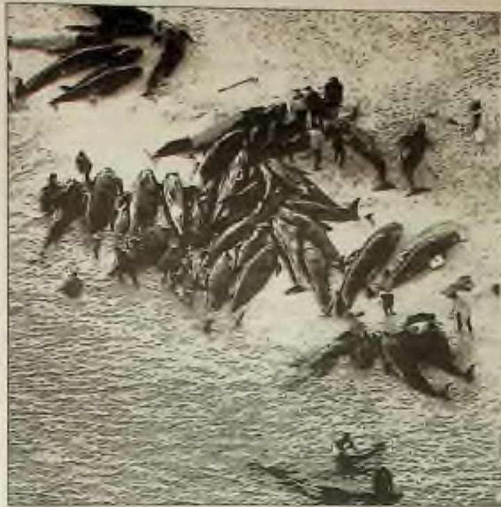
VELRYBY ZTROSKOTALY NA BŘEHU NOVÉHO ZÉLANDU Ve snaze zachránit tyto mohutné ryby, shání dobrovolníci dohromady asi sto velryb, které záhadně uvázly minulý úterý na pobřeží přístavu na severu Nového Zélandu, při cestě do Antarktidy.

6805 WEST CERMAK ROAD, BERWYN, ILLINOIS 60402 Telefon: 708-749-1333 — FAX 708-749-1350