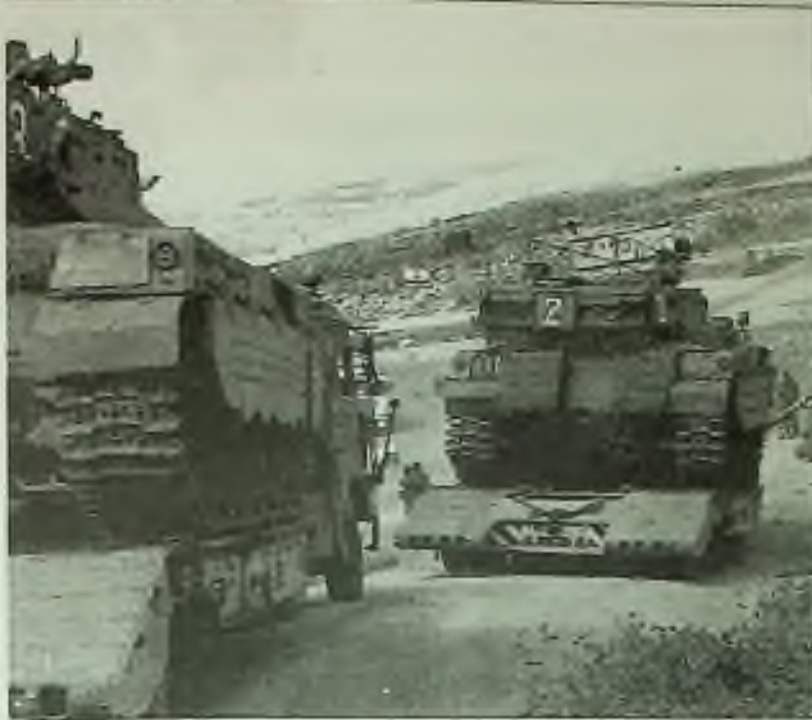
Nákladní vozidla táhnou izraelské tanky do nárazníkového pásma v jižním Libanonu. Izrael je tam začal hromadit, když bombardování muslimských partyzánů vyprovokovalo nové útoky. V srážkách zahynulo nejméně 13 osob.