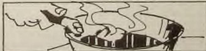
To keep food from sticking, add the oil or butter to a hot, not cold, pan.

A čím je vinen Václav Havel? Ihned poté, co se Rusové po sametové revoluci stáhli, čeští disidenti, kteří se nazývali Chartou 77, a slovenští disidenti, nazývaní Veřejností proti násilí, zanedbali potřebu se sjednotit a vytvořit tak politickou základnu pro sjednocené Československo. Zůstali oddělení a žádného z jejich vůdců, včetně Havla, zřejmě nenapadlo, že by to mohlo ohrozit novou demokracii. Jako prezident Havel trval na tom, že se nestane vůdcem žádné politické strany a že zůstane nad nimi. Koncem roku 1991 už cítil, že Československo směřuje k rozštěpení. Veden obavou, předložil FS pět prezidentských dodatků k ústavě z nichž jeden mu měl umožnit vyhlásit referendum. Předpokládal, že většina obou národů bude volit proti rozpuštění federace. Jenže Havel nedokázal své návrhy dostatečně prosadit přesvědčováním poslanců, a tak byly odmítnuty. Bud' se naivně spoléhal na svůj vlastní vliv, anebo postrádal politický důvtip či průbojnost. A navíc, jeho tah se nehodil do Klausovy hry, která byla proti referendu. Nicméně šikovný Klaus zůstává s Havlem ve styku, protože si ho přeje mít prvním prezidentem nově České republiky. Jak řekl jeden vysoký činitele — Havel je stále ještě respektován jako mravně integritní člověk. A jako takového ho Klaus potřebuje více, než Havel potřebuje prezidentství.