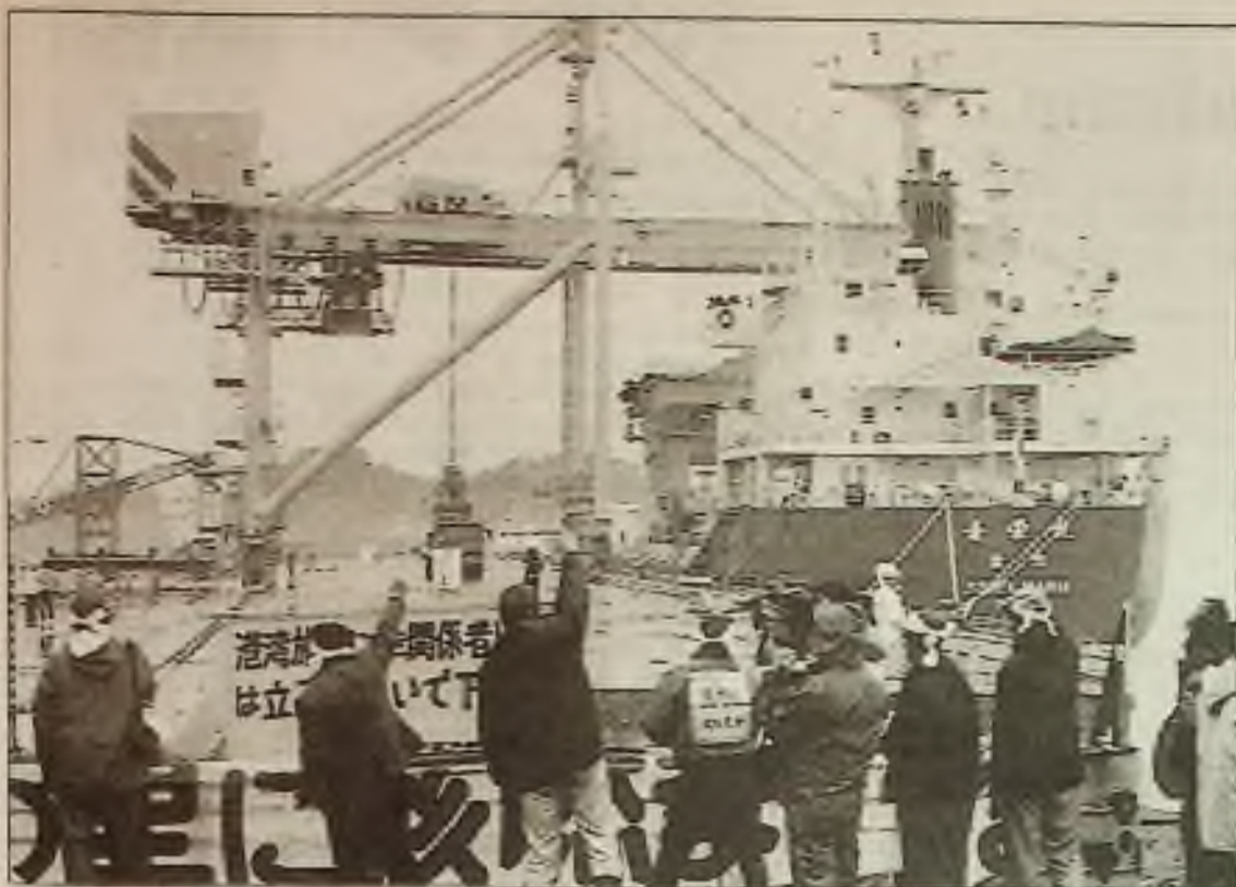
Japonci protestují zvednutými pěstmi (v pondělí), když se z nákladní lodi v přístavu blízko Aomori v severním Japonsku skládaly sudy radioaktivního odpadu. Odpad z japonských elektráren má být pohřben v prvním skladišti, zbudovaném pro barely nashromážděné za 60 let.