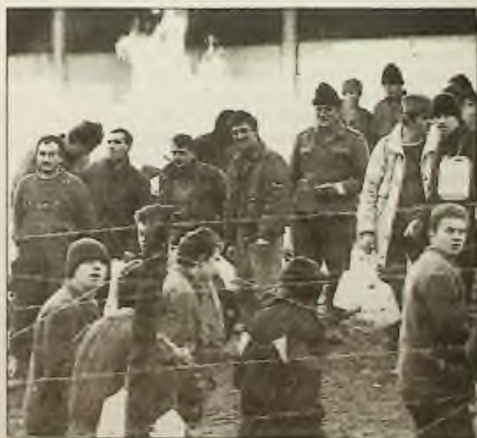
Ostnatý drát zdržuje Bosňany v srbském táboře Manjaca v Severní Bosně. 1.000 jich mělo být předáno v pondělí Červenému kříži v Chorvatsku. Tábor má být tento týden zavřen.