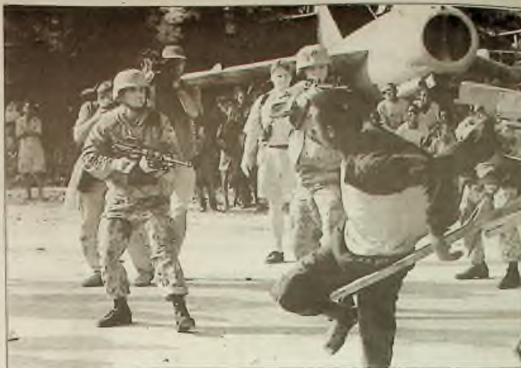
Námořník mlčí svou zbraň na Somálce, který odmítl nařizení zastavit se venku před mogadišským letišťem ve středu. V následujících dnech budou námořníci usilovat o zajištění kontroly nad rozsáhlou oblastí města

Dělníci dali do provozu druhý nukleární reaktor v Černobyli minulou neděli. Kalkulovali, že potřeba energie na Ukrajině vyváží nebezpečí na místě nejhoršího nukleárního neštěstí na světě. Nukleární elektrárna v Černobyli byla předmětem kontroverze mezi energetickými autoritami Ukrajiny, které chtějí udržovat elektrárnu v provozu a skupinami ochránců životního prostředí a západními vládami, které tvrdí, že podnik je nebezpečný a musí být zavřen. Explose reaktoru č. 4 v roce 1986 otfášla celým světem, a upozornila na nebezpečnou konstrukci sovětských reaktorů RBMK. Nejméně 32 osob zemřelo a desetitisíce lidí muselo opustit svůj domov v kontaminované oblasti.