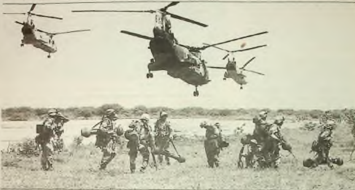
Námořníci v neděli zajistili Sověty vybudované přistávací pole v Beli Dogle v Somálsku. Pole je na cestě do obleženého města Baidoa.