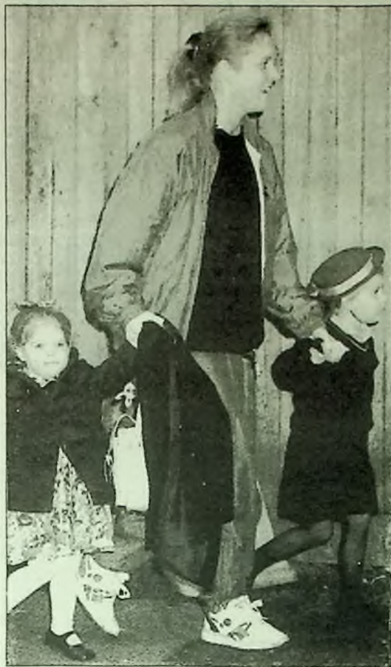
Vévodkyně z Yorku přijíždí ve středu na školní divadelní hru ve Upton House School ve Windso-ru se svými dětmi, princeznou Beatricí (nalevo) a princeznou Eugeníí.

Nechť každý od pluhu, stroje či péra, každý podle svých schopností se ujme této naléhavé práce. Daleko platnější než odbornost je pro dnešek morální bezúhonnost!