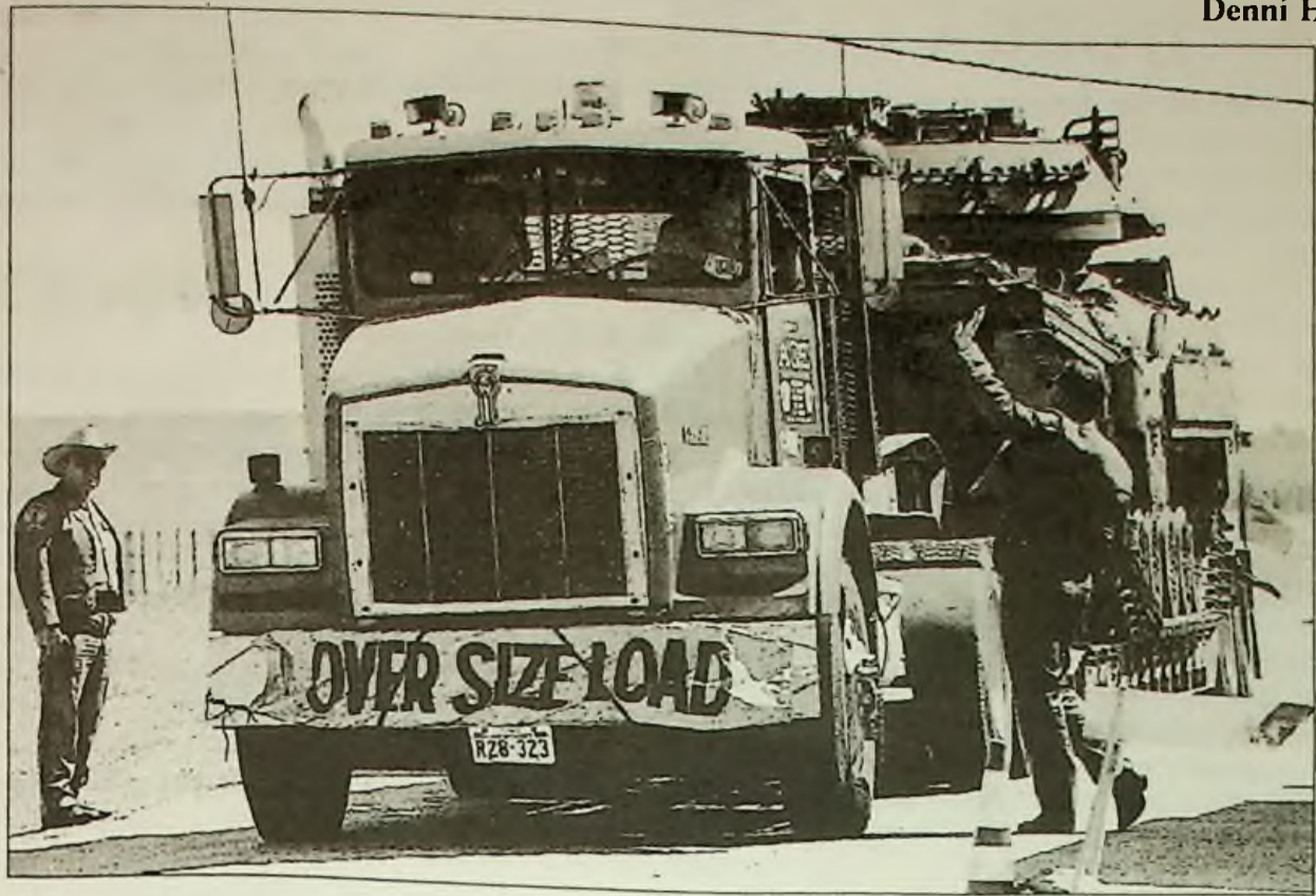
Ve středu byl přivezen tento obrněný vůz ke zdi, opevňující budovy Davidiánské sekty blízko Waco, Texas. Bylo ho použito ke vstříkovaní slzného plynu dírami, vyvrtanými ve zdi a k ochraně agentů FBI.

President Itamar Franco předložil koncem minulého týdne svůj dlouho očekávaný plán, jak vyvést Brazílii z hospodářské krize. Hlavní body plánu nastínil ve svém projevu ministr financí Eliseu Resende: osekání rozpočtu ve velkém