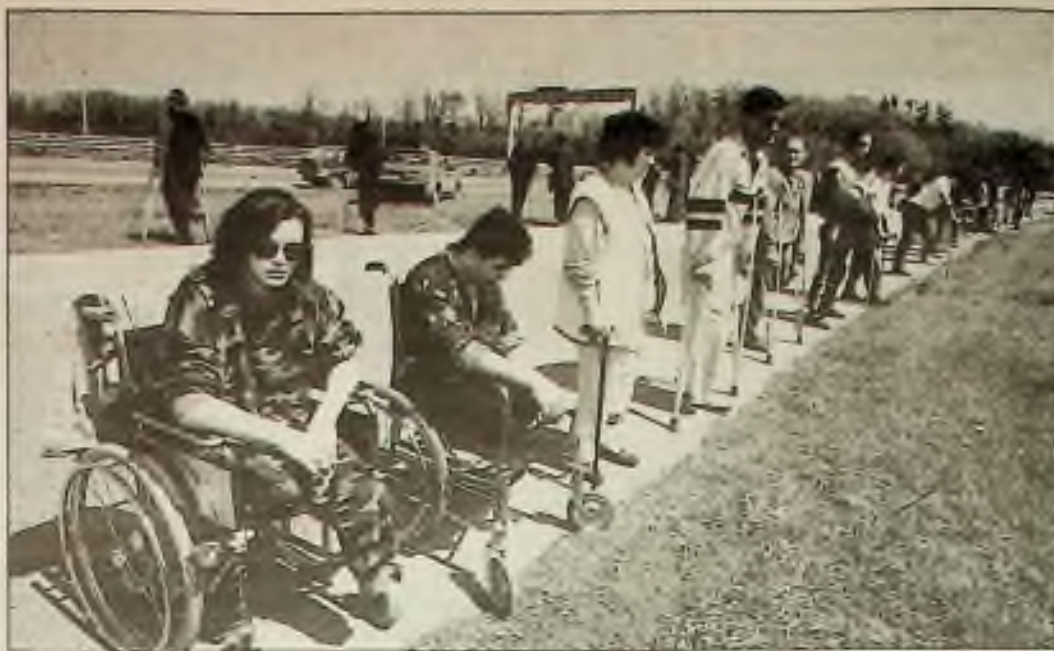
Srbské oběti války protestují proti přjezdu vyslance UN Lorda Owena do Bělehradu v Jugoslávii minulou středu. Zmrzačení se postavili podél cesty z letiště a obrátili se zády k jeho autu.

Vyšetřovatelé výbuchu bomby, která silně zničila podpůrnou konstrukci Centra světového obchodu (World Trade Center) přicházejí nyní na to, že tento teroristický čin je zřejmě vlastně pouze částí široce rozvětveného spiknutí, jež je financováno velkými sumami z ciziny. Prozatím se ale neví, kdo peníze odesílal a proč. Jde prozatím též o částku ve výši 100.000 dolarů. Malá částka ve výši 2.400 dolarů byla zaslána příbuzným jednoho ze zadržovaných podezřelých z Německa. Další informace přicházejí také z Izraele a z Egypta. Příslušní činitelé pověření vyšetřováním případu nyní tvrdí, že mají v rukách pevnější důkazy proti šesti podezřelým, z nichž Ramzi Ahmed Yousef je stále ještě hledán. Ibrahim Elgabrowni byl zatím obviněn jen z vlastnění padělaných dokumentů a z bránění výkonu spravedlnosti. Jednotlivě zaslané částky z ciziny byly poslány mimo Německo také z Iránu a z další země Středního východu.