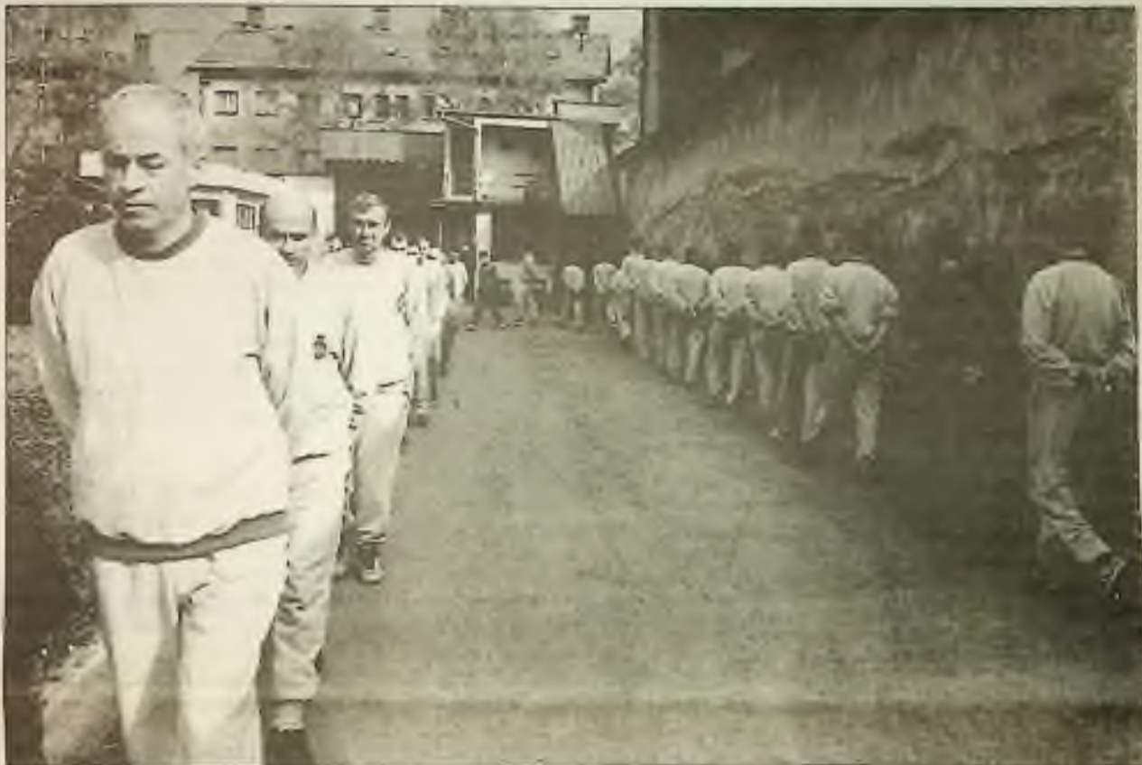
Srbští váleční vězňové pochodují na dvoře v Tuzla, kontrolováni bosenskými vojáky.

Na schůzce zahraničních ministrů zemí Evropského společenství minulou sobotu nedošlo k dohodě o zahájení leteckých útoků proti srbským vojenským cílům v Bosně. Britský ministr zahraničí Douglas Hurd uvedl, že Francie a Anglie budou diskutovat o dalších tazích vůči Srbsku tento týden s Clintonovou vládní správou. President Clinton prohlásil již dříve, že uvažuje o různých možnostech vojenského zásahu, včetně náletů na srbské pozice v Bosně. Organizace Severoatlantického paktu je již dávno na vojenský zásah připravena. Na tomto zasedání britský ministr sdělil, že Anglie použije letecké síly na ochranu 150 kanadských vojáků sloužících v Bosně jako část mírové armády Spojených národů, kdyby byli napadeni Srby. Mluvčí britského ministerstva zahraničí tuto zprávu potvrdil. Další britský činitel, který nechtěl být jmenován, řekl, že použití letadel k záchraně kanadských vojáků si nevyžaduje schválení Spojených národů.