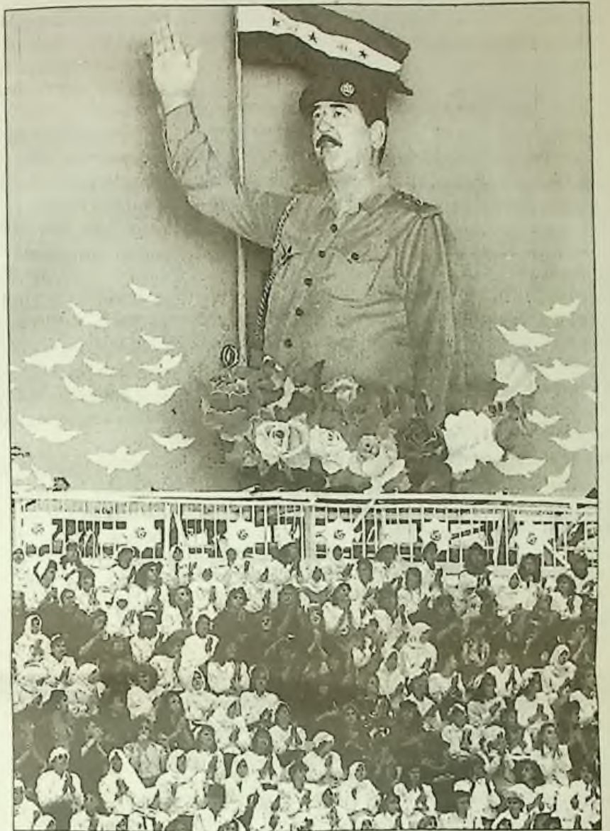
Iracké ženy se shromáždily pod plakátem presidenta Saddama Husseina ve středu, aby se dívaly na průvod v Tirkiti, který proběhl ve znamení jeho 56. narozenin.