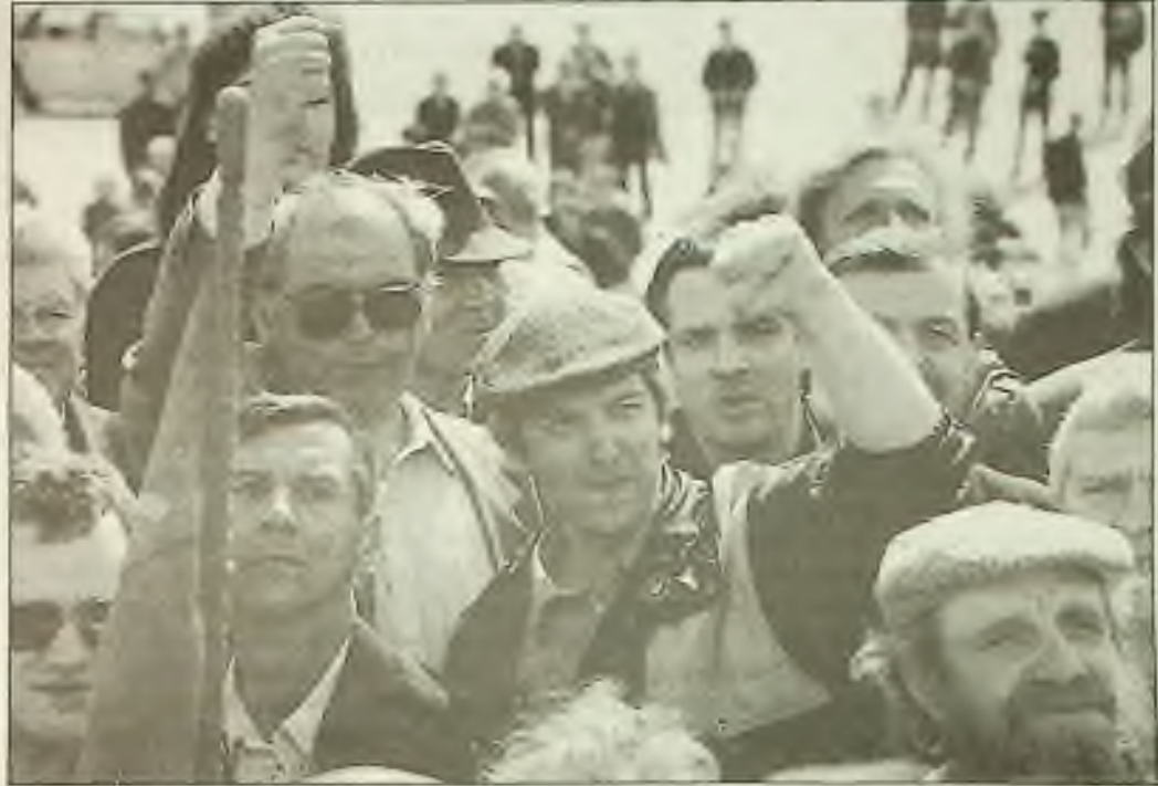
Prokomunističtí demonstranti se shromáždili před budovou parlamentu v Moskvě v neděli, nazývali přítomného prezidenta Jelcina "fezčíkem". 70 demonstrantů a 205 policistů bylo zraněno.