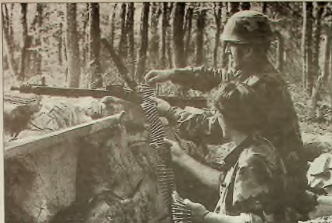
Oddíly bosenských Srbů ve středu nabíjely automatické zbraň v horách Grabez nad městem Bihać v Bosně-Hercegovině. Srbové zahájili ofenzivu proti městu, které je 140 mil severozápadně od Sarajeva.

Udělejte vašim doma radost v tomto roce a předplaťte jim Hlasatel.