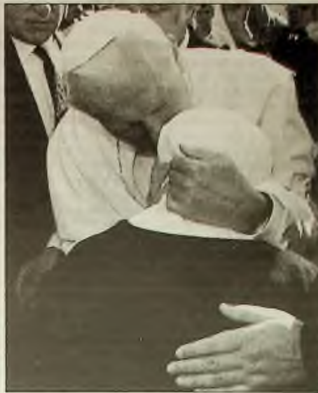
PAPEŽ NAVŠTÍVIL ALBÁNII

Turecký prezident Turgut Ozal zemřel na následky selhání srdeční činnosti po návratu ze střední Asie. Jeho náhlá smrt vyvolala obavy, že by v důsledku mocenského vakua mohlo dojít v Turecku k vnitropolitické krizi. Některé noviny si kladou otázku, zdali příští prezident bude tak "otevřený" a "bystrý" ve věci ekonomické výstavby země jako Turgut Ozal. Jiné noviny soudí, že mluvčí parlamentu Hasmettin Cindoruk, jenž se stal po