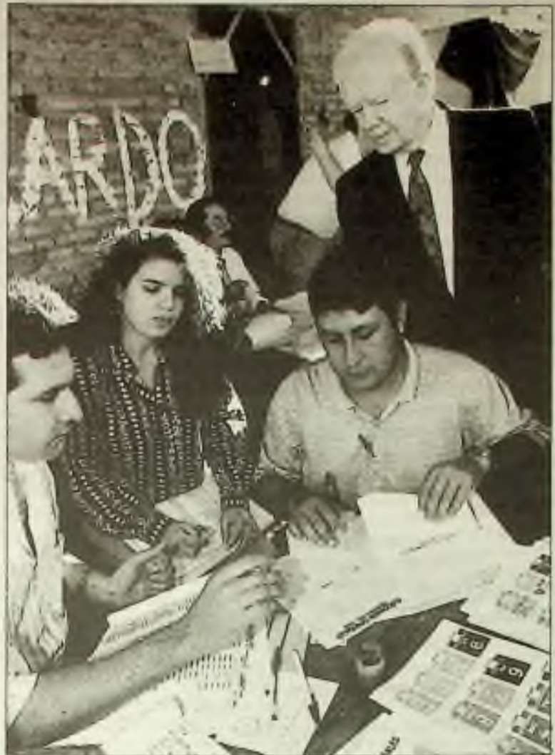
Bývalý americký prezident Jimmy Carter provádí inspekci volební místnosti v Asuncionu ve státě Paraguay. Později zkoumal přerušení telefonické služby, jež zdrželo výsledky voleb.

I když se v době železniční a hornické stávky očekával celonárodní dopravní chaos, vůbec k němu nedošlo. Mnoho pracovníků skutečně raději nešlo do zaměstnání. Prodloužili si tak za příjemného jarního počasí víkend. Londýn nebyl ochromen také proto, že jsou především v důsledku opakovaných teroristických útoků Irské republikánské armády na systém londýnské veřejné dopravy Londýňané na dopravní výpadky už zvyklí a dovedou se zařadit v krizové situaci podle svého. Mnozí zaměstnanci po celé zemi pracovali doma: v důsledku zrychlujícího se technologického pokroku začíná být stále větší množství domácností vybaveno počítači a faxy, nemluvě o telefonech. V současnosti pracuje pravidelně více než milion Britů z domova, další jeden a půl milionu britských zaměstnanců pracuje doma pomocí faxu a telefonů několik dní v týdnu. V pátek v době železniční stávky využilo elektronického komunikačního zařízení k práci z domova podstatně větší množství britských občanů než obvykle. V britských městech panovala uvolněná, téměř nedělní atmosféra, avšak chod národního hospodářství se nezastavil.