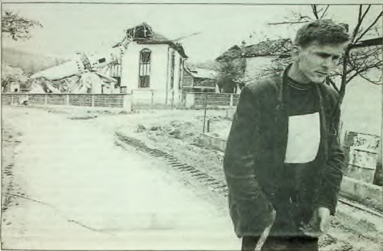
Duševně chorý Chorvat bloudí v ulicích opuštěné vesnice Ahmioi v Bosně-Hercegovině. Před dvěma týdny byli muslimové ve vesnici údajně masakrováni chorvatskými vojáky. Tento muž zůstal ve vesnici, když jeho rodina uprchla.

"Většina našich zákazníků jsou lidé z vrchní střední třídy," řekl majitel kurýrové služby v Haagu. "Jsou to lidé," dodal, "kteří nemají nic raději než relaxovat po práci