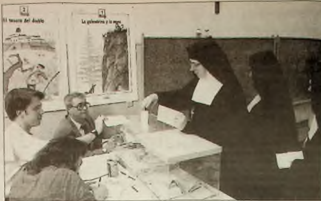
Jeptišky se seřadily k nedělním volbám v Madridu. Ačkoliv korupci postižená socialistická strana šla do voleb, v značných nesnázích, dařilo se jí lépe než se očekávalo.

Ruský ministr obrany Pavel Gračev vyjádřil postoj Kremlu minulý víkend americké delegaci, kterou vedl ministr obrany Les Aspin, že totiž Rusové nechtějí, aby vláda U.S. zůstala neutrální v jejich sporu s Ukra-