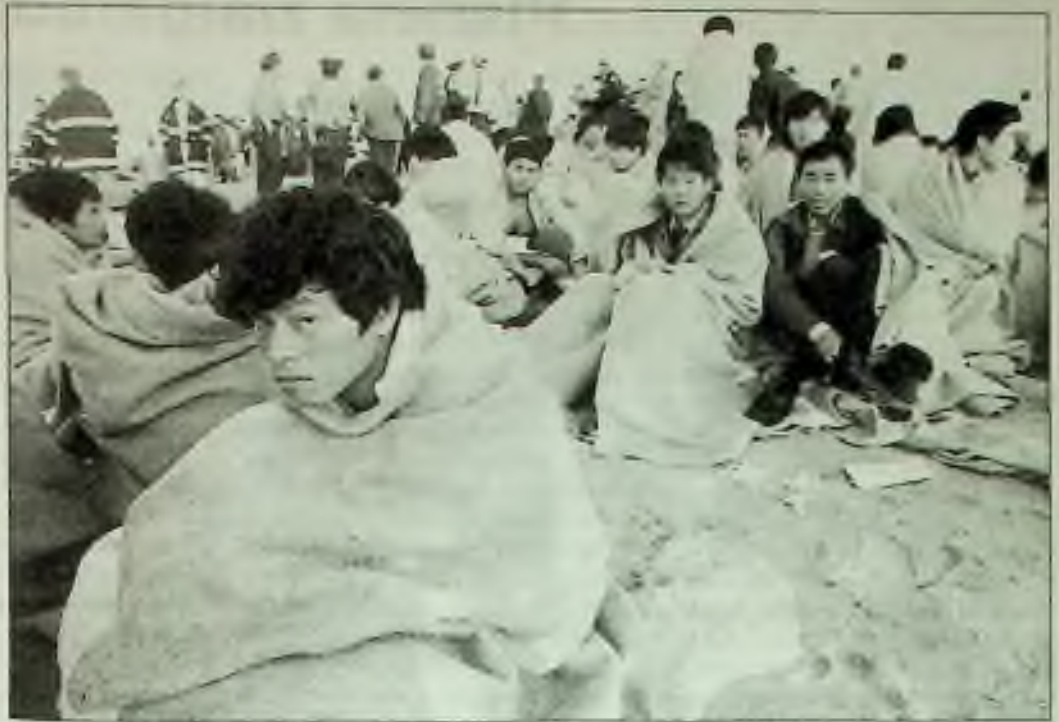
Ilegální imigranti se v neděli choulili na pláži Rockaway Beach v New York City. Přes 200 jich skočilo do moře, když loď uvázla na mělčině, a mnoho jich muselo být vytaženo z vody a ošetřeno.