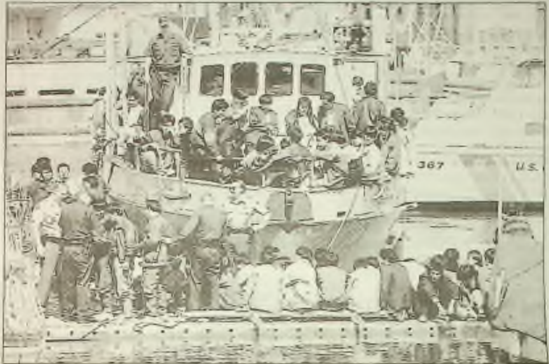
Záchranný člun je šlehan vysokým příbojem u nákladní lodi, která přepašovala imigranty z Číny. Jeden lehký člun - skiff - pobřežní hlídky se v rychlém proudu převrhl.

"Vypadalo to skoro jako invaze Normandie", řekl policejní detektiv Ming Li, který se dostavil krátce po tom co 150-tistopová nákladní loď Golden Venture narazila na břeh ve dvě hodiny po půlnoci v Queens, po třech měsících na moři. Někteří plavali a brodili se na břeh, nesli si plastické pytle se svými věcmi. Mnoho jich muselo být vytaženo z vody asi 53 stupňů "teplé".