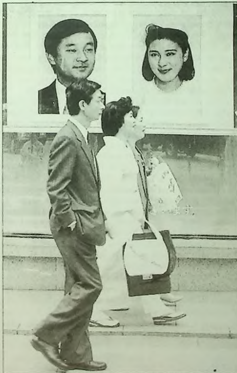
Lidé přecházejí kolem portrétů japonského korunního prince Naruhito a jeho snoubenky Masako Owada, které zdobí výkladní skříň luxusního obchodu v Tokiu. Ve středu byla dvojice oddána.

But history will judge him for his doggedness in pursuing the causes that can change our future for the better. And my instinct is that the first few months indicate that he will receive favorable marks on these.