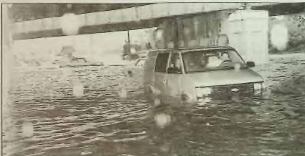
Motorista sedí ve svém autě na 96. ulici a Stony Island Avenue na jižní straně Chicaga. Jiná opuštěná auta plovou kolem. V pondělí spadlo víc než 3 inče deště během dvou hodin.