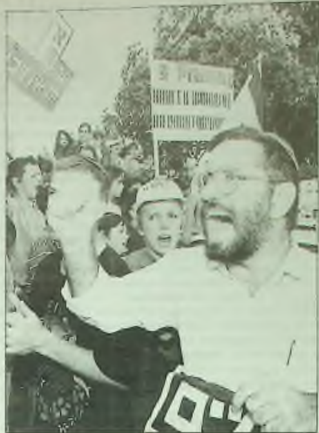
Israelci v neděli demonstrovali v Jeruzalémě proti vrácení okupovaných území jako části vyrovnání s arabskými zeměmi. Nová řada mírových jednání měla začít ve Washingtonu v úterý.

každou středu a pátek v 8.05 večer řídí Jerry Jirák