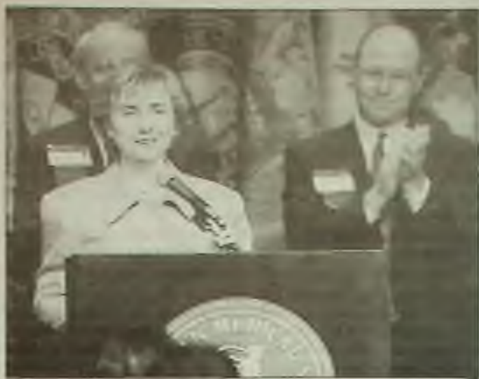
První dáma Hillary Rodham Clintonová hleděla spojit reformu zdravotní péče s rodinnými hodnotami ve svém nedělním proslovu k AMA v Chicagu.