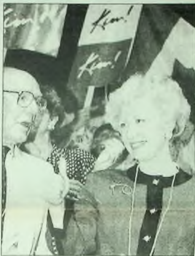
Kim Campbell se dostavila na konvenci Progresivní konservativní strany v Otavě (Ottawa), kde byla zvolena ze budoucí ministerskou předsedkyní.