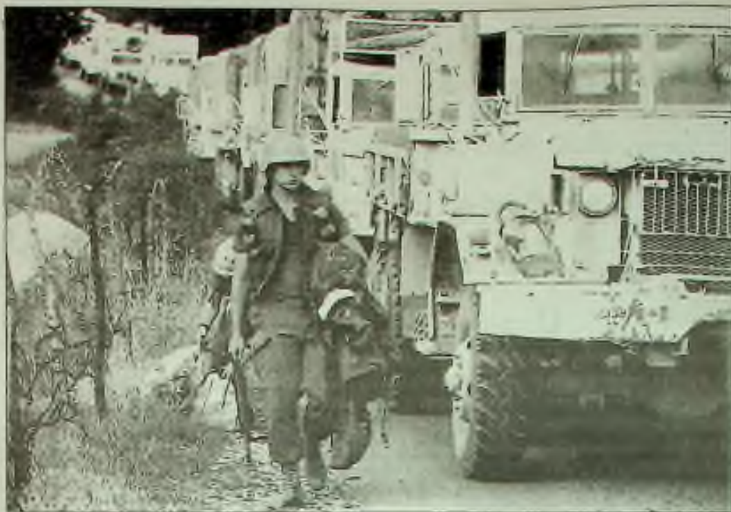
Kanadský konvoj UN opouští v neděli tábor blízko Mostaru v Bosně, aby unikl těžké střelbě v muslimy ovládané oblastí. Jak srbské tak chorvatští vojáci se zúčastňují útoku.

že je schopen svou zem vést. Někteří myslí, že jeho "smrt" by měla přijít mnohem dříve.