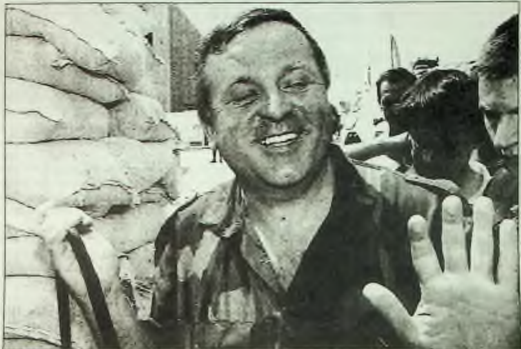
Generál Rasim Delić, vůdce bosenské armády přijel v neděli na sarajevské letiště, aby se setkal se svým srbským protějškem. Měli spolu hovořit o Srby slíbeném odtažení z důležitých hor nad Sarajevem.

Koalice sedmi stran, která má malou většinu 259 křesel v nižším domě parlamentu o 511 křeslech zvolila Hosokawu za ministerského předsedu minulý pátek. Tři ženy získaly kabinetní místa — o jednu víc než jmenoval dřívější min. předseda Toshiki Kaifu v r. 1989.