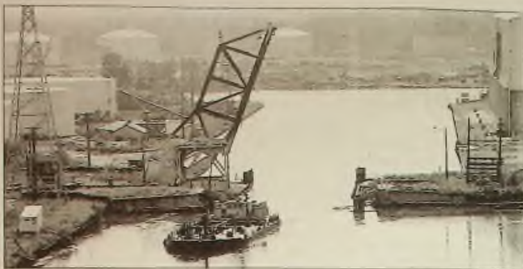
Přístav Indiana Harbor, silně průmyslové ústí Grand Calumet River v East Chicago, má "usazeninu z pekla", jak to nazval jeden úředník, ale k jeho vyčištění dojde teprve za několik let.