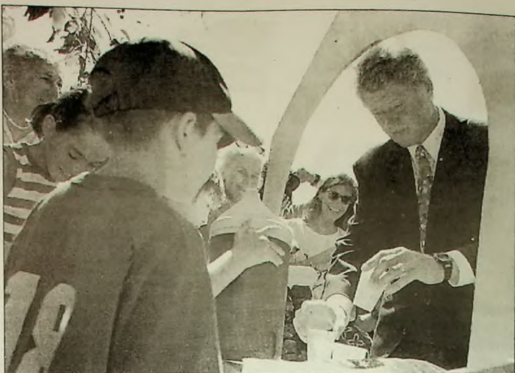
President Clinton se v neděli zastavil u stánku s limonádou v Martha's Vineyard, Mass., poslední den své letní dovolené. Má skromný program na první týden ve Washingtonu, ale dále se rýsují velké problémy, včetně úmluvy NAFTA.

V Evropě kolují zprávy, že Srbové postavili protitankové bariéry podél hranice s Maďarskem blízko Barendumu a Udvaru. Také se říká, že položili miny podél hranic i jinde. Maďarsko se na to dívá nepřátelsky; hledalo totiž výmluvu pro připojení jugoslávského, nyní srbského území, obývaného z větší části etnickými Maďary. Maďarsko obviňuje Srbsko z toho, že se snaží ukázat, že je v nebezpečí útoku ze strany Maďarů — a opravdu možná je. (Zprávy tisku).