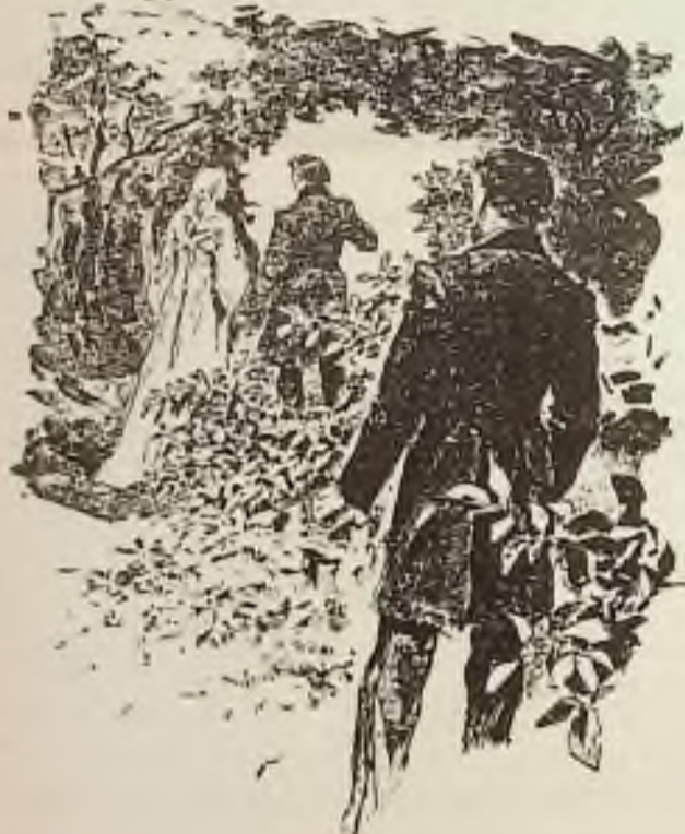
Sledoval každé jeho i její hnutí.

Dlouho bloudil Vladimír po zahradě, než do pokoje se vrátil s toužou otázkou na rtech.