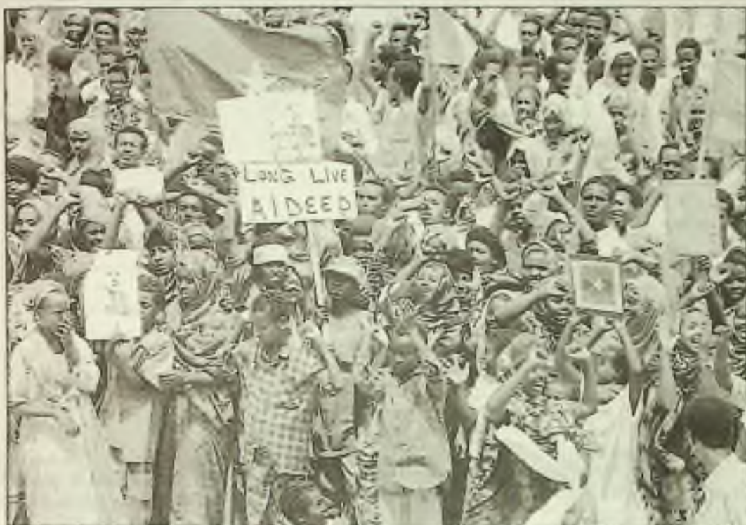
Zastánci somálského válečného lorda Mohameda Farrah Aidida se v neděli shromáždili na stadionu v Mogadishu. Protestovali proti politice UN a proti příchodu U.S. Army Rangers.

Baker, Sununu a Bushovi synové byli mimo dosah, aby komentovali.