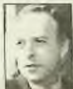
Andre Kozyrev Russian foreign minister