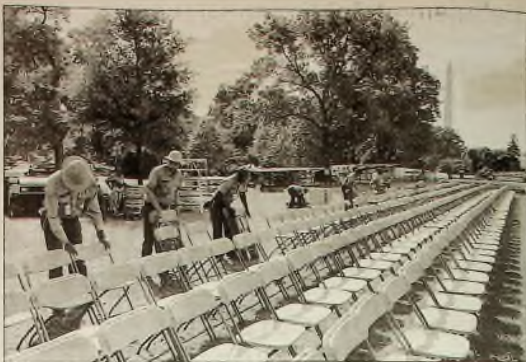
Na jižním trávníku Bílého domu se připravovaly židle pro víc než 2,500 hostů, kteří měli být svědky podepsání paktu o míru mezi Israelem a Organizací pro osvobození Palestiny.

Násilnosti hrozí znovu rozpoutat šestiměsíční válku, kterou Chorvatsko bojovalo se svou srbskou menšinou v r. 1991, když se odtrhlo od Srby ovládané Jugoslávie. Organizace UN, která má v Chorvatsku asi 14,000 udržovatelů míru vyjádřila obavy, že boje by mohly ohrozit mírové debaty mezi válčícími Srby, Chorvaty a muslimy v sousedící Bosně-Hercegovině.