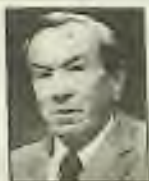
Warren Christopher U.S. secretary of state