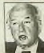
Yitzhak Rabin prime minister of Israel