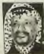
Yasser Arafat PLO chairman