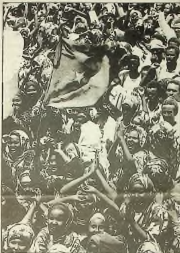
Somálcí se v neděli shromáždili pod národní vlajkou v Mogadishu. Popěvky proti UN byly roztroušeny mezi převážně klidným davem.