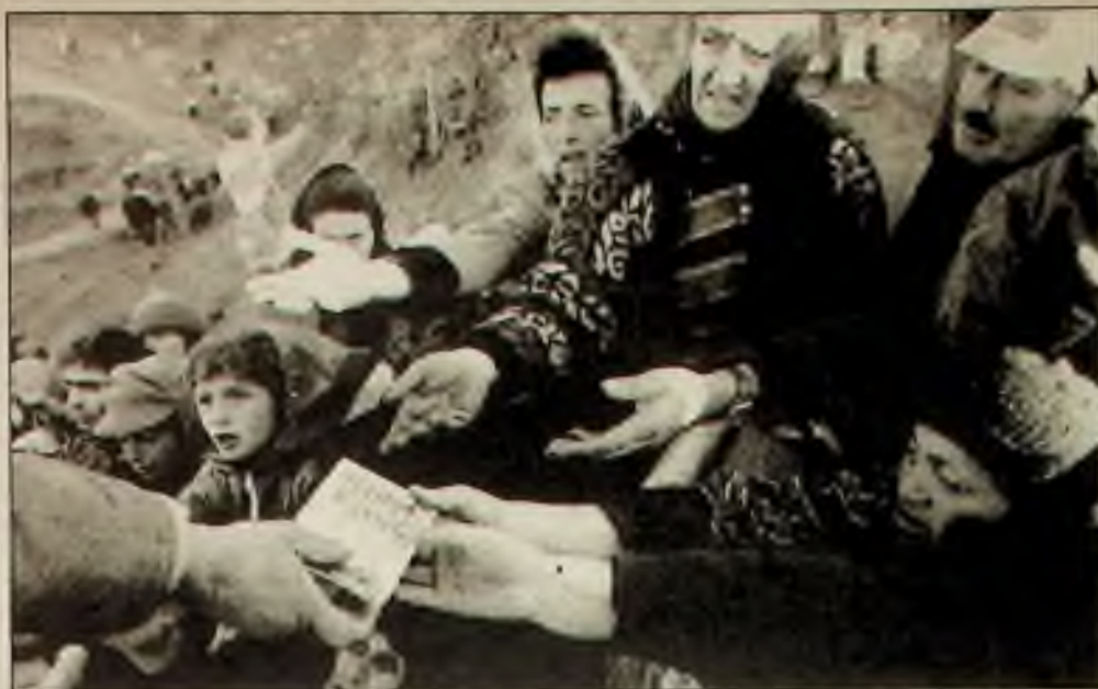
Gruzijnští uprchlíci z Abcházie se snaží dosáhnout krabice s dietním práškem od sociální pracovnice v Tchuberi. Tento prášek a chléb je vše, co dostanou k jídlu.

Je oslabována pozice církve, král se snažil politicky využívat rozkollisané situace. K zuřivosti dohnala krále volba a potvrzení nového opata kladrubského. Tam chtěl král vytvořit nové západočeské biskupství, jako protíváhu pražského. Žádnou změnu nepřinesla ani