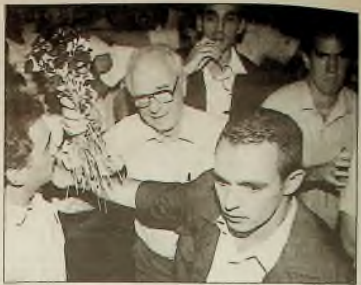
Strážcové dělali v neděli cestu pro ministerského předsedu Jicaka Rabina po tom, co mu pravičáci zabránili mluvit ke shromážděným v Jerusalemě.