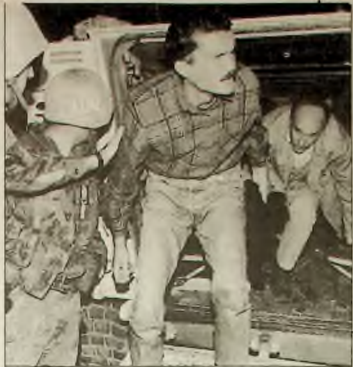
Vojáci Organizace spojených národů pomohli v úterý osvobozeným chorvatským vězňům v Mostaru, Bosna, po tom kdy došlo k výměně chorvatsko-muslimských vězňů. Další výměna 140 vězňů byla zrušena ve středu.

Závěrem konference předložil rakouský kancléř Vranitzky prohlášení, ve kterém evropští politici ujistili presidenta Jelcina podporou jeho reformních snah o demokratizaci. Prohlášení bylo jednohlasně přijato.