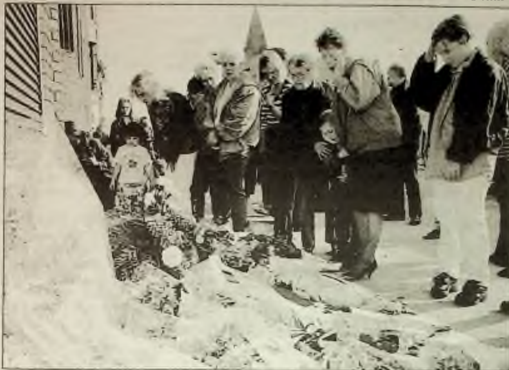
Truchlíci se shromáždili kolem místa smrtícího bombardování v Belfastu. IRA oznámila, že vůdcové Protestantského obranného sdružení byli terčem sobotního výbuchu.

práv. Byl také zakládajícím členem politické strany v Rusku, která Demokratické unie v r. 1988, první volala po zrušení komunismu.