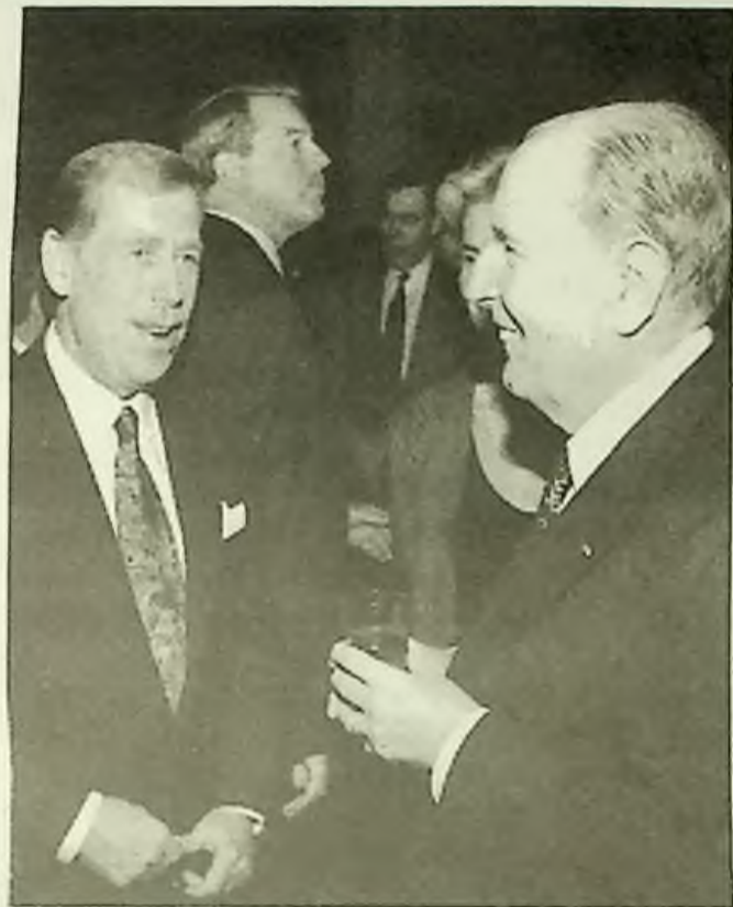
Havel - Vranitzky - Mitterrand

Studijní programy, které byly dříve zodpovědností jugoslávské vlády, musejí teď vzít na sebe Rusíni sami. Mezi potřebami jsou (1) moderní kompjutry na tištění školních učebnic a novin; (2) přístroje FAX pro komunikaci mezi Rusíny ve Vojvodině (část Srbska) a v Chorvatsku; (3) stipendia pro universitní studenty; a (4) cestovní podpora pro učitele ze Spojených států nebo z Kanady, který by učil angličtinu v Ruském Keresturu.