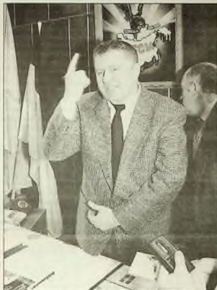
Žirinovskij mluvil s reportéry v Moskvě minulý čtvrtek po odmítnutí jeho vstupu do Bulharska a odmítnutí německého visa.