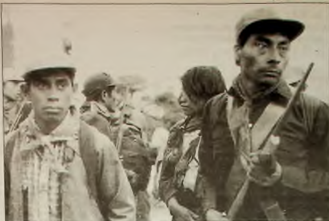
Členové Zapatista National Liberation Army patrolovali v sobotu ulice v San Christobal po dobytí města a několika jiných měst v mexickém státě Chiapas. Odešli ze San Christobalu v neděli ráno.