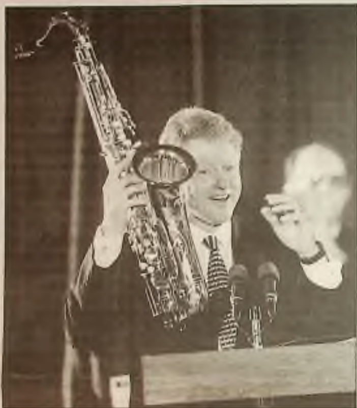
President Clinton jako dobře známý saxofonový hráč drží saxofon, darovaný starostou Dinantu v Belgii, Dinant byl domovem vynálezce rohu, Adolfa Saxe, který zemřel v roce 1884.