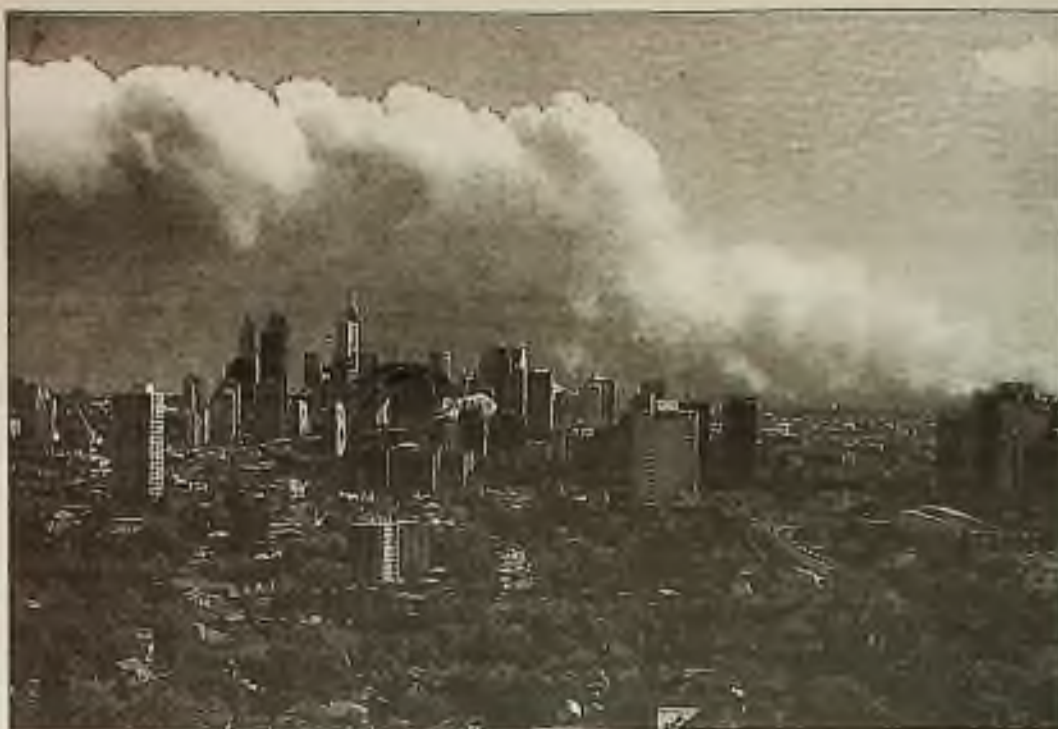
Kotlí se vznášeli nad městem Sydney zatímco požár v buši pokračuje okolo australské metropole. Nejméně 150 domů a dalších budov bylo zničeno během ohně trvajících týden.

Woman's Auxiliary, Mac Neal Hospital Mabel Wilen Scholarship 3249 South Oak Park Avenue Berwyn, IL. 60402