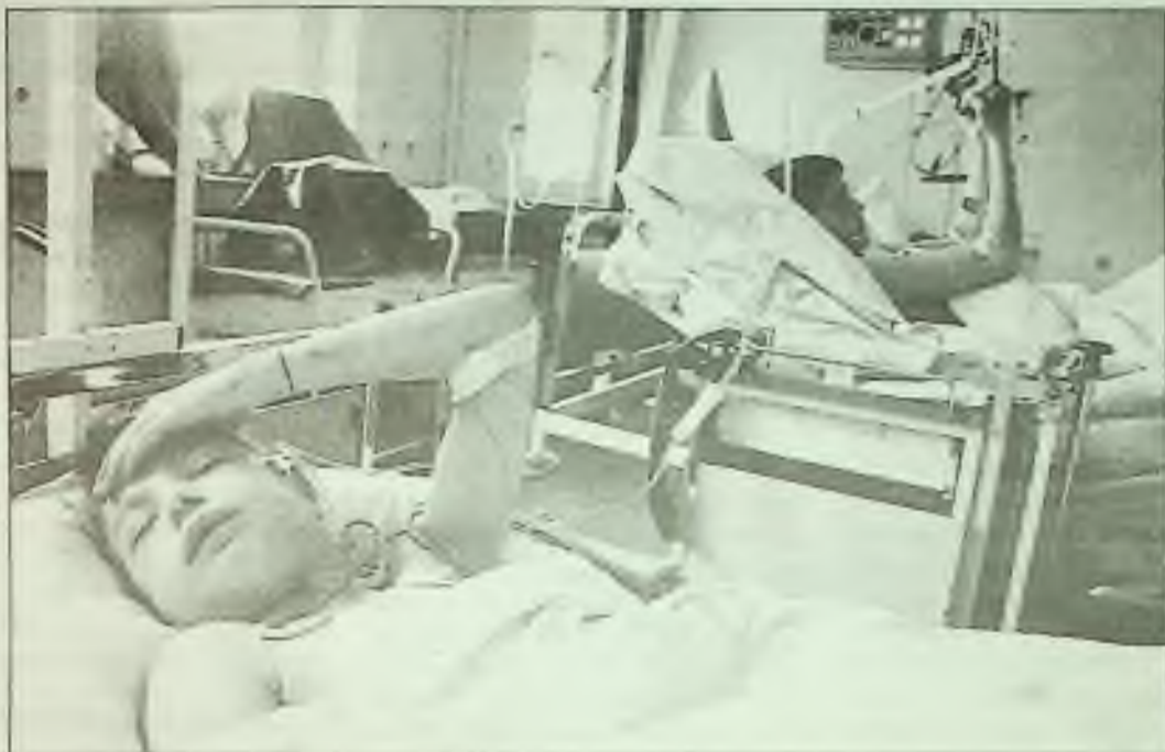
Dva bratři, zranění přes víkend v Sarajevu — Admir (vlevo) a Elvir Ahmethodžić, 11 a 14 — doufají v převezení do Itálie. Byli zraněni střepinou granátu, který usmrtil šest dětí.

Asi 500 lidí tančilo na ulici a pilo, když začla střelba, která trvala asi půl hodiny, jak řekli účastníci. Autority okamžitě dávaly vinu levičáckým rebelům, kteří již předtím napadali členy strany Naděje, mír a svoboda, utvořené bývalými partyzány a známé pod španělským akronymem EPL. Rebelové je teď nazývají zrádci, protože se vzdali boje o zavedení v Kolumbii vlády ve stylu Kuby.