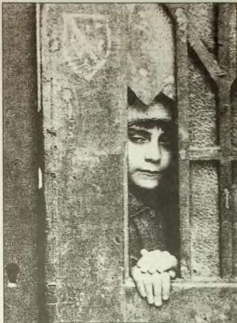
Mladík se dívá rozbitým oknem směrem k sarajevskému tržišti, kde výbuch usmrtil sobotu 68 lidí a poranil víc než 200.