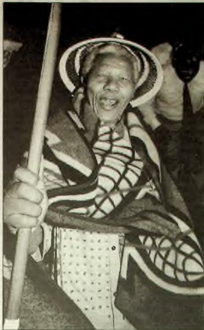
Vůdce ANC - Afrického národního kongresu Nelson Mandela, v tradičním klobouku Basotho, tančil při zastávce během volební kampaně v neděli v Svobodném státě Orange.

Denní a Nedělní Hlasatel je otevřenou tribunou pro všechny čtenáře, bez rozdílu politické či spolkové příslušnosti a náboženského vyznání. Upozorňujeme, že redakce se nemusí vždycky s uveřejněnými články ztotožňovat. Redakce si vyhrazuje právo zkracovat zasláné články. Zasláné rukopisy se nevracejí. Za změnu adresy účtujeme $3.00.