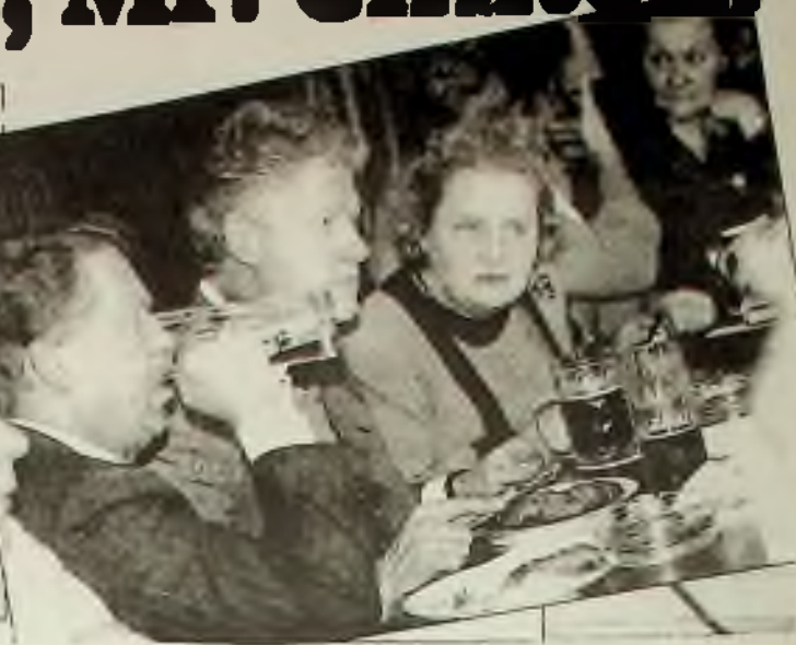
Večeře v hospodě "U tygra"