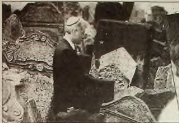
Na židovském hřbitově na Starém Městě v Praze