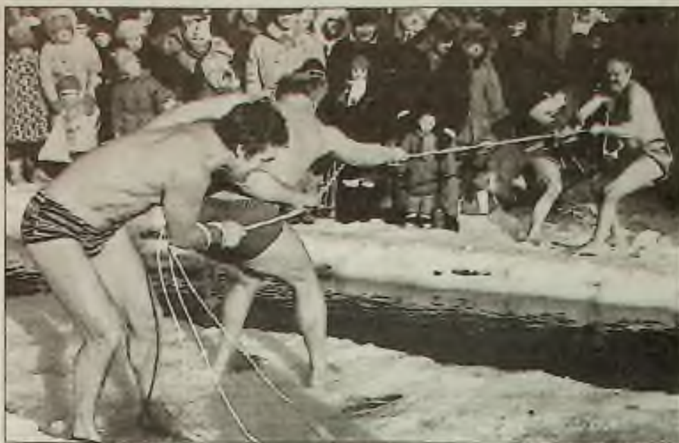
Ukázky z Ruzko-St. Petersburg

"Sledovali jsme ho v den jeho 85. narozenin," řekl Bartlett. "Šel do domu jedné ženy a políbil ji, vyšel ven a jel autem do domu jiné ženy, a na konci toho všeho jsme za ním jeli domů — a byl ženat. Ve skutečnosti měl asi čtyři přítelkyně.