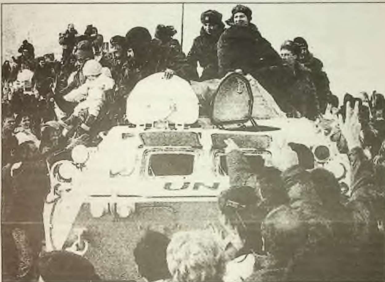
Srbové dávali pozdrav třemi prsty, což je známka vítězství, když v neděli vítali jednotku ruských vojáků v Pale, blízko Sarajeva.