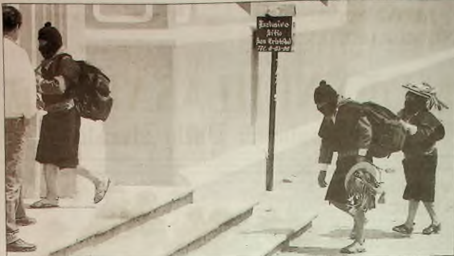
Vůdcové rebelů Národní osvobozovací armády Zapatista v Mexiku přicházejí k místu vyjednávání v San Cristobal de las Casa.