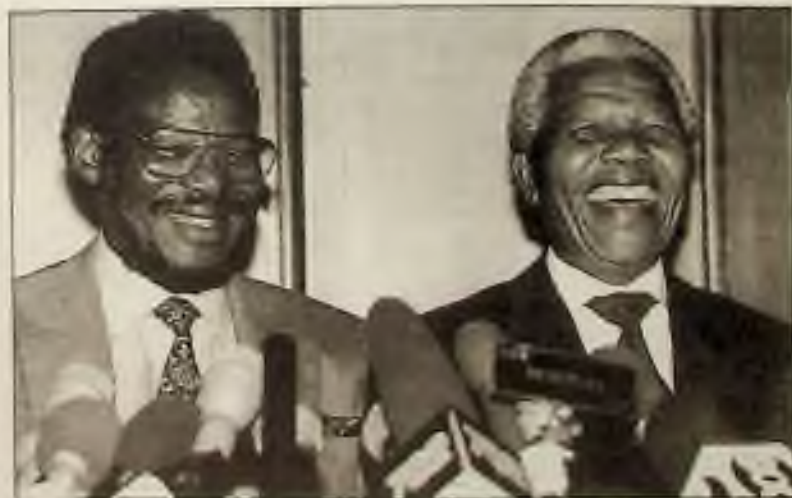
Mangosuthu Buthelesi (vlevo), vůdce Inkatha Freedom Party, a president ANC Nelson Mandela se smějí při schůzce v Durbanu. Ačkoliv Buthelesi udělal skromný ústupek Africkému národnímu kongresu, mnoho zůstává nerozřešeno.

Faktem však na druhé straně je, že pokud jde o objasnění špiónážního skandálu kolem manželů Amesových, nesetkali se Američané v Moskvě doposud s žádným velkým pochopením. Dokonce i zvláštní tým CIA, který chtěl od ruských kolegů získat další informace, se vrací s nepořízenou. KGB dala najevo, že zaujímá postoj "méně než kooperativní", řekl jeden z amerických vládních úředníků.