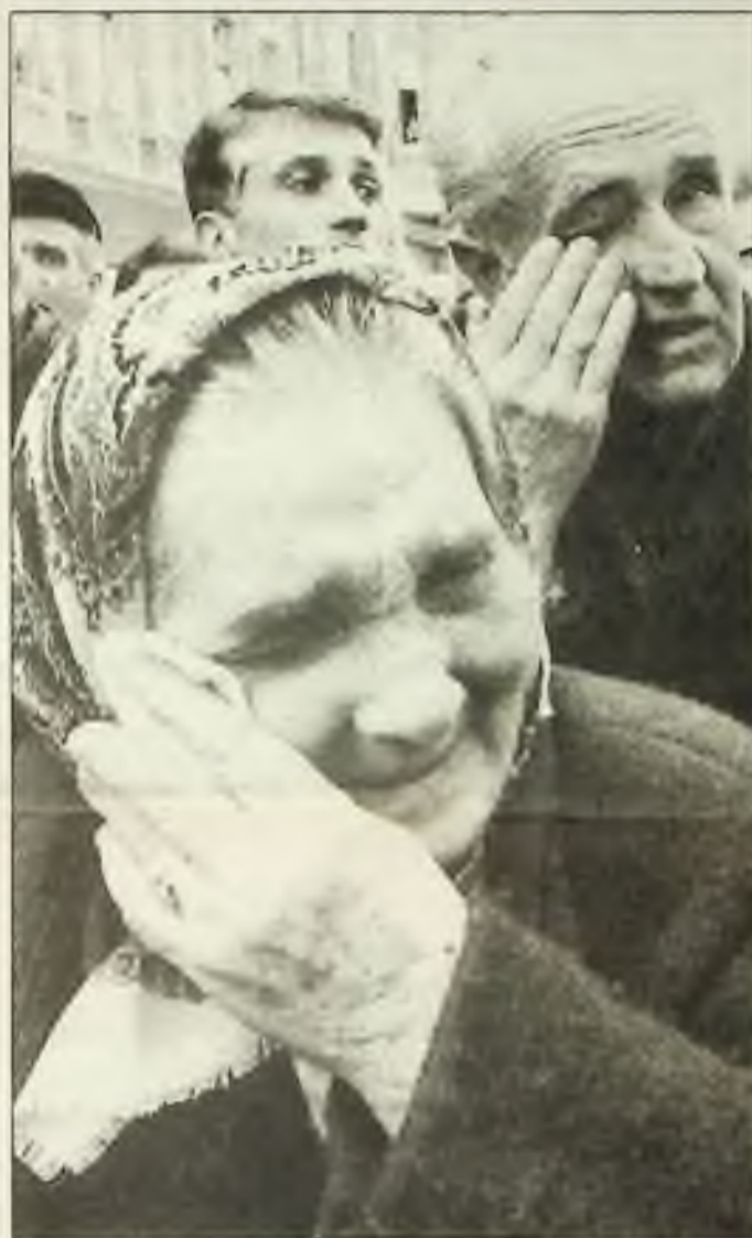
Obyvatelé jiné než srbské národnosti pláčí při nedělní demonstraci v Sarajevě. Přesto, že je příměří, nemohou se vrátit domů do předměstí, které obsadili Srbové.