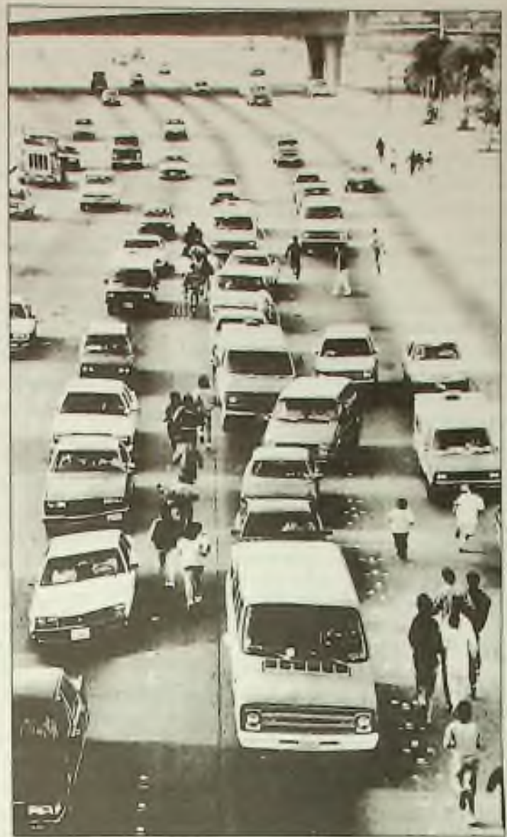
Ilegální imigranti se ženou z mexické hranice do San Ysidro, Californie. Jeden vědec říká, že protiimigrancké ctičení definitivně vzrůstá.

■ Na téměř 100 tisíc korun odhadují dva mladí Čičané škodu, která byla způsobena vloupáním do jejich obchůdku s textiliemi v Anglické ulici v Praze 2. Včera ráno objevili kamenem rozbitou výkladní skříň obchodu a ztrátu dražšího textilního zboží, především kožených a hedvábných bund.