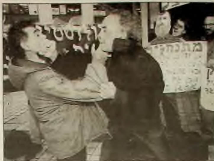
Israelský účastník demonstrací pro mír (uprostřed) dal ránu štváči v Jerusalemě při manifestaci, odsuzující masakr v hebronské mešitě.

Když se FBI dovědělo o plánu atentátu na egyptského prezidenta Hosniho Mubaraka, zabránilo úkladné vraždě u hotelu Waldorf Astoria.