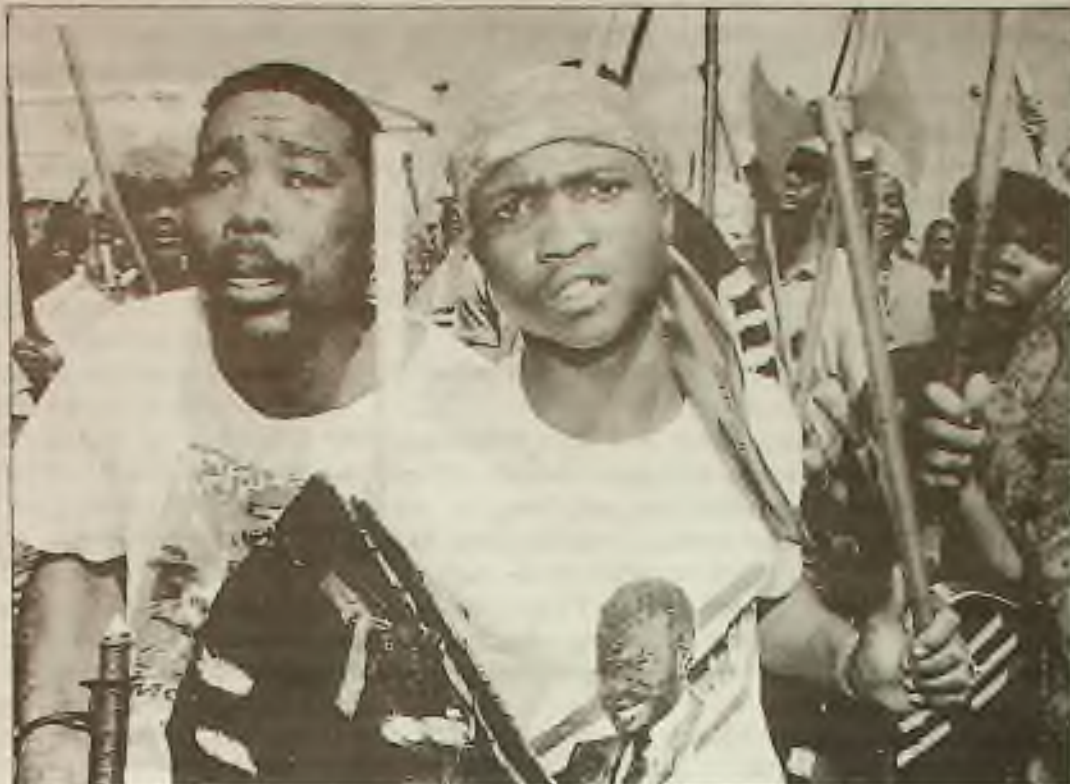
Stoupenci Mangosuthu Butheleziho, vůdce Inkatha Freedom Party, demonstrovali v neděli během manifestace v Jižní Africe. Buthelezi odsoudil zabránění Bophuthatswany jako spiknutí.

Kabinet také určil, že bude zločinnem dávat skupinám finanční nebo slovní podporu - a dokonce nosit tričko s jejich symbolem - seřvenou pěstí proti Davidově hvězdě. Majetek těchto skupin bude zkonfiskován.