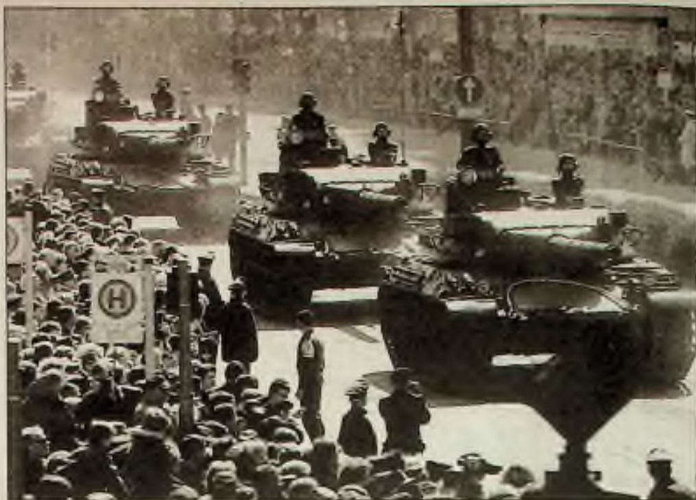
Víc než deset tisíc obyvatel Berlína se přišlo rozloučit s francouzskými vojáky, kteří jsou první ze spojeneckých vojsk, opouštějících nově sloučené město. Američtí, britští a ruští vojáci mají odjít ke konci srpna, a budou poctěni podobným ceremoniálním "Sbohem"

Ale lékařská technologie - která může prodloužit život a ulevit utrpení - ohrožuje omezení vydání, které je cílem reformy zdravotní péče. O technologickém pokroku se v debatách o zdravotní péči celkem nemluví, a někteří experti myslí, že důraz na snížení vydání a snaha, poslat co nejméně lidí do nemocnic, povede k snížení vydání. Avšak doposud je zkušenost jiná.