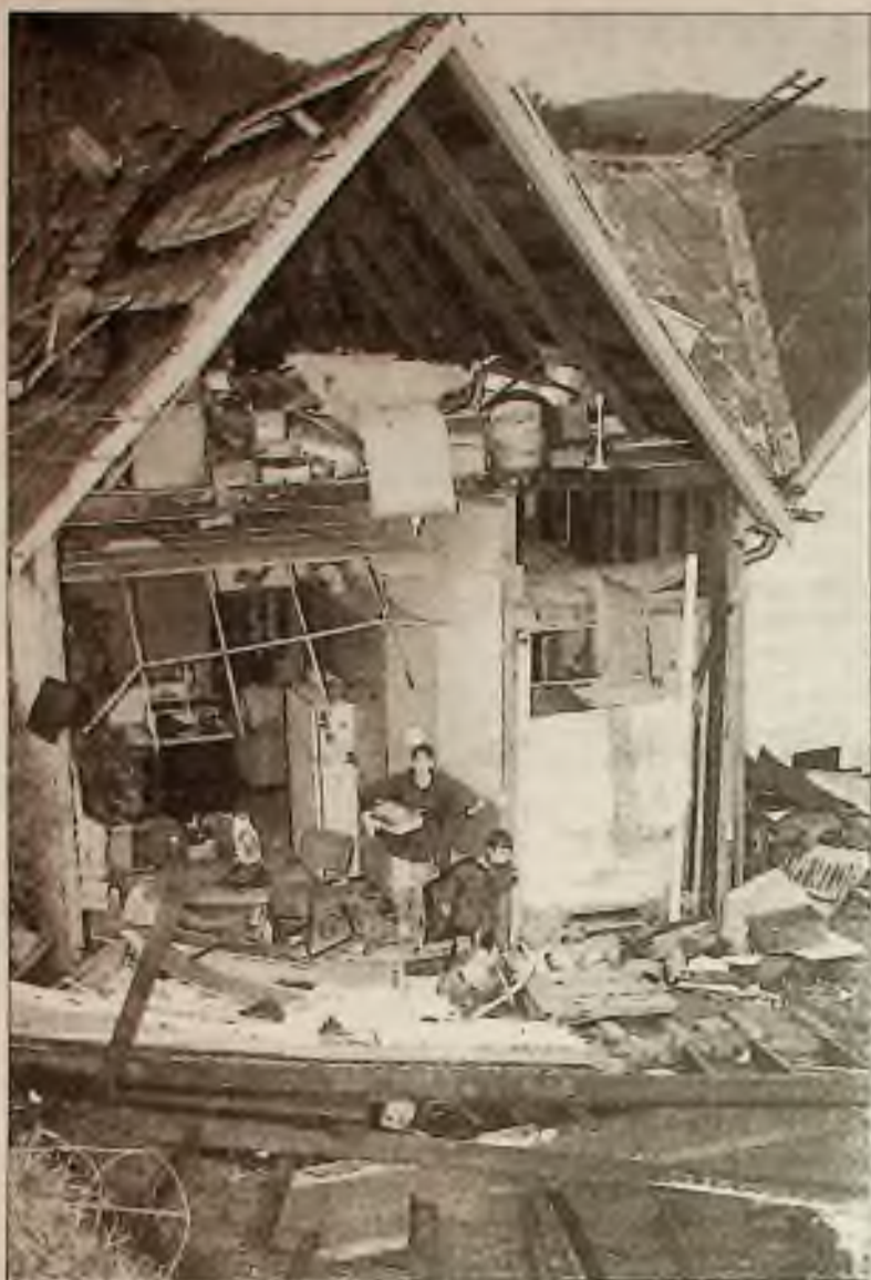
Jedno z třinácti tornád, které postihlo stát Georgia v neděli, zpustošilo scénické město Tallulah. Sousedé pomáhají vynášet věci z poškozeného domu.