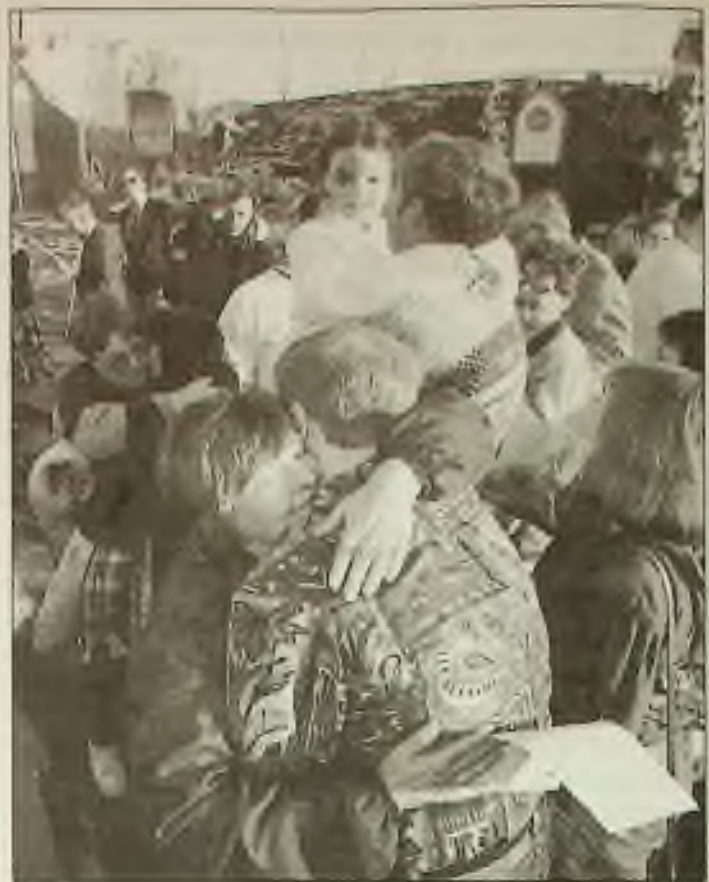
Členové církve se objímali po velikonočních službách minulou neděli u tornádem zničeného kostela, Goshem Methodist Church v Piedmontu, Alabama.

Hledám jakoukoliv práci od 7 AM do 5 PM. Mluvim česky a anglicky. Volejte (708) 652-8795.