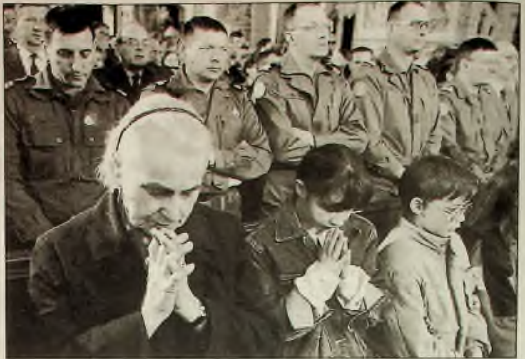
Francouzští udržovatelé mru se připojili k tisícům na velikonoční mši v sarajevské katedrále. Ačkoliv Sarajevo se těšilo z prvních velikonoce bez bojů v posledních dvou letech, jinde v Bosně boje pokračovaly.

Nedělní pochod byl zřejmě předzvěstí slibovaných pochodů proti Jelcinovi, jejichž cílem je zrušení hospodářského reformního procesu a obnovení Sovětského svazu. Přítomni byli vůdčové říjnové rebelie. Všichni byli v únoru propuštěni