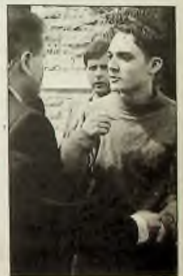
Mladý muž je vyváděn z washingtonského kostela, kde způsobil výtržnost při velikonoční pobožnosti, při níž byl prezident Clinton se svou rodinou.

Před čtyřmi lety byla u Watsona, nyní 71-letého, zjištěna rakovina hrdla. Podstoupil chemoterapii, ozarování a radikální operaci. Byl mu