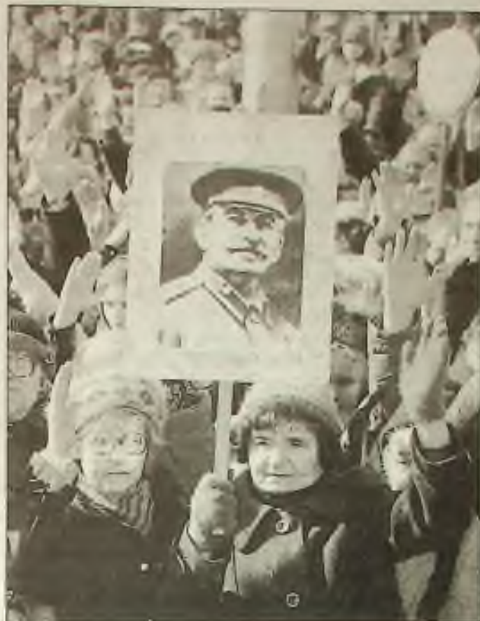
Protestující drží vysoko obraz Stalina a zvedli ruce na znamení, že jsou pro obnovení Sovětského svazu, během nedělních demonstrací v Moskvě.