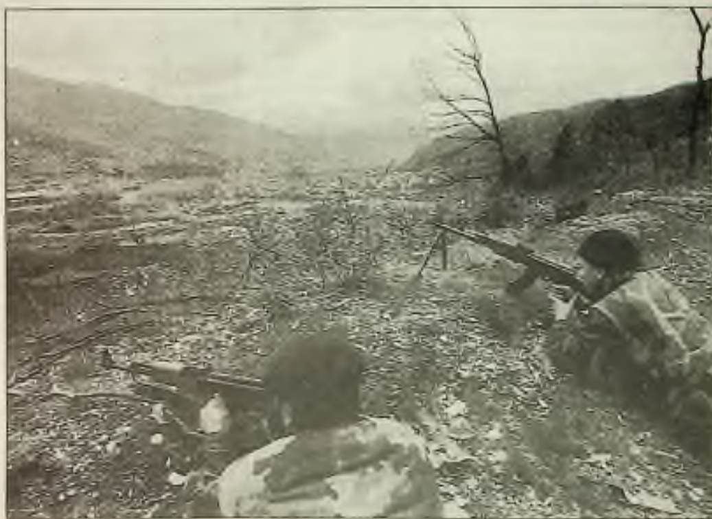
Vojáci - bosenští Srbové - pozorovali v sobotu obležené útočiště muslimů, město Gorazde. V neděli začalo NATO útočit na srbské pozice ze vzduchu, pod záminkou ochrany svého personálu v Gorazde.

Teroristé-podvodníci - Teroristické organizace, zvláště ty v údolí Libanonu Bekaa, natiskli jeden bilion dolarů padělaných stodolarových bankovek. Kromě rutinního financování operací jsou zřejmě dva jiné hlavní důvody k tisknutí této obrovské zásoby skoro nerozeznatelných peněz. Za prvé, chtějí financovat vývoj a konstrukci nukleární zbraně. Za druhé je možné, že hledí podkopat stabilitu amerického dolaru na mezinárodních trzích náhlou záplavou laciné měny, a tak ublížit hospodářství Izraele, které závisí hlavně na dolaru. Skupiny údajně tisknou $300 milionů ročně. Cena nukleárního zařízení od některé z bývalých sovětských republik, které několik let nebudou schopny rozebrat všechny své nukleární zbraně, je údajně $100 milionů. Autority se prý obávají, že hotová měna bude svádět Severní Koreu a Irak, k takové koupi.