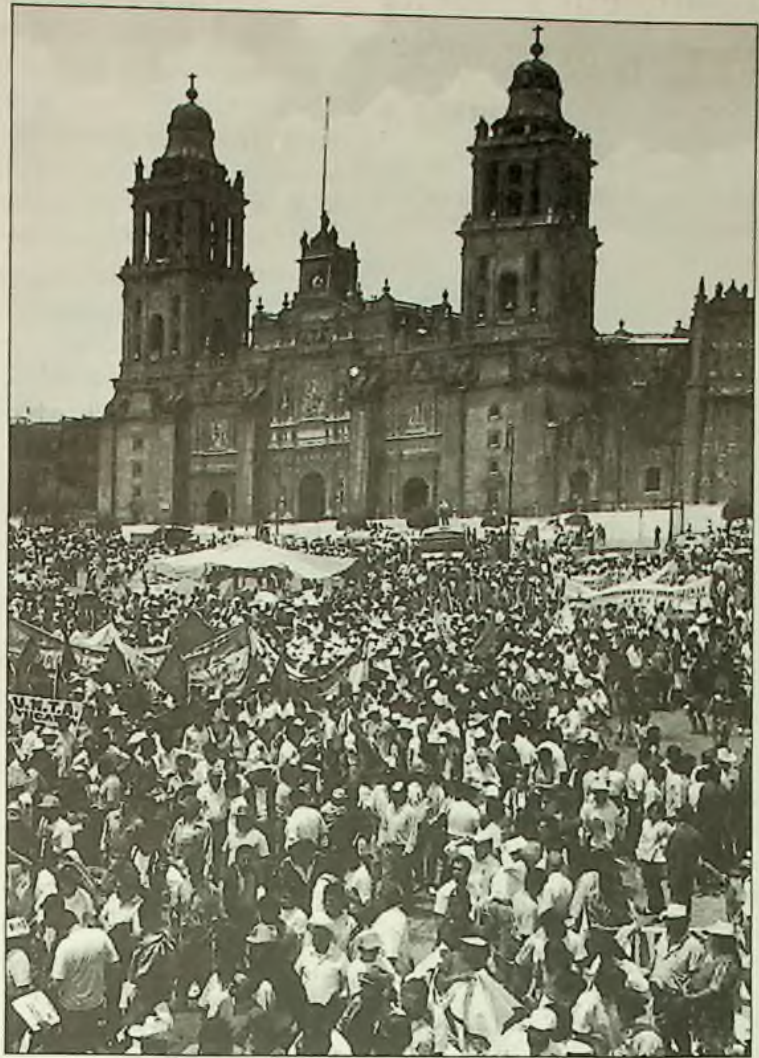
Desetitisíce lidí se shromáždilo na hlavním náměstí v Mexico City minulou neděli, na památku 75. výročí smrti revolucionáře Emiliano Zapata, a na podporu zapatistických rebelů r. 1994.

To je pravdivá část knihy E. Fromma. Jinak ale Fromm a další