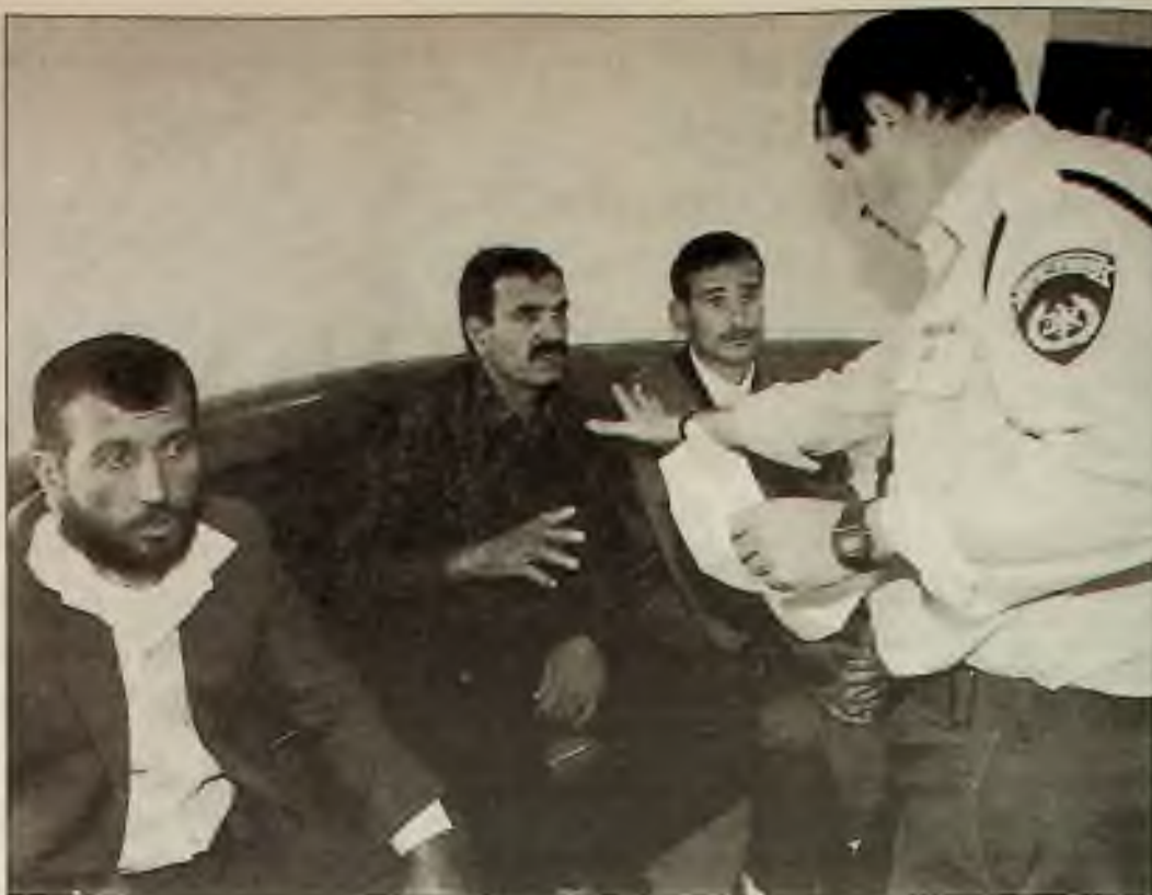
Policejní důstojník v Jeruzalémě vybírá prvního svědka z arabské stráže. Tři se připravují na výpověď o tom, co viděli, když byli na stráž u mešity v Hebronu během masakru 25. února.

Evropský soud o lidských právech ve Štrasburku, kam se Feldekův obhájce obrátil, tedy s největší pravděpodobností rozhodne v básníkův prospěch. Tam už však nepůjde o spor Feldek versus Slobodník, ale Feldek versus slovenská justice. Blamáž Slovenska, a hlavně jeho justice, bude o to větší, že