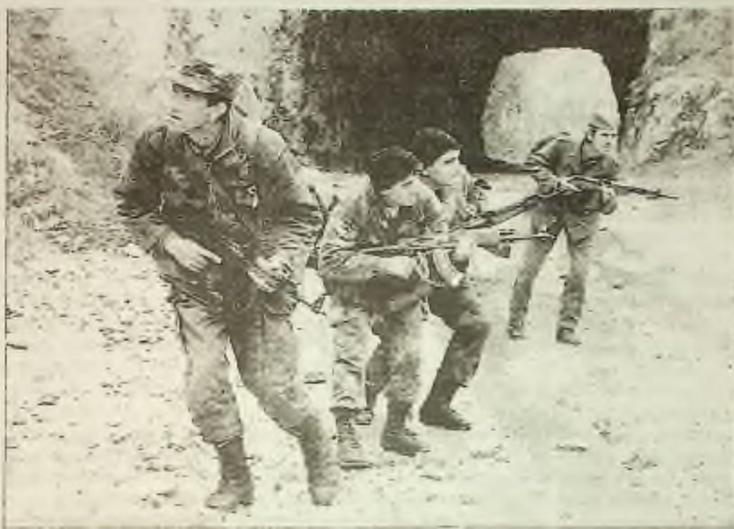
Zatímco někteří vojáci bosenských Srbů si udělali přestávku v nedělním obléhání Gorazde, jiní patrolojí horskou cestu, aby zabránili muslimským vojákům úniku a dosažení hlavního města Sarajeva, 50 mil na severozápad.

Aby Rusko dosáhlo bodu soběstačnosti a nepotřebovalo další pomoc od Západu, řekl úředník IMF, bude vyžadovat úlevy od dluhů v částce $34 biliony, což mu může poskytnout financování Světové banky a soukromý kapitál.