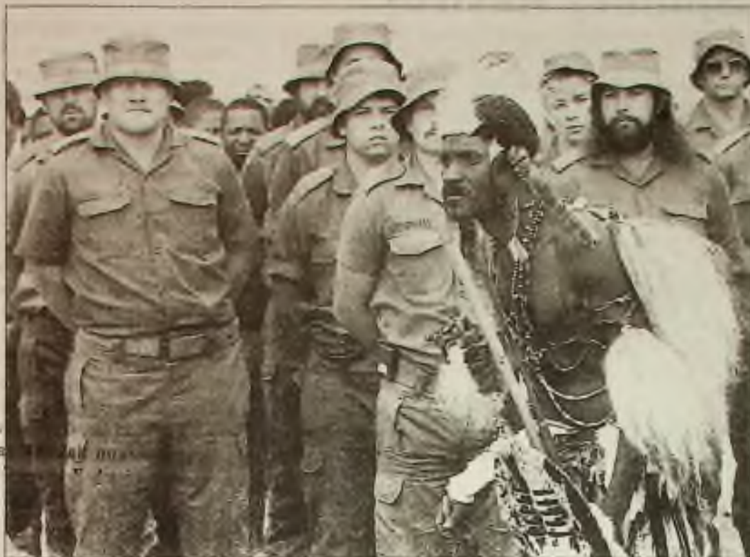
Úderný oddíl Burů svého stylu pozoruje bojovníka kmene Zulu během manifestace pro zulského krále Goodwilla Zwelithiniho v provincii Natal v Jižní Africe. Pravicoví úderníci slíbili svou oddanost králi.

Thajský rybářský člun se 111 podezřívánými ilegálními přistěhovalci byl zadržen a odtažen pryč z vod Spojených států pobřežní hlídkou, aby cestující nemohli vystoupit na břeh. Spojené státy se snaží zabránit přistání nezákonných přistěhovalců, protože žadatelé o azyl mohou ve Spojených státech zůstat léta, zatím co se procesují jejich žádosti.