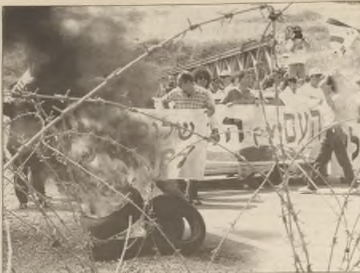
Izraelští usedlci v Golanských výšinách blokují cestu na protest proti nabídce Izraele, že odtáhne ze strategického území výměnou za mírovou smlouvu se Sýrií. Americký státní sekretář Warren Christopher byl v neděli v Damasku, aby přijal protinávrh Sýrie.

Parazit se dostává do pitné vody zvířecími nebo lidskými odpady. Chlor je nezabije, pouze vysoká teplota nebo filtrace je účinná. Bezpochyby povede nález ke změnám ve zpracování vodních zásob k lidské spotřebě.