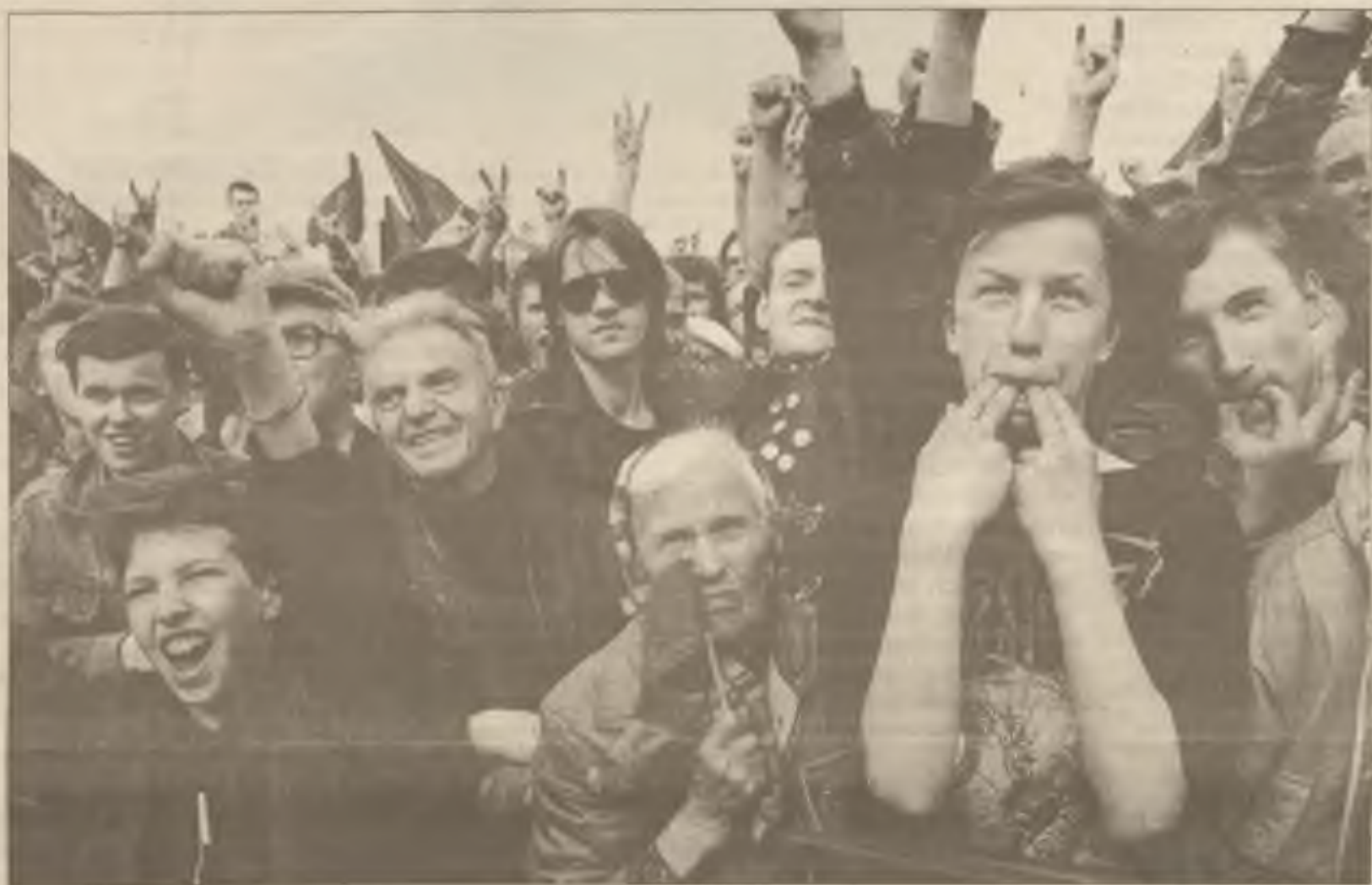
Při nedělní komunistické manifestaci v Moskvě starší žena klidně drží svou sovětskou vlajku, zatímco nacionalisté projevují svou podporu protivládním řečníkům.