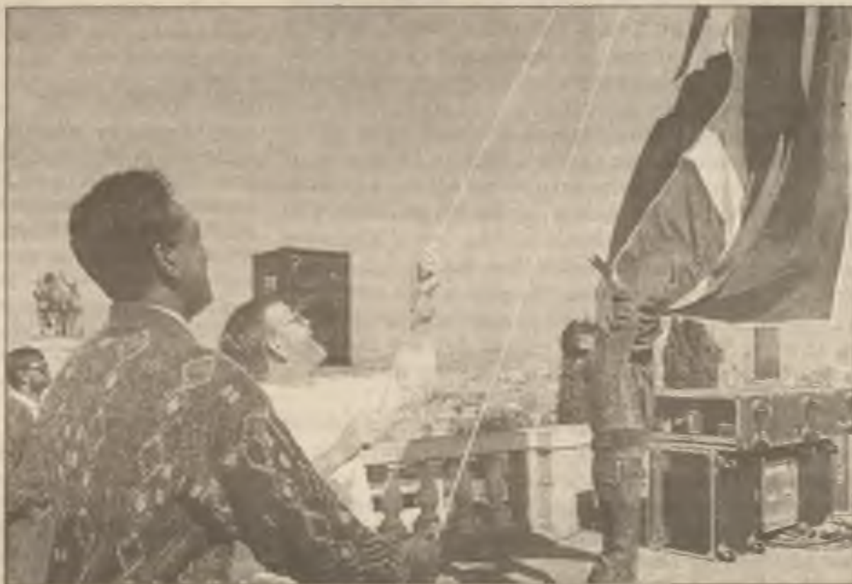
Někteří z lidí, kteří se zúčastní úterní inaugurace zvoleného prezidenta Nelsona Mandely se cvičí v ceremonii vztyčení vlajky u oficiálních vládních budov Unie v Pretorii.

Mandela složí svou přísahu za přítomnosti 5,000 světových vůdců, 150,000 prostých lidí a miliony lidí budou pozorovat na televizi ceremonii za osmi tunami neprůstředného skla. Mezi návštěvníky budou mezi jinými kubánský vůdce Fidel Castro, libyjský Moammar Ghadafi, vicepresident Al Gore, a americká první dáma Hillary Rodham Clinton.