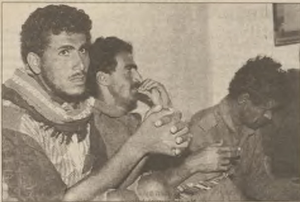
Zatčení vojáci z Jižního Jemenu byli v neděli vystaveni pro novináře v Jawdaru, 108 mil na severovýchod od Adenu, uprostřed konfliktujících zpráv o stavu bojů o jižní opevněné město.