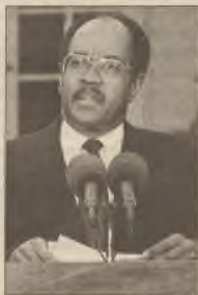
William Gray, prezident United Negro College Fund - nový zvláštní poradce prezidenta Clintona v otázkách Haiti.

Yes, it is controversial, as Social Security was when it passed. But we did the right thing when we passed Social Security, and I hope we will do the right thing again and pass the President's health proposal.