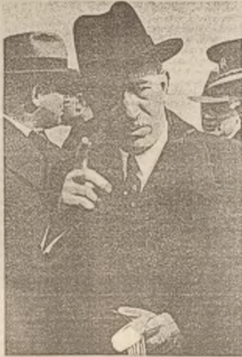
Prezident dr. Edvard Beneš

"Fierlinger ve své knize lže. Falšuje zprávy. Řekl jsem mu, že Sověty jej chtějí mít za ministerského předsedu proto, aby jim sloužil. Nabídal jsem ho, aby to prohlédl, nedověděli to, tak že věci nerozumí. Fierlinger opáčil, mám-li ho tu za idiota. To ne, ale řekl jsem, že nerozumíte věci. Hledal jsem jiného ministerského předsedu, ale nikdo nebyl, všichni byli slabí, ustrašení. Nabídl jsem křeslo Gottwaldovi. Namítl, že by to Západ neschvaloval. Musel jsem to uzнат. Chtěli jsme Šrobára, bylo mu téměř 80 let... na revoluční dobu by nestačil. Šel jsem ke Stalinovi, vše jsem mu vyložil. Mluvil jsem velmi otevřeně. Stalin mnohé chápal, byl velmi slušný a myslím, že mluvil naše komunitu. Byl jsem v zoufalé situaci,