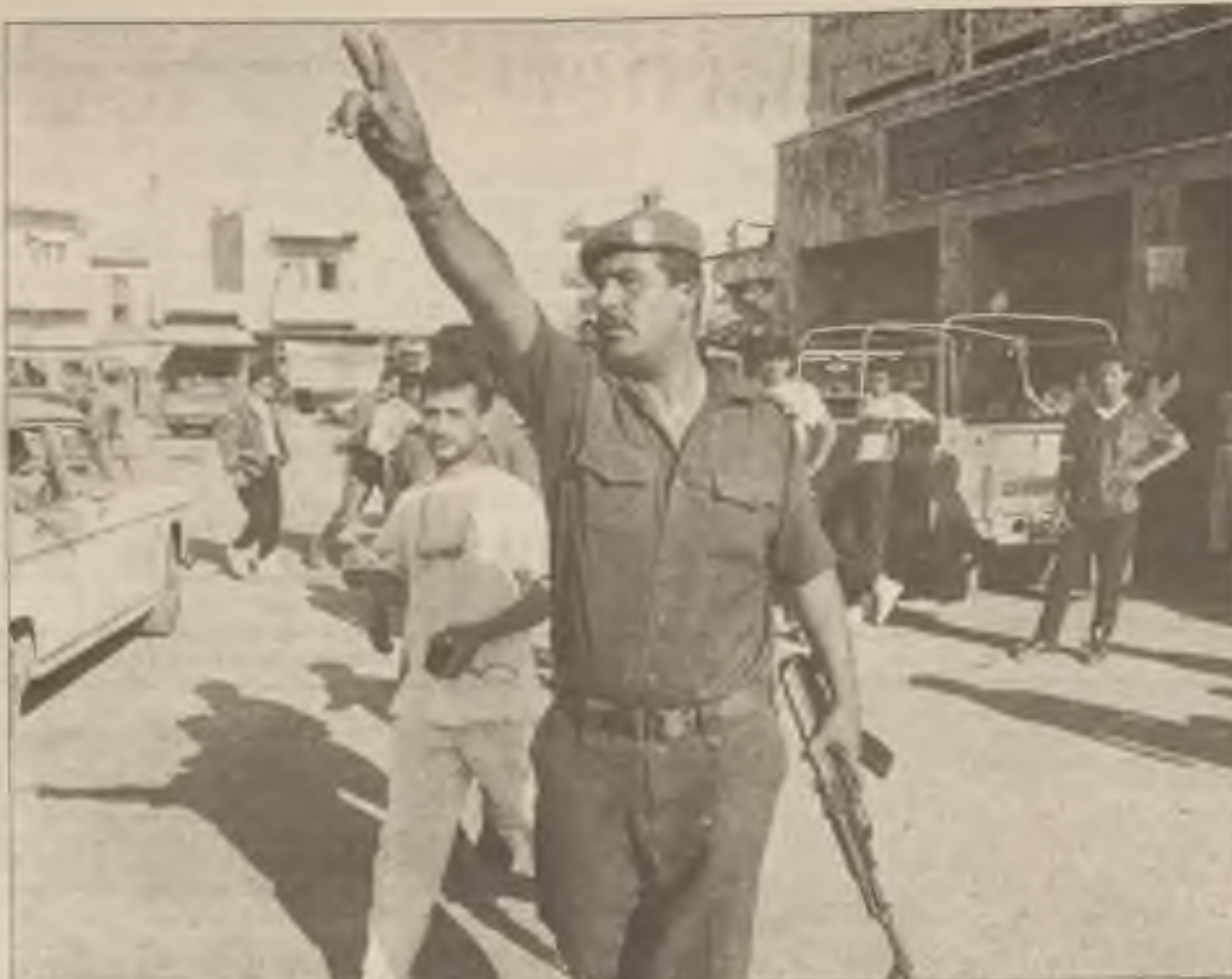
Palestinský policejní důstojník řídil v neděli provoz v Jerichu. Nastala zácpa, když Palestinci z jiných míst přijížděli do města v druhý den samosprávy.