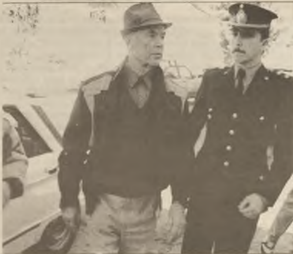
Policie doprovází bývalého nacistu, kapitána SS Ericha Priebke do jeho domu v Bariloche v Argentině, kde si bude odsluhovat odsouzení k domácímu vězení.

Brzy dostaneme dokonce předvolební pomoc z Japonska ve výši 200 mil. US dolarů na všeobecné nákupy (co to vlastně je?). Kdo a kdy