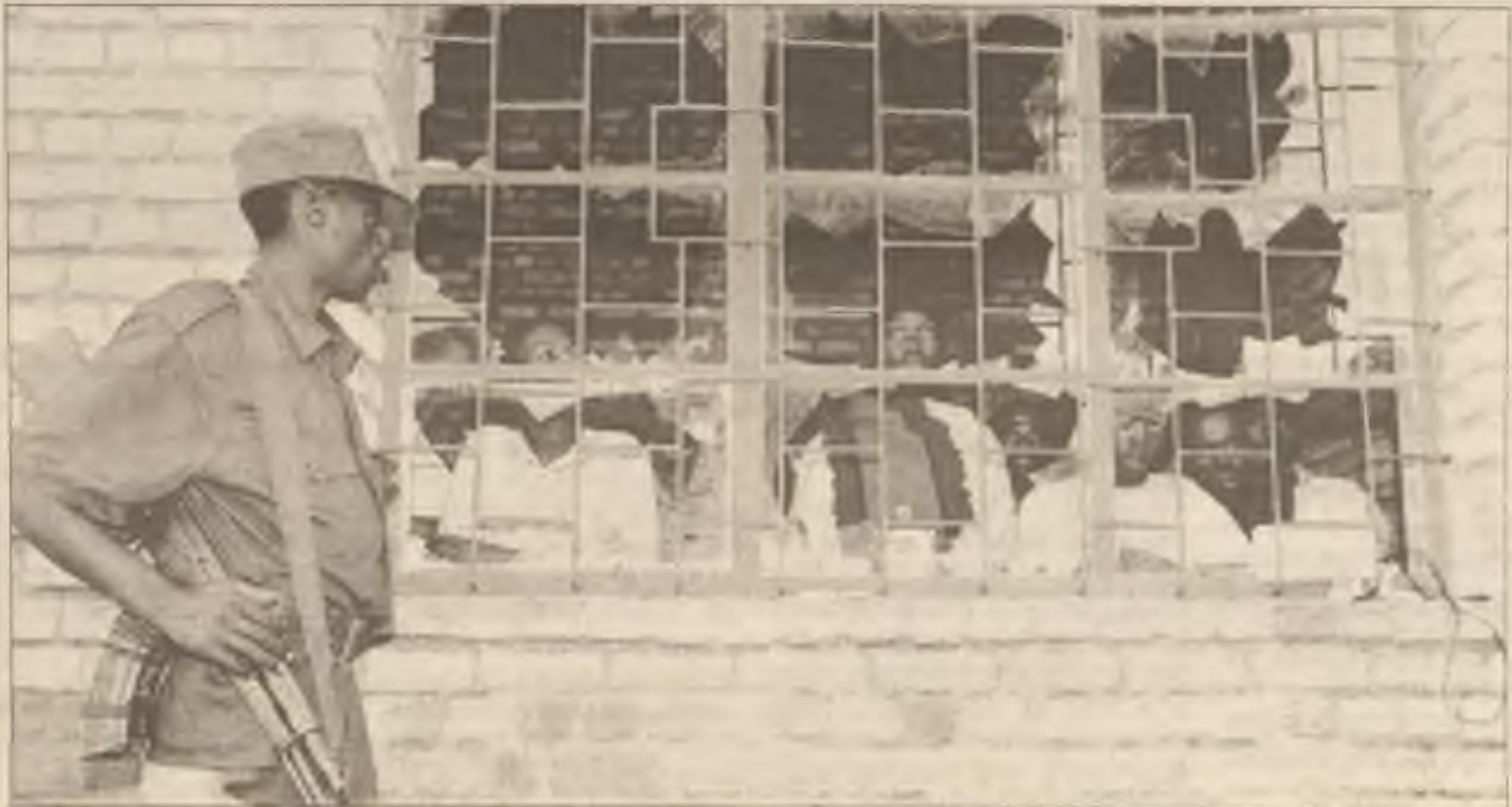
Voják, postavený na stráž rebely, hlídá dům, obrácený v zatímní vězení asi 20 mil od hlavního města Rwandy.