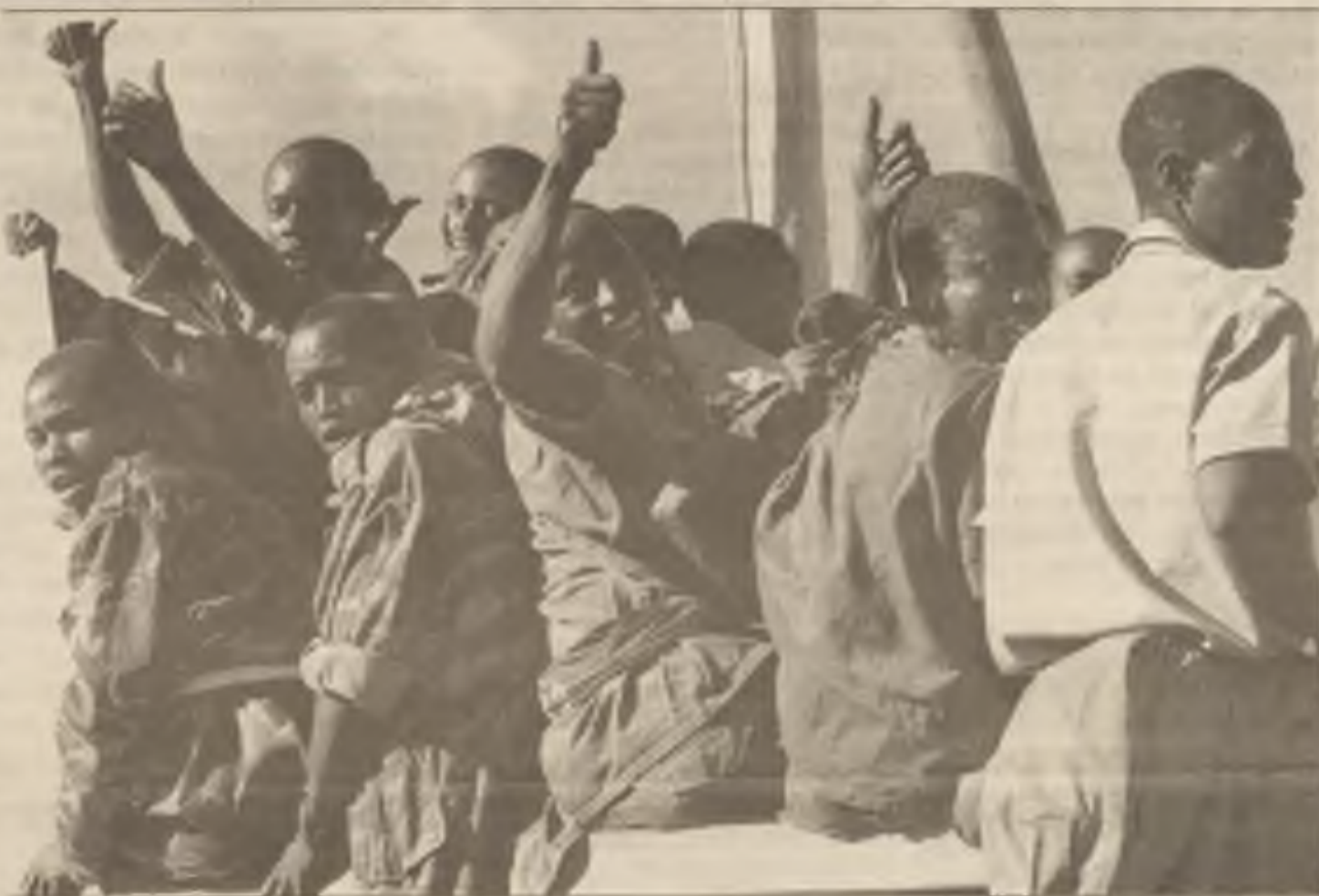
Rebelové Vlastenecké fronty ve Rwandě zpívali v neděli po vítězství, když vyhnali vládní vojsko ze základny u hlavního města Kigali.

Rebelové jsou většinou členové menšinového kmene Tutsi; Hutus kontrolují vládu a vojsko. Krvávé boje začaly když prezident Juvenal Habyarimana kmene Hutu byl zabit při podezřelém zřícení letadla v Kigali 6. dubna. Prezidentská garda a nějaké armádní jednotky a záškodníci, zorganizovaní extrémními politiky Hutu zabíjeli civilisty kmene Tutsi. Bylo zabito asi 200,000 lidí.