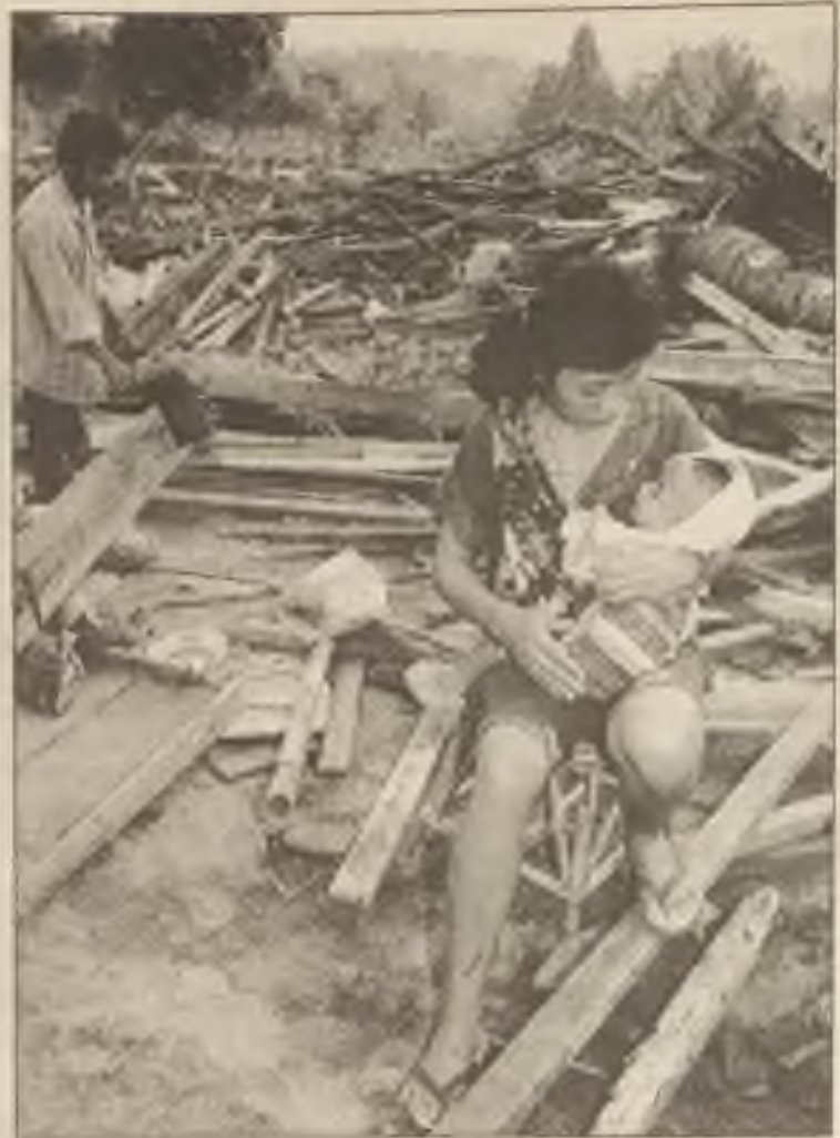
Matka drží svého 13měsíčního synka ve vesnici Panour v Indonésii po několika vlnách přílivu, který usmrtil minulý pátek 192 osob.

Německé sdělovací prostředky měly spoustu článků a programů o invazi. Mnohé z článků, jako série o dvou částech ve Spiegel News