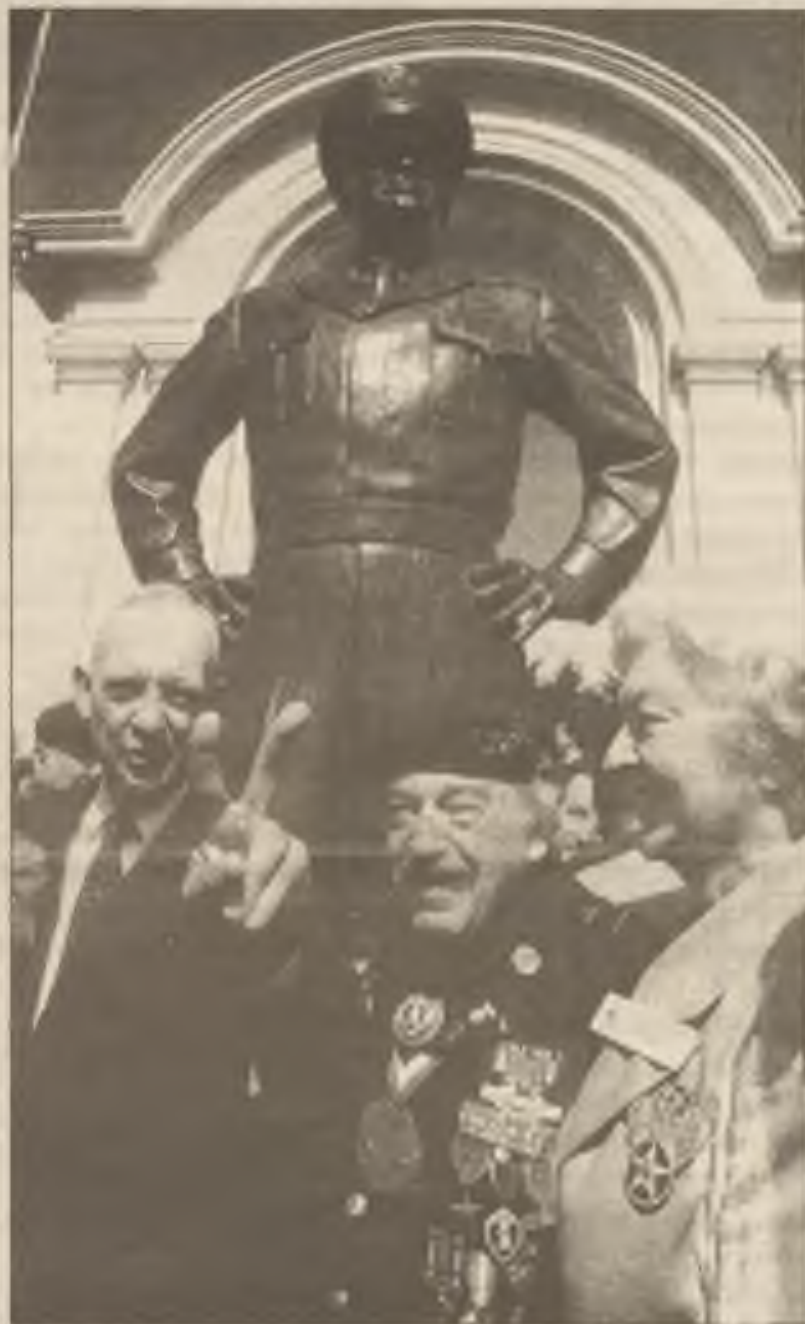
John Eisenhower (vlevo), syn prezidenta a generála Dwighta D. Eisenhowera, dával znamení druhé světové války "V" (victory - vítězství) minulou neděli při odhalování památníku jeho otce v Bayeux v Normandii.

Čím více se vladaři během minulých let dopouštěli hrdelních a vlastizrádných zločinů, kupříkladu nehájení celistvosti státu a globálního ožebračování jeho zbytku i občanů, tím víc pro zaretušování těchto i dalších protiprávních a protilidských ohavností křičeli, a napomínali usouzené lidi, aby uložené břemeno mlčky nesli (pro jejich slávu v zahraničí), nechtějí-li trvale zůstat na dně, kam nás záměrně zavedli. A Pokrač. na str. 4