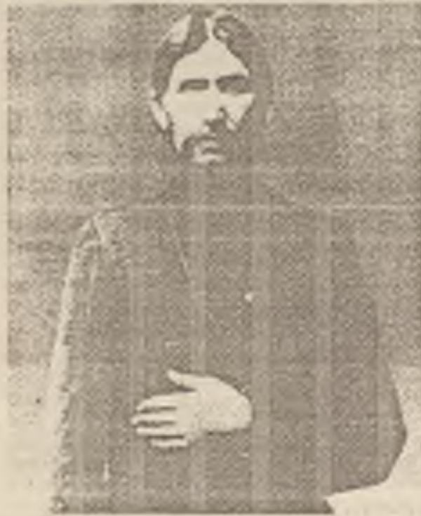
Sibiřský mužik Grigorij Rasputin, který se vešel do přízně carské rodiny a získal mimořádný vliv na státní politiku dvora