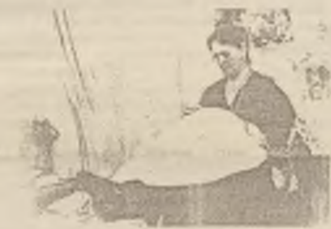
Carevna ve svém šerikovém pokoji v Carském Selu r. 1912

psát o jakémsi tajném telegramu, který poslal carevně a ve kterém předpověděl zkázu a neštěstí ve válce. I sama Alexandra za pobytu v Tobolsku o tom telegramu vyprávěla, ale v sešitě s Rasputinovy výroků nebyl založen ani opsán.