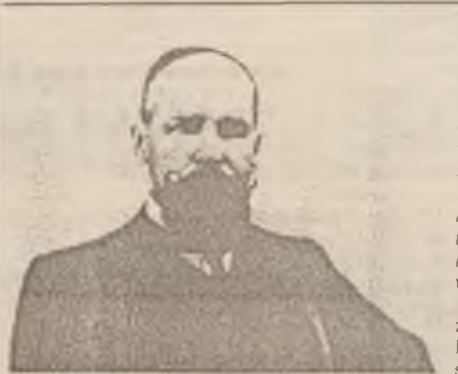
P. A. Stolypin, předseda ministerské rady v letech 1906-1911, zavražděný při oslavách 50. výročí zrušení nevolnictví v Rusku

To byl tedy příběh Grišky Rasputina, „svatého ďábla“, jak mu někteří přezdívali. Podívejme se však krátce na případ jiného významného muže carského impéria. Máme zde na mysli předsedu vlády a ministra vnitra v jedné osobě, P. A. Stolypina, který byl snad nejvýznamnější osobností ve vládě Mikuláše II. Stal se iniciátorem a hlavním protagonistou radikální agrární reformy, již se snažil čelit katastrofální hospodářské situaci a závažně rozněcovaným sociálním nepokojům. Skutečně se mu to do velké míry podařilo. Po jeho reformách nastává