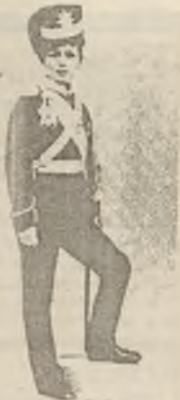
Následník trůnu Alexej Romanov

Je naprosto příznačné, že člověk, který pozvedl Rusko z bídy a zmírnil nespokojenost národa, musel být odstraněn. Znovu zde nalézáme podobnost s Františkem Ferdinandem, který chtěl také pracovat pro dobro národů, jež mu měly být svěřeny, a měl v úmyslu zavést spravedlivou federaci a pomýšlel i na pozemkovou reformu. Pointa je nasnadě: vynikající osobnosti, pracující pro dobro vlastní a rozkvět monarchie, musí být zlikvidovány, aby lid mohl být štvan proti panovníkovi, aby každá nespravedlnost mohla být zveličována až do nebe a aby národy mohly být vrženy do revoluce. Nejinak tomu bylo i v případě Stolypina. V únoru 1911, při oslavách padesátého výročí zrušení nevolnictví v Rusku, byl zastřelen před očima cara Mikuláše. Ra-