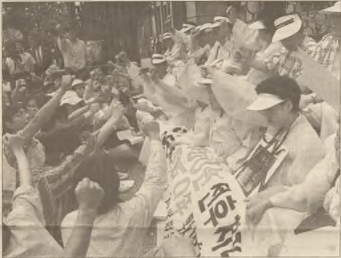
Korejci se domáhají náhrady za válku: k 22 ženám z Jižní Koreje, které ztratily muže a otce, se přidali jejich zastánci při protestu v Tokiu u Dietu, japonského parlamentu. Mnoho Korejců bylo odvedeno japonskou armádou, aby válčili proti spojencům.

tohoto sektoru je nejvíce potřebná. Několik zákonodárců nečeká na prezidenta a již připravují plány na reformu veřejné podpory.