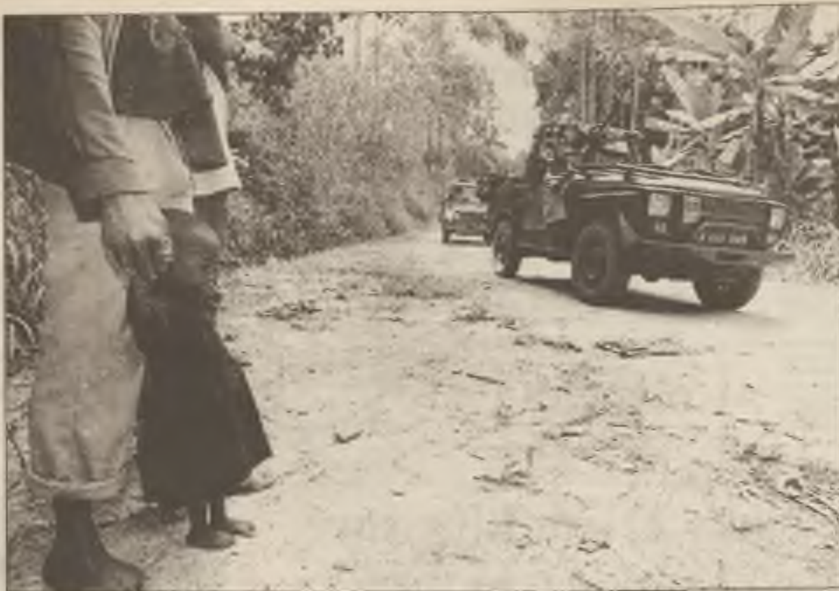
Francouzský voják v neděli míjí ruandskou rodinu 40 mil od zairské hranice. Nově přijíždějící Francouzi doufají, že pomohou obětem občanské války v operaci nazvané Turquoise.

Nasrinová, 31-letá feministka, zpírá, že volala po předělání koránu, aby byla dána ženám stejná práva.