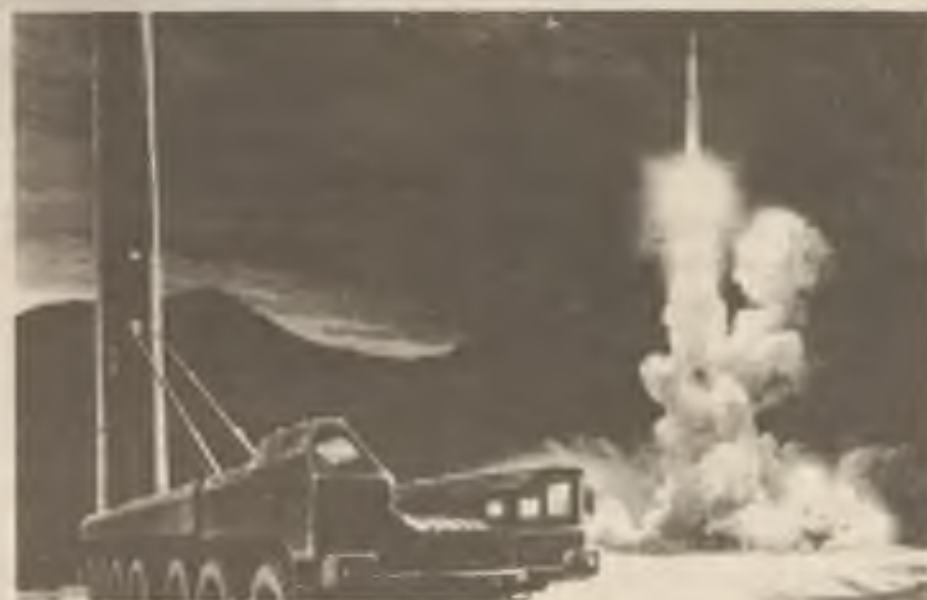
A Soviet ICBM, the SS-25, still in Russia's arsenal

Odhalení Sudoplatova souhlasí s nálezy několika vážených, celkem nezávislých amerických a sovětských specialistů. Tyto nálezy byly pokračování na str. 5