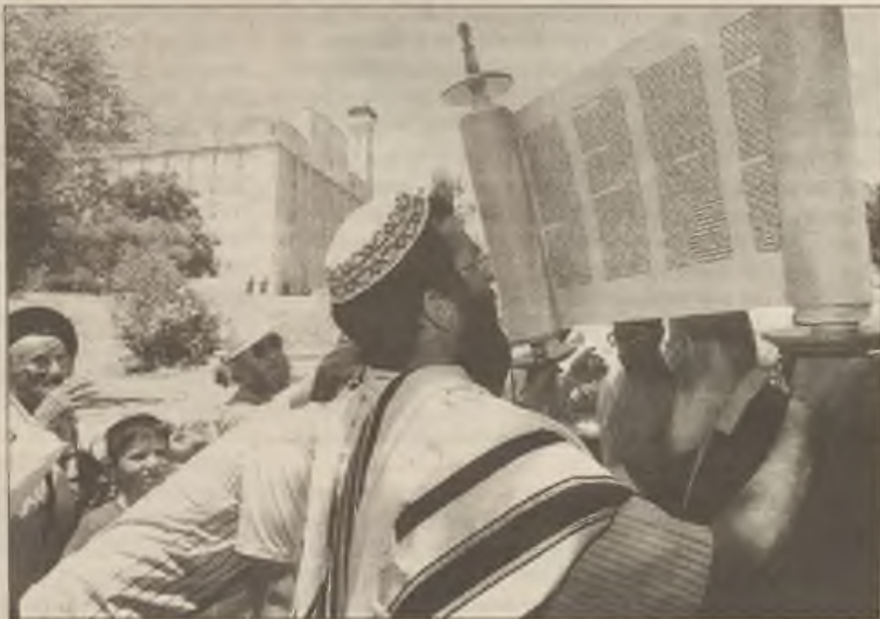
Židovští usedlíci se modlí v neděli venku před hrobkou patriarchů v Hebronu kde byli zabití muslimští věřící. Izraelská zpráva doporučuje přísnější bezpečnost v mešitě.

je na vymření. Z 1400 majáků na pobřeží Francouzsko má ještě jedno sto svých strážců, deset z nich přímo na moři. Přicházejí po dvojicích na týden - dopravují se na závěsné sedačce po laně napnutém mezi majákem a pobřežím. A nikdy neví, jestli se po týdnu opravdu vrátí na pevninu... - Nepřízeň počasí může způsobit i delší zdržení ve službě. Nepříjemný rekord drží Noel Fouquet, který byl v roce 1923 až 100 dní zajatcem majáku Ar-Men.