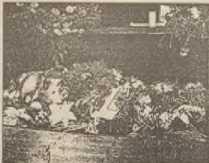
Plukovník Ušakov v rakvi (str. 49).

Zatím frontální skupina po úspěšném boji u Tanchoje, majíc úlohu značně usnadněnu sebeobětovností oddílu Ušakovova, rychle se probíjela kupředu. Dne 17. srpna v 8 hod. ráno byla po přestřelce naším předvojem obsazena stanice Mysová, kde rudí před tím byli napadeni naším loďstvem. Bolševické ešelony byly v tu dobu hlášeny 45 verst k východu od Mysové, u stanice Posolské. Náš předvoj vypravil se ihned dále, aby se včas spojil se skupinou Ušakovovou. Bolševická hlídka, čekající u mostu před zastávkou č. 19, byla námi zahrnána a naše jízda se rychle polybovala kupředu. Brzo vzato 13 vlaků rudých, stojících za sebou na kolejích. Nařizeno troubiti naše signály, aby bylo získáno spojení se skupinou Ušakovovou.