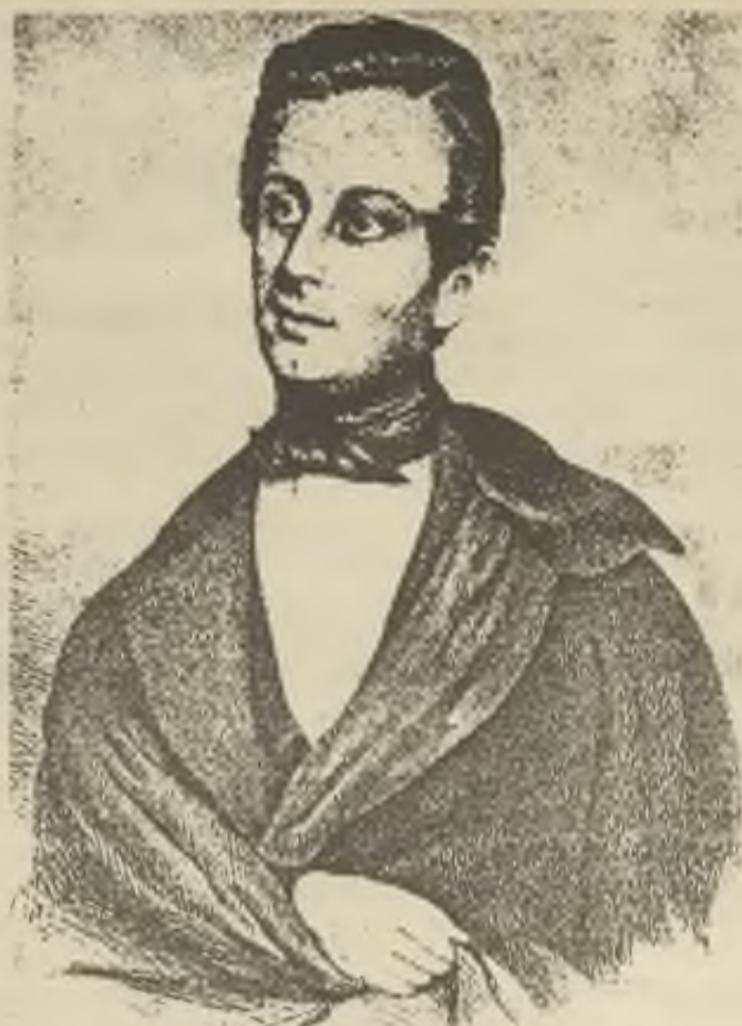
JOSEF KAJETÁN TYL

„Ave! — Jen dál!“ zvolal hospodář, a do světnice vešel hubený, vytáhlý, asi třicetiletý človíček. Jeho modrý frak se žlutými knoflíky, přistříhnutý podle vlaštovčích vidliček, byl sice již na loktech do běla otřený, pod pažďím propocený — šedivé letní pantalonky byly o dva prsty krátké, zato ale dlouhými podšlapky nahoru vytažené; přece však bylo na něm jakousi strojivost viděti, a bažení jeho po uhlazeném zevnějšku bylo zvláště na bílé pikové vestě, na červeném polohebdávném šátku na krku a na žlutých rukavičkách pozorovatí. V ruce měl klobouk a tenounkou rákosku, s kterou skoro pořád zahrával.