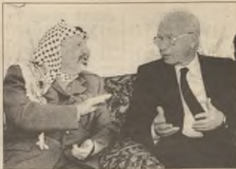
Izraelský ministerský předseda Jicak Rabin hovoří v Casablance v Maroku s předsedou Organizace pro osvobození Palestiny Jassirem Arafatem (vlevo). Izrael oznámil, že uvolní cestovní omezení na Západním pobřeží a v pásmu Gáza.

Christopher se připojil k 2,100 politických a obchodních vůdců z šedesáti zemí při otevření třídenní konference. "Pokrok k míru mezi