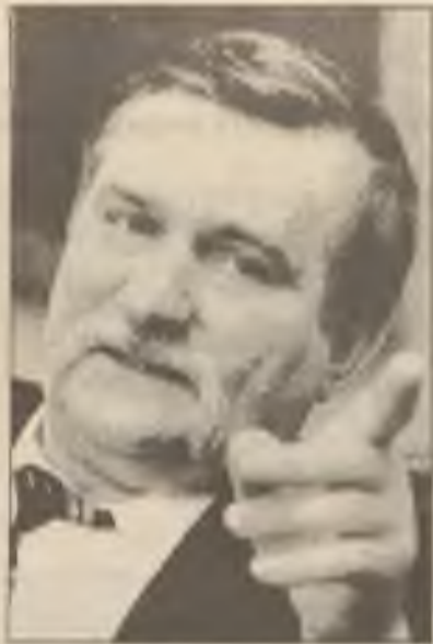
Polský prezident Lech Walesa: "Polsko mi připomíná vůz, který vázne v blátě... Hromadí se tu hněv a únava."

popularita silně klesla, se octl na prvním místě na seznamu nejméně důvěryhodných politiků. Varšavský Public Opinion Research Center při průzkumu veřejného mínění shledal, že 48 procent polských