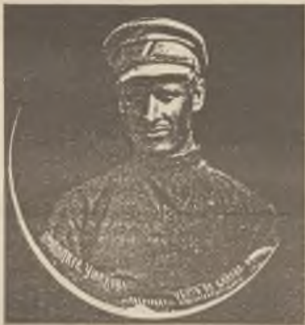
Plukovník Ušakov (str. 49).

Když oněch 10 bratří se vrátilo na stanici Posolskou a podalo zdrcující zprávu o zajetí podplukovníka Ušakova, všichni úderníci jako jeden muž, nehlídce na únavu a slabost, pod velením poručíka Háseka rychle spěli k zastávce č. 19, aby vysvobodili svého vůdce. Avšak před zastávkou narazili na vlnu rudých asi 3000 mužů a byli donuceni ustoupiti, majíce ohrožena křídla. Byla zaujata posice asi 4 versty před Posolskou. Rudí, ještě zesílení, přešli k útoku. Ve dvě hodiny v noci, když naši úderníci již neměli patron, po hrdinném, dlouhém odporu naši, zmatení výkřiky českých komunistů na nepřátelské straně, musili ustoupiti a dali se o něco nalevo. Zatím kapitán Dvořák, státní ochranu, vyslanou k Verchně-Udinsku, zaujal posici u železničních mostů, aby byl zamezen ústup nepříteli. Ale ani tu nebylo možno se udržeti proti přesile nepřítelově. První rota 7. pluku a 2. rota úderníků uvázly v bažinách a po těžkých útrapách se soustředily na druhém konci Posolské u břehu Bajkalu, kam později přišli i Barnaulci. Poručík Hásek byl tudíž nucen nečinně přihlížeti k tomu, jak se na volné trati před ním kupily vlaky rudých. Potom předpokládaje, že kapitán Dvořák hájí posud nádraží, učinil útok na vlaky a po hodinovém boji dobyl 15 z nich, vzav mnoho zajatců. K nádraží však dále nemohl, jelikož síly jeho byly nicotné a dověděl se mezitím, že kapitán Dvořák byl nucen nádraží opustiti a uchýliti se do lesů. Všechnu naději skládal pak jen do frontální skupiny, kterou čeká od Mysové.