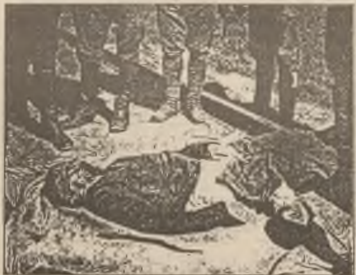
Mrtvola plukovníka Ušakova zohaveného a umučeného od bolševiků (str. 59).