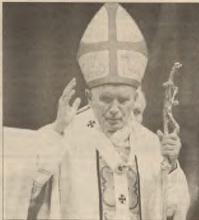
Papež Jan Pavel II. kynul svým věrným v bazilice Sv. Petra v Římě. Při nedělních bohoslužbách prohlásil za blahoslavené pět vynikajících osobností - čtyři Francouze a jednoho Itala.