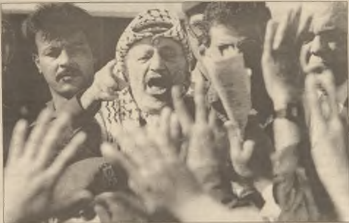
Předseda Organizace pro osvobození Palestiny Jassir Arafat mluvil v neděli k palestinským demonstrantům v pásmu Gáza. V Gáze se vyskytly pouze izolované případy násilností - vydrželo tam vratké příměří mezi PLO a bojovnými povstalci.

Nabil Shhath, vrchní vyjednaváč PLO řekl, že výtržnosti vznikly z toho, že Rabin zakázal zaměstnávání Palestinců v Izraeli, a že mezinárodní dárci neplnili své sliby. Shaath řekl: "Dárcové nám nedali nic než malou stružku pomoci."