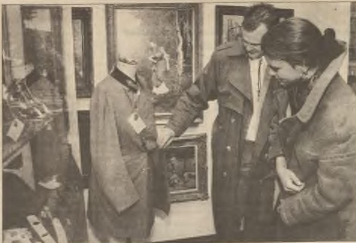
Manželé prohlížejí oblíbený ranní plášť císaře Františka Josefa na soukromé aukci v pondělí ve Vídni. Šaty, dopisy a další předměty habsburské dynastie jsou v aukci tento týden.

Jelcinův slib Clintonovi bezcenný. Když byl na návštěvě ve Washingtonu, slíbil Boris Jelcin Clintonovi, že přestane vyzbrojovat Irán. Zdá se, že to byl od začátku bezcenný slib, který Jelcin vůbec nezamýšlel dodržet. Zdá se také, že Irán rozumí důvodům, proč Jelcin slib udělal, ale jak zdroje zpráv naznačují, očekává, že Rusko bude posílat zbraně i nadále. Teherán urychlí placení Rusku za zbraně již dodané, protože ví, že to zajistí budoucí dodávky a že to pomůže Jelcinovu nebezpečnému hospodářskému postavení doma. (Intelligence Digest)